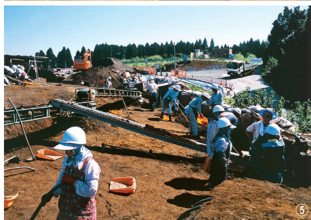
①土層断面 (I～XVII層) ②土層断面 (V～XV層) ③VI層遺物出土状況 (K・L～14・15区) ④VI層遺物出土状況 (K-15区) ⑤作業風景