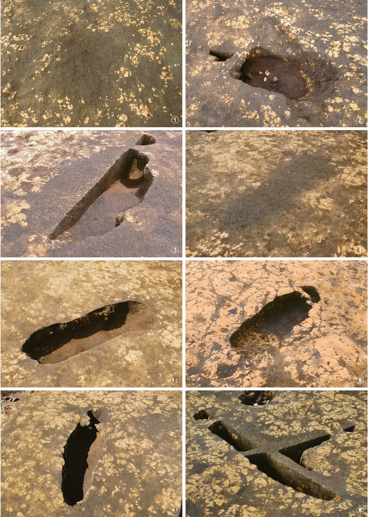
① 4号連穴土坑，4・5号土坑検出状況 ② 4号連穴土坑，4・5号土坑完掘状況 ③ 5号連穴土坑半裁状況 ④ 6号連穴土坑検出状況 ⑤ 6号連穴土坑完掘状況 ⑥ 7号連穴土坑完掘状況 ⑦ 8号連穴土坑完掘状況 ⑧ 9・10号連穴土坑半裁状況