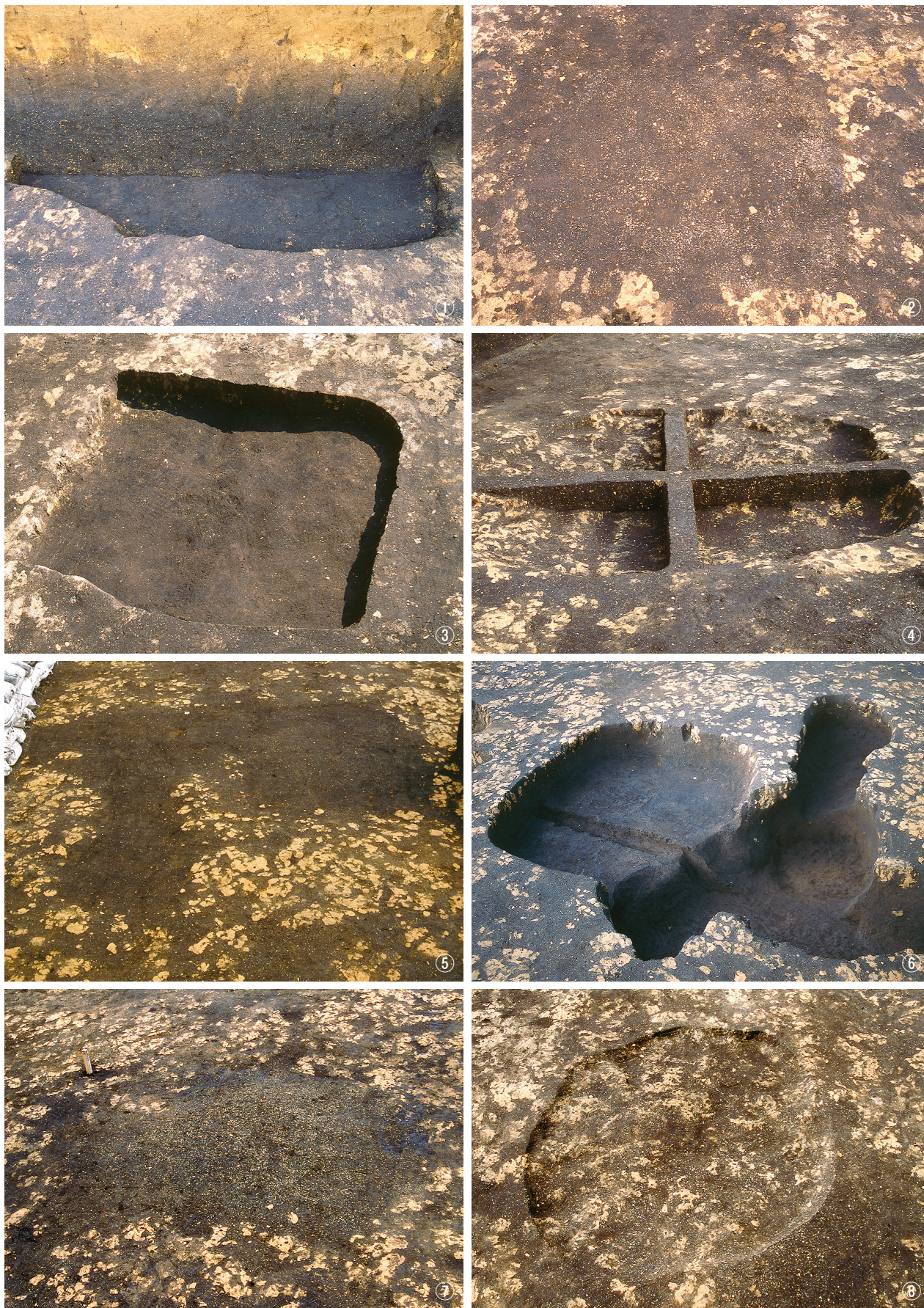
① 5号竖穴住居状遺構完掘狀況 ② 6号竖穴住居状遺構検出狀況 ③ 6号竖穴住居状遺構完掘狀況 ④ 7号竖穴住居状遺構埋土堆積狀況 ⑤ 8号竖穴住居状遺構, 3号連穴土坑, 2号土坑検出狀況 ⑥ 8号竖穴住居状遺構, 3号連穴土坑, 2号土坑完掘狀況 ⑦ 9号竖穴住居状遺構検出狀況 ⑧ 9号竖穴住居状遺構完掘狀況