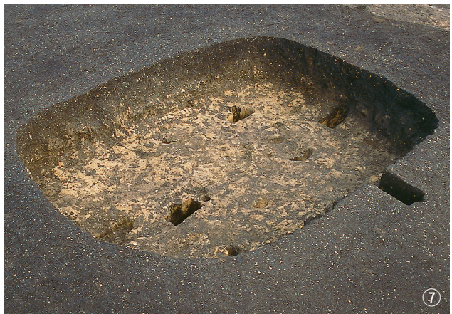
① 1号竖穴住居状遺構検出状況 ② 1号竖穴住居状遺構, 1号連穴土坑埋土堆積状況 ③ 1号竖穴住居状遺構, 1・2号連穴土坑完掘状況 ④ 3号竖穴住居状遺構遺物出土状況 ⑤ 3号竖穴住居状遺構完掘状況 ⑥ 4号竖穴住居状遺構埋土堆積状況 ⑦ 4号竖穴住居状遺構完掘状況