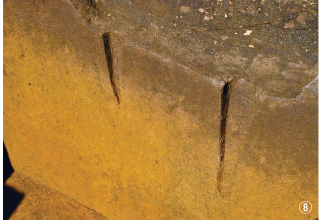
① 1号落とし穴検出状況 ② 1号落とし穴完掘状況 ③ 2号落とし穴埋土堆積状況 ④ 3号落とし穴完掘状況 ⑤ 4号落とし穴埋土堆積状況 ⑥ 4号落とし穴完掘状況 ⑦ 5号落とし穴埋土堆積状況 ⑧ 5号落とし穴逆茂木