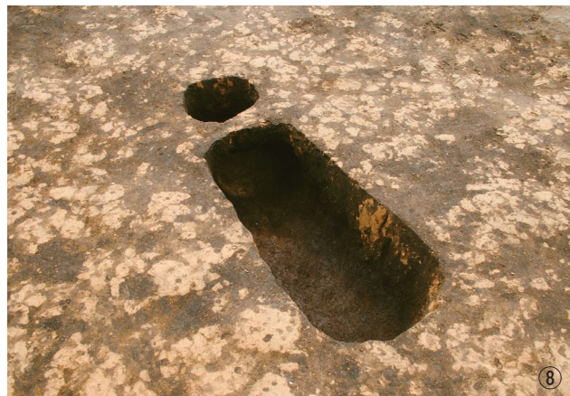
① 9・10号連穴土坑完掘狀況 ② 11号連穴土坑埋土堆積狀況 ③ 12・13号連穴土坑完掘狀況 ④ 14号連穴土坑半裁狀況 ⑤ 14号連穴土坑完掘狀況 ⑥ 15号連穴土坑遺物出土狀況 ⑦ 16号連穴土坑完掘狀況 ⑧ 17号連穴土坑完掘狀況