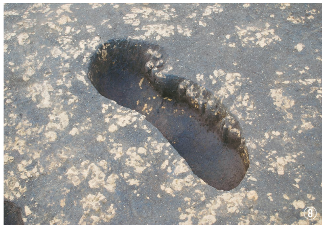
① 24号連穴土坑埋土堆積狀況 ② 24号連穴土坑完掘狀況 ③ 25号連穴土坑完掘狀況 ④ 27号連穴土坑完掘狀況 ⑤ 28号連穴土坑, 6・7号土坑完掘狀況 ⑥ 29号連穴土坑完掘狀況 ⑦ 30号連穴土坑完掘狀況 ⑧ 31号連穴土坑完掘狀況