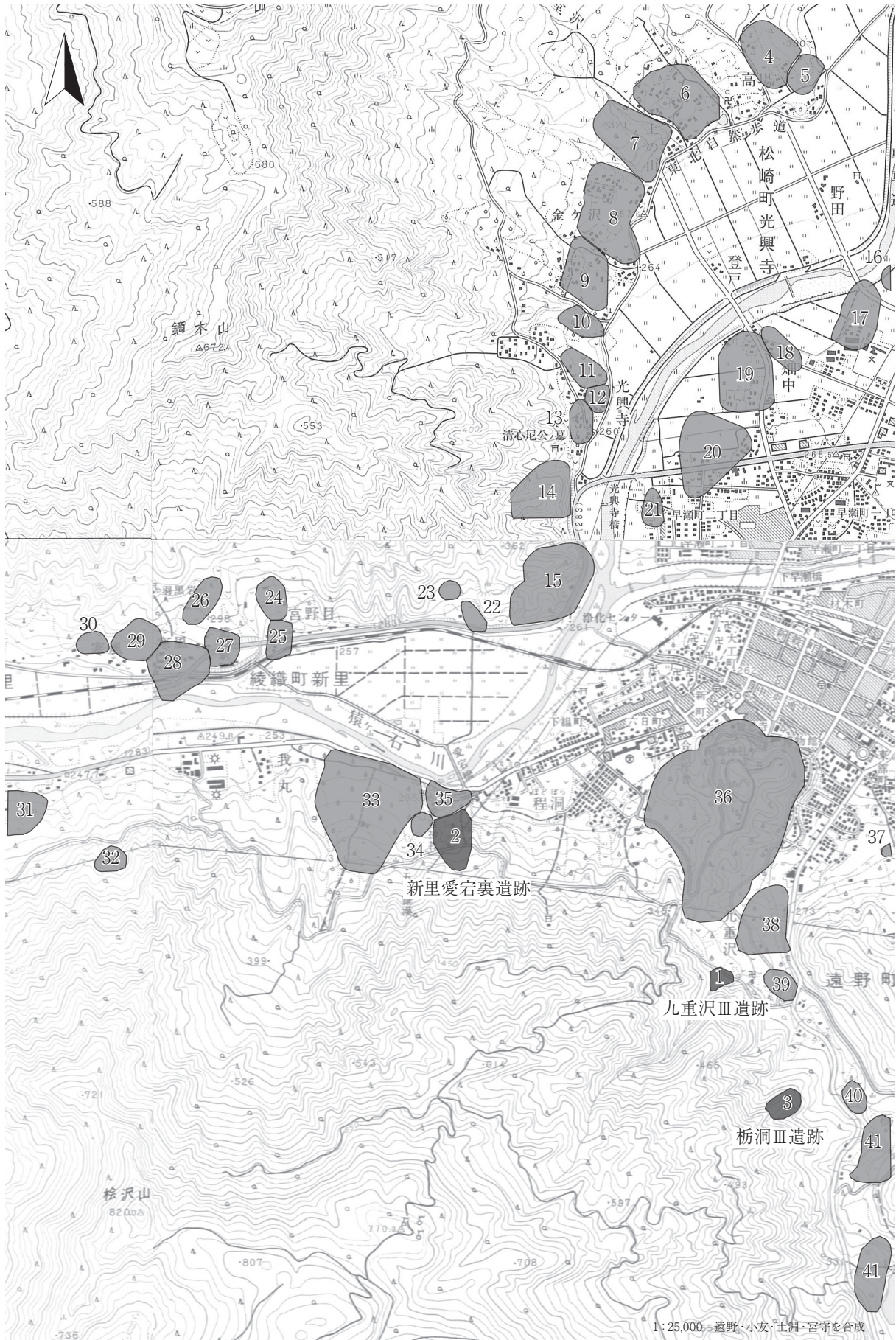
第4図 周辺遺跡分布図(1)