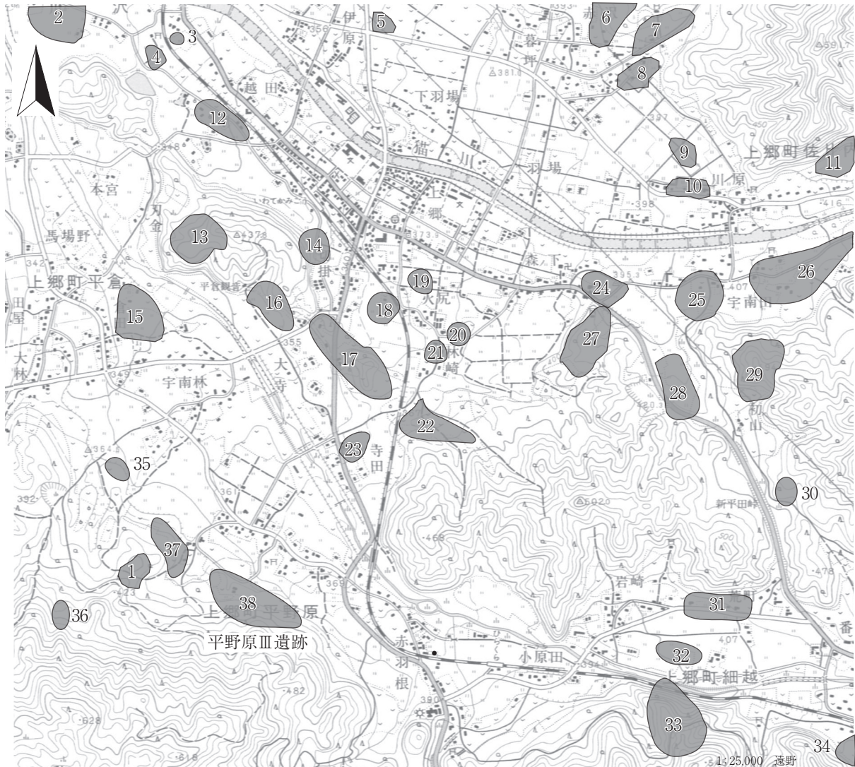
第5図 周辺遺跡分布図(2)