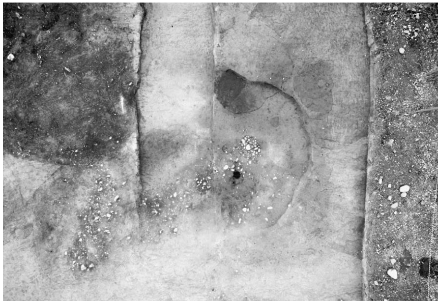
第 1 号竖穴建物跡 (1)