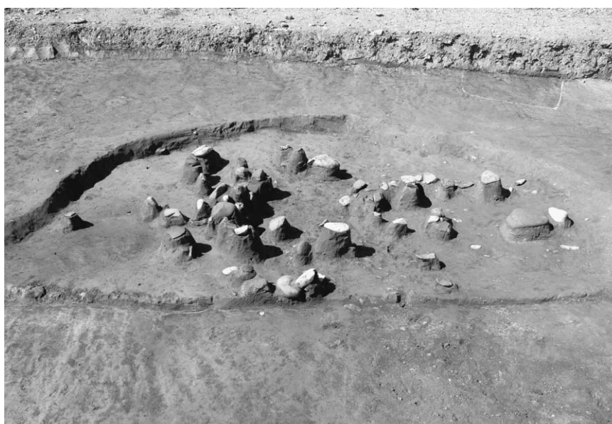
第 1 号竖穴建物跡遺物出土状況