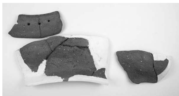
第 2 号竖穴建物跡出土土器(1)