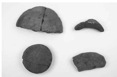
第 2 号竖穴建物跡出土土器(33~36)