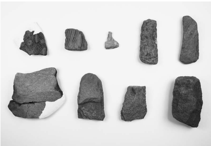
調査区出土土器・石器