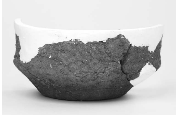
第2号竖穴建物跡出土土器(32)