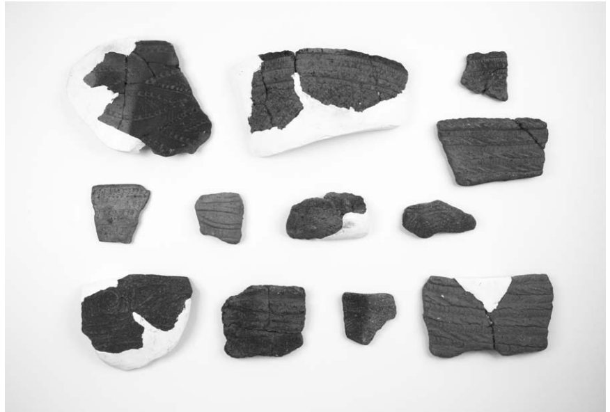
第 1 号竖穴建物跡出土土器 (1~12)