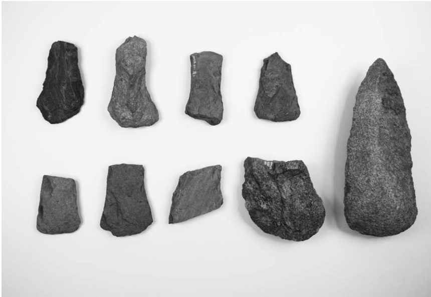
第 1 号竖穴建物跡出土石器 (1~9)