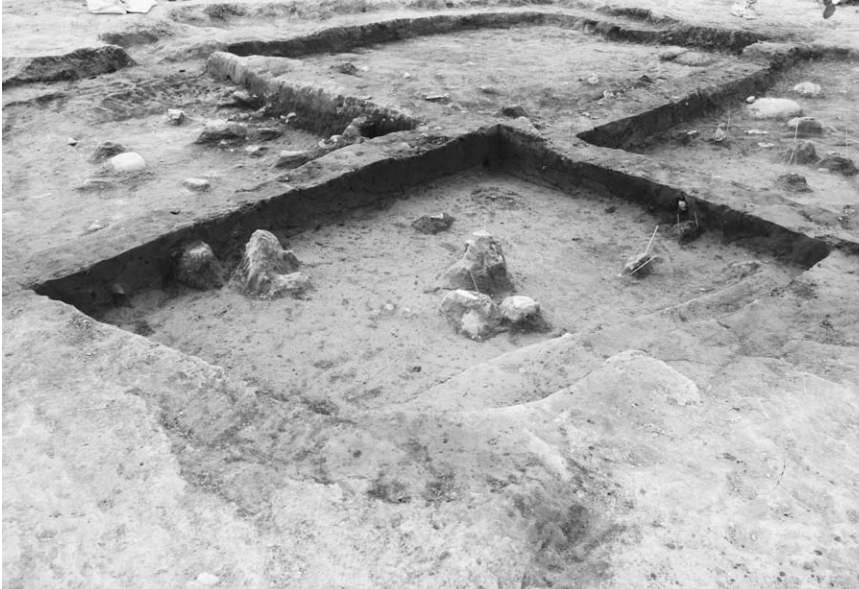
第 2 号竖穴建物跡土層断面