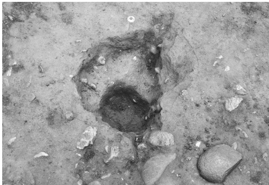
第 1 号竖穴建物跡埋甕炉掘方