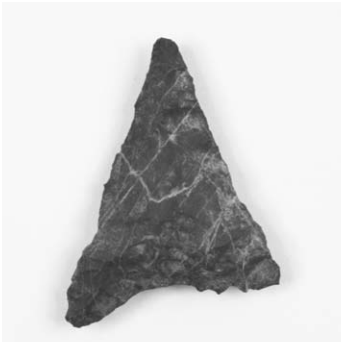
第2号竖穴建物跡出土石器(1)