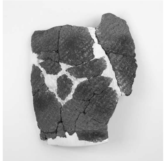
第 1 号竖穴建物跡出土土器 (39)