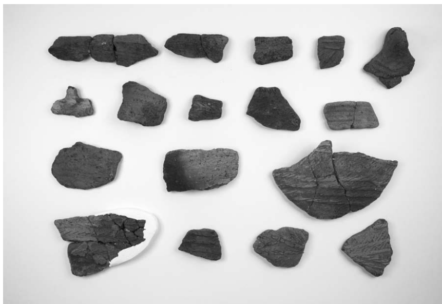
第 2 号竖穴建物跡出土土器 (2~13・15~18)