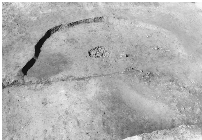
第 1 号竖穴建物跡 (2)