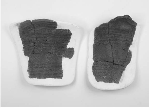
第2号竖穴建物跡出土土器(16)