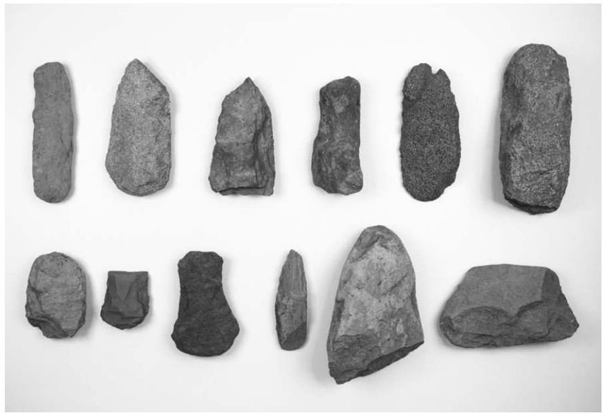
第2号竖穴建物跡出土石器(2~13)