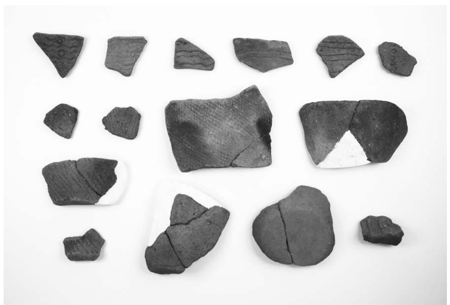
第 1 号竖穴建物跡出土土器 (27~35・37・38・40~43)