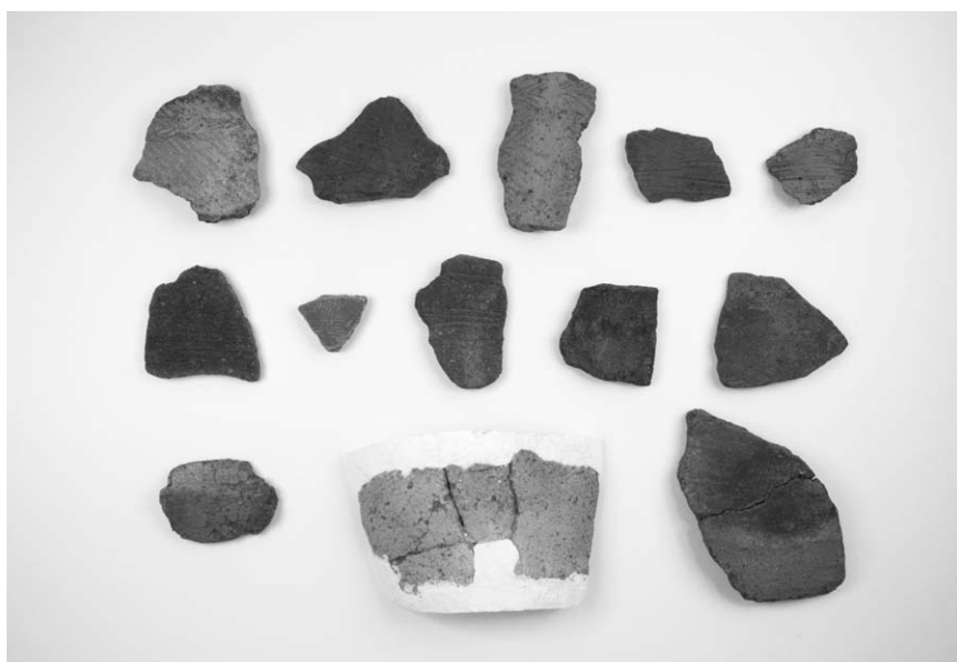
第 2 号竖穴建物跡出土土器 (19~31)