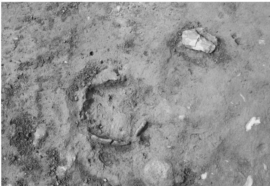
第 1 号竖穴建物跡埋甕炉(1)