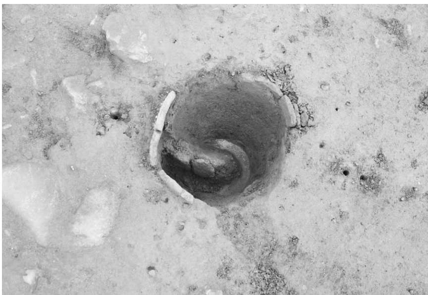
第 1 号竖穴建物跡埋甕炉(2)