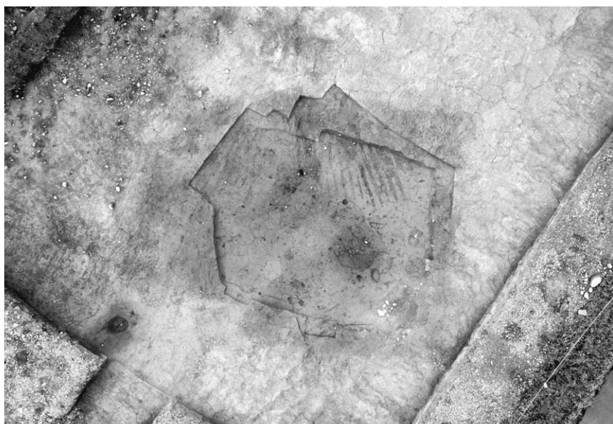
第 2 号竖穴建物跡(1)