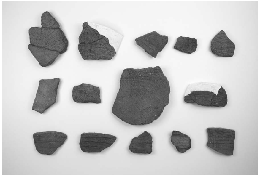
第 1 号竖穴建物跡出土土器 (13~26)