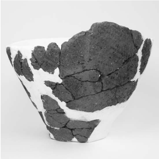
第 1 号竖穴建物跡出土土器 (36)