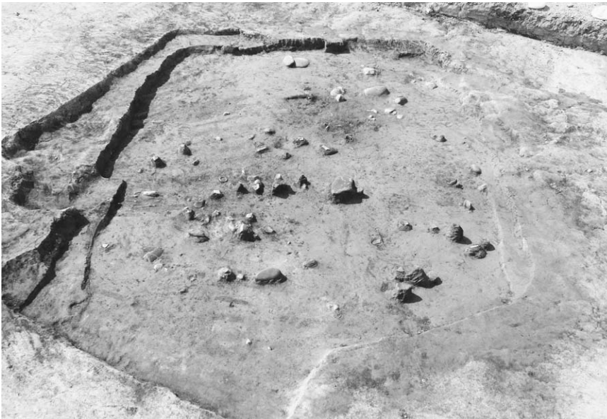
第 2 号竖穴建物跡遺物出土状況