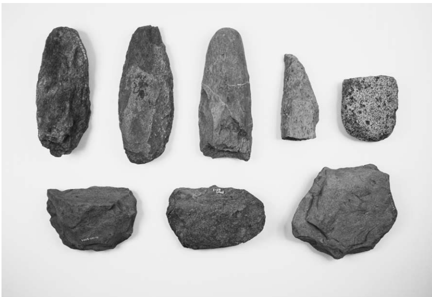
第 1 号竖穴建物跡出土石器 (10~17)