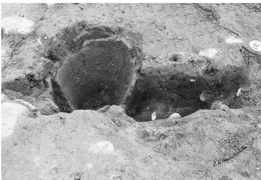
第 1 号竖穴建物跡埋甕炉(3)