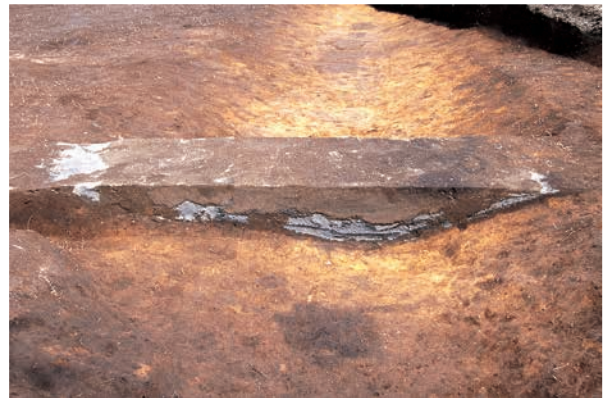
RG04 溝跡に堆積した川屋スコリア