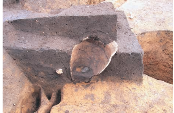
内部に礫を入られた埋設土器 (RZ04)