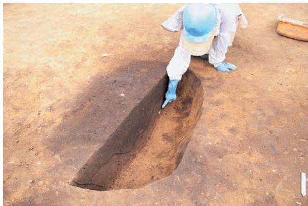
RA13 張出部下位の墓壇 (RD68)