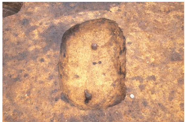
同左 (石鏃・異形石器を副葬)