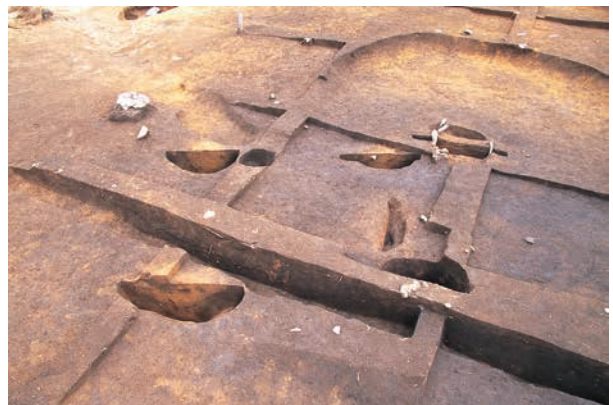
敷土を伴う方形柱穴列 (RB04)