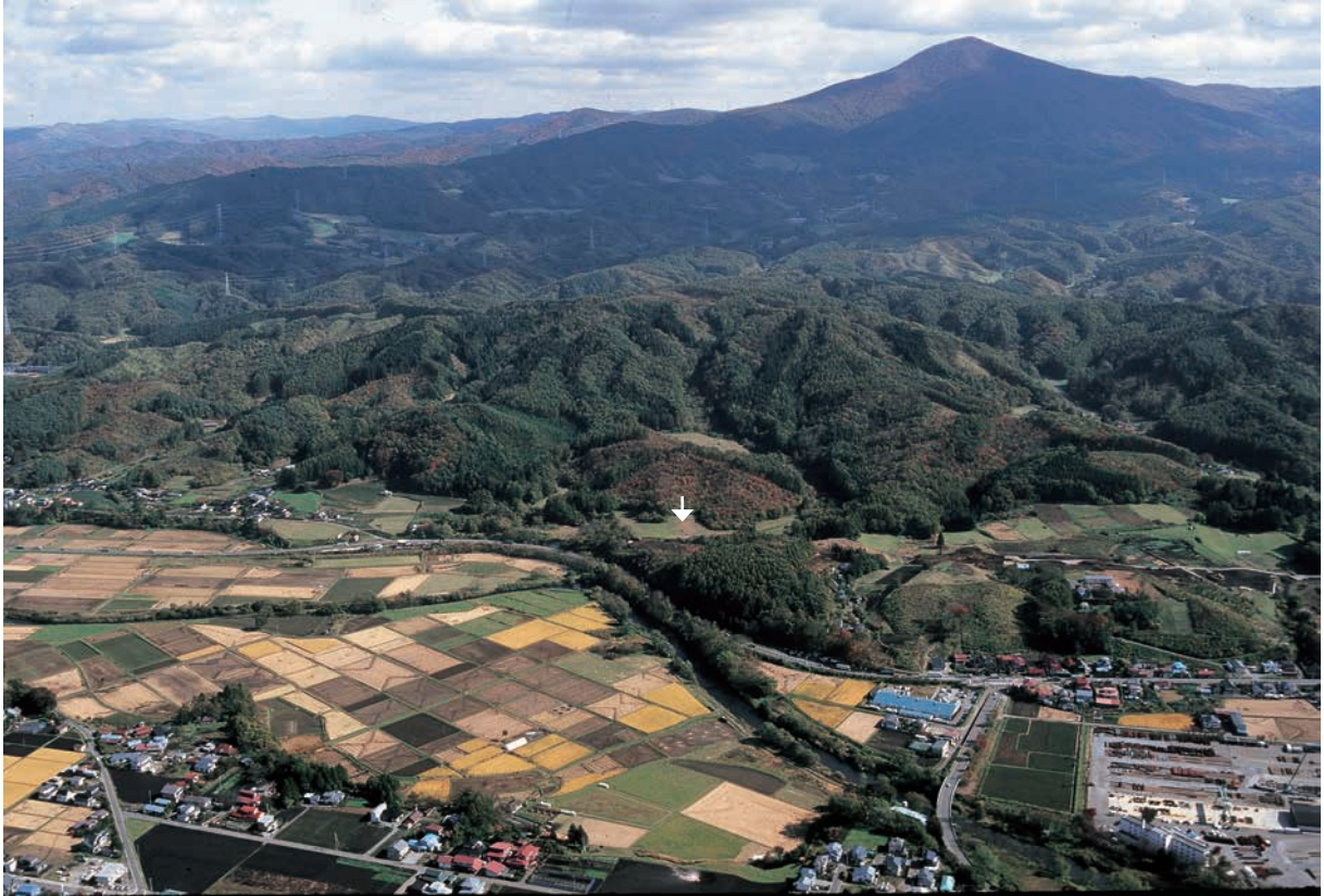
調査区遠景（西から）