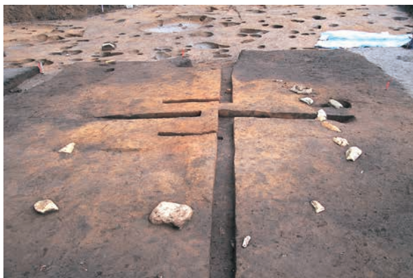
同上 (検出時の状況)