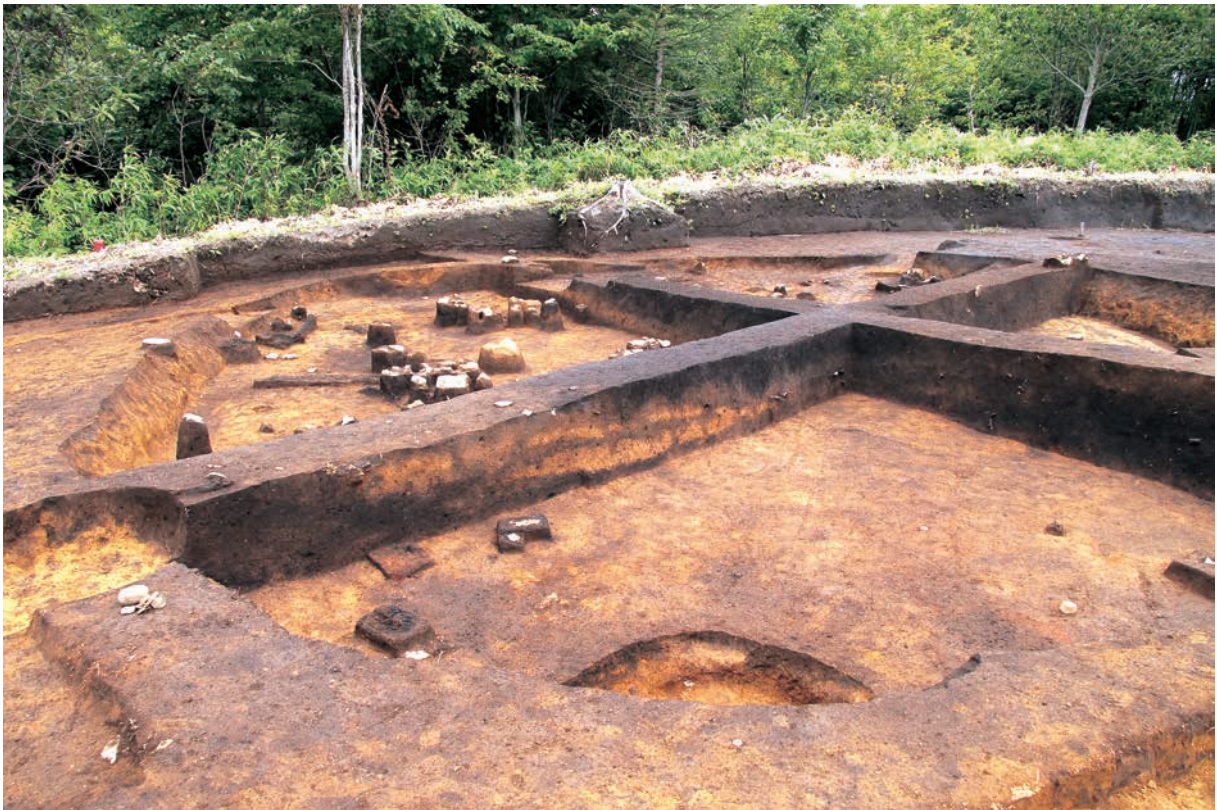
断面にみる人為的黃褐色土層 (RA12)