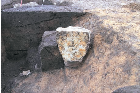
粘土を充填された埋設土器 (RZ07)