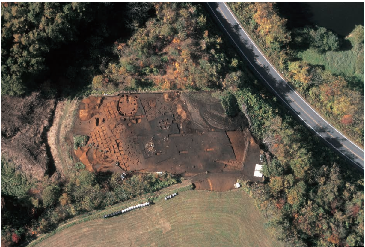
空中写真（平成 21 年度）