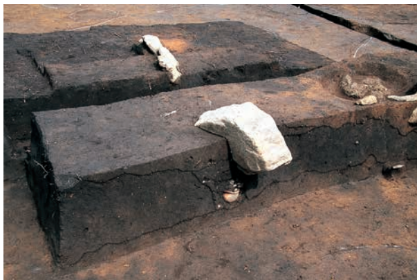
RA13 長軸北端に埋納された小形土器 (RZ12)