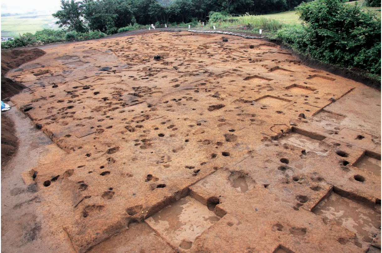
平成 23 年度調査終了全景（南西→）