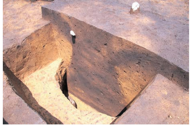
開口部付近を黄褐色土で埋められた土坑 (RD12)