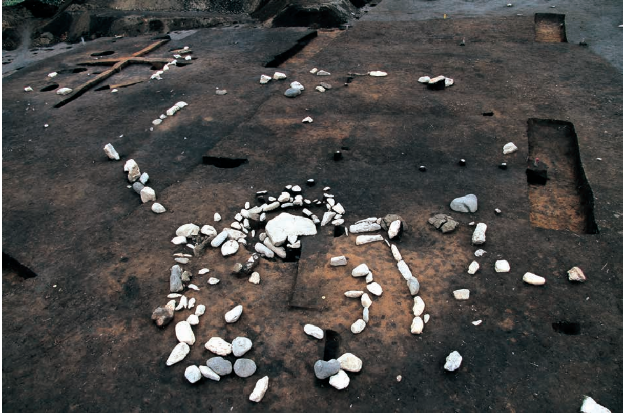
配石・敷土を伴う柄鏡形住居状遺構 (RA13)