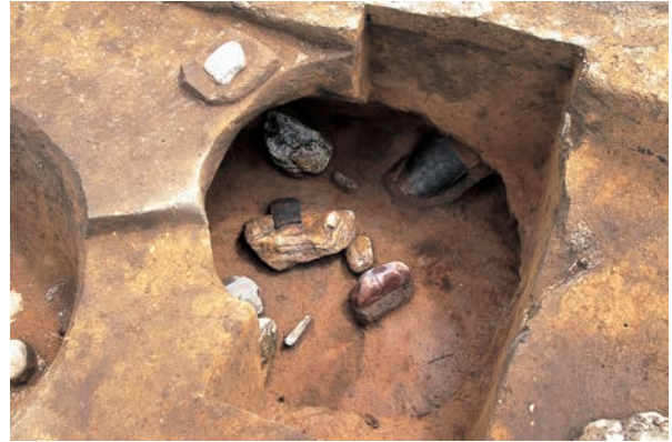
底面に礫と深鉢が入られた土坑 (RD66)