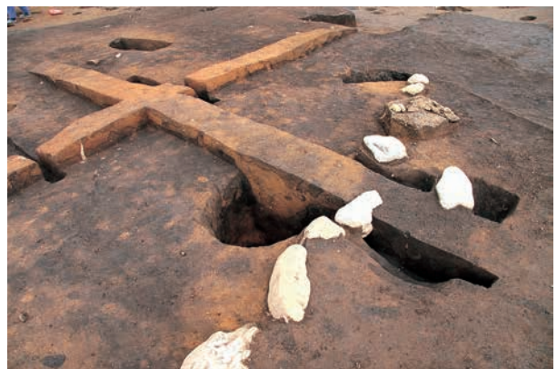
同上 (柱設置→柱撤去→配石・敷土→焼土生成)