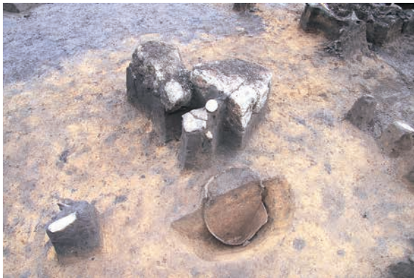
RZ03 埋設土器に添え置かれた大形礫