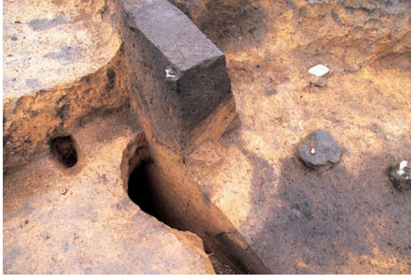
内部の大半を黄褐色土で埋められた土坑 (RD21)