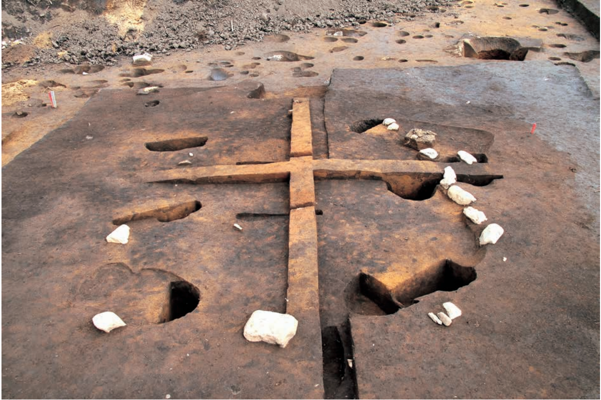
配石・敷土を伴う方形柱穴列 (RB01)