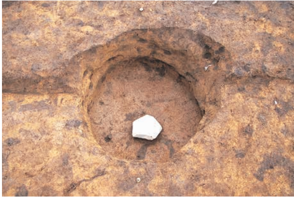
底面に礫を入られた土坑 (RD49)