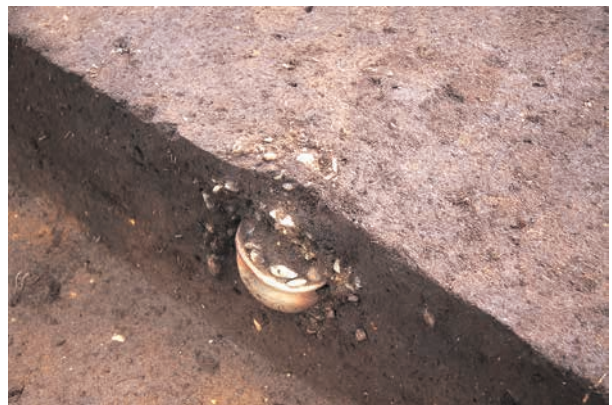
同左 (内外に砂礫充填)