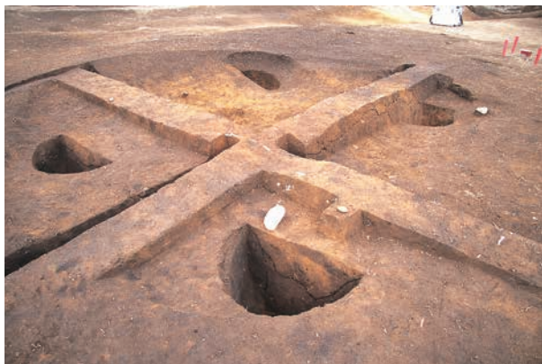
敷土を伴う方形柱穴列 (RB03)