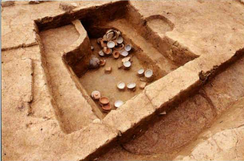
土器廃棄土坑（7世紀中頃・南東から）