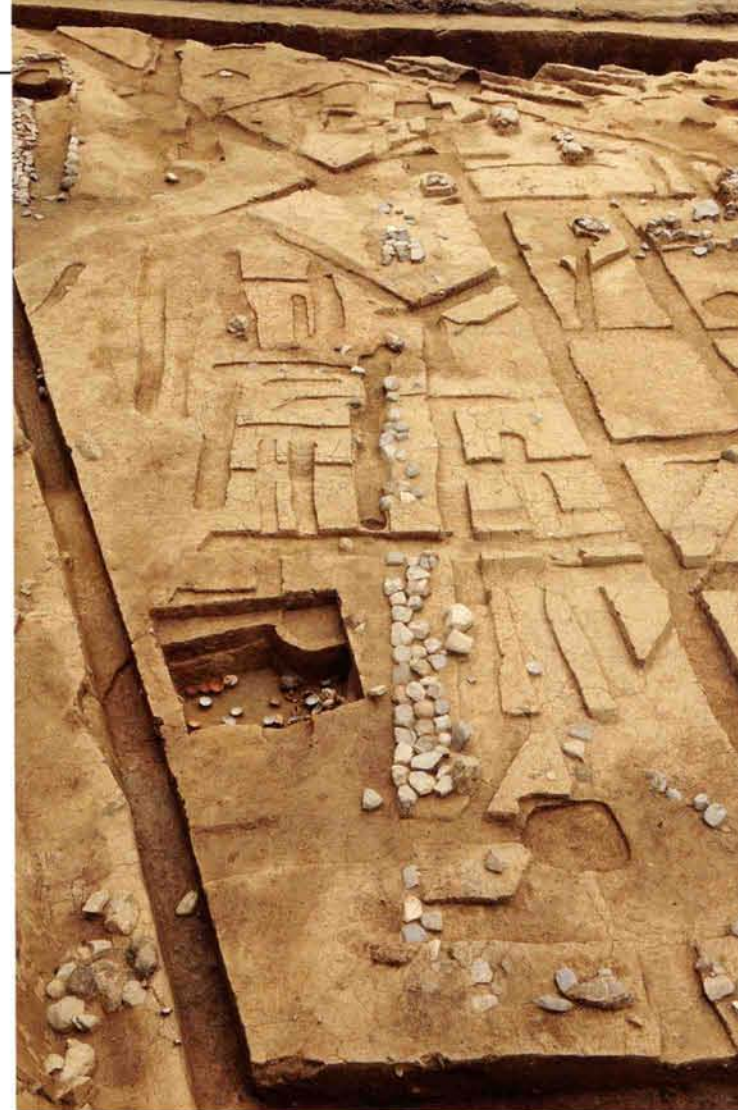
石組溝と土器廃棄土坑（北西から）