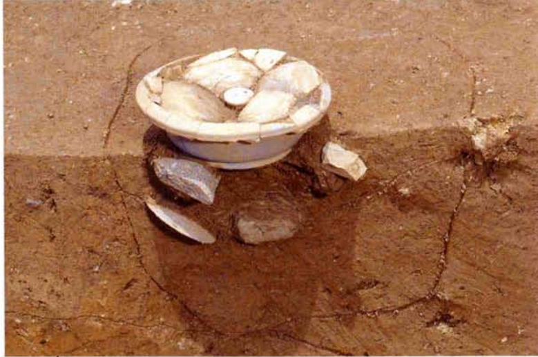
土器埋設遺構（7世紀末～8世紀初頭・南から）