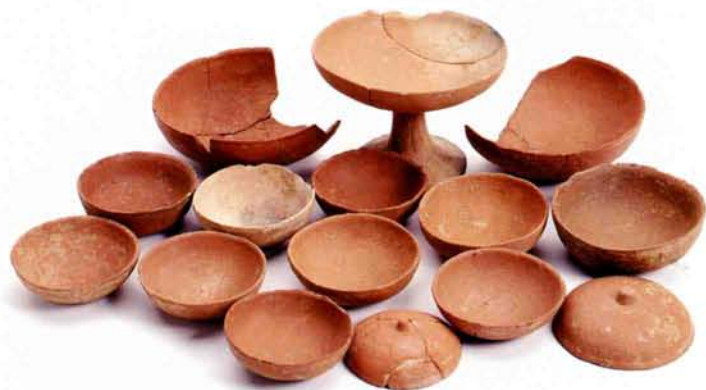
廃棄土坑出土 土師器