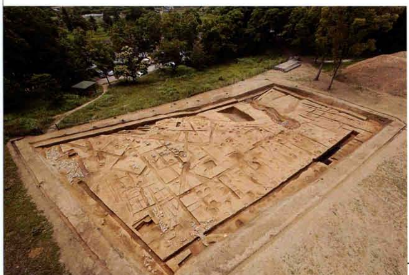
調査区全景（北から）