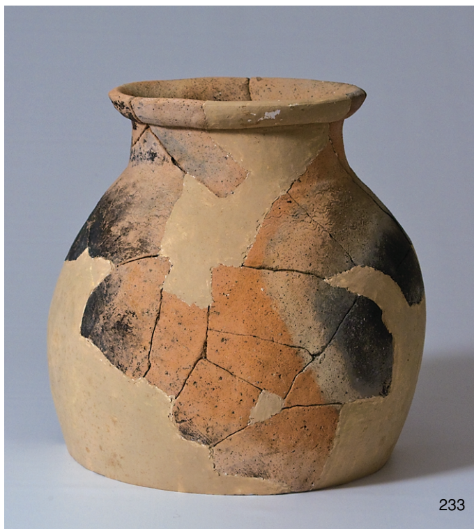
南区SK14出土弥生土器