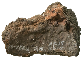
サンプル1 内面 SK15-1