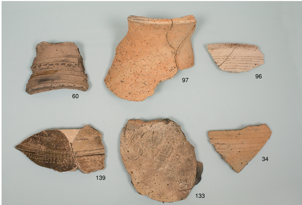
北区SX1 (34)、北区包含層 (60,96,97)、南区SD2 (133)、SX2 (139)、 出土した弥生土器