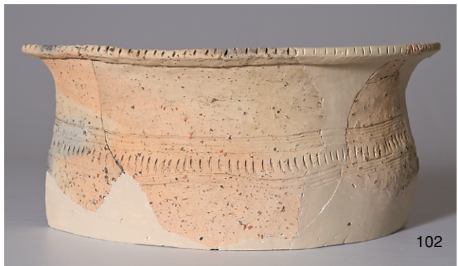
北区包含層出土弥生土器