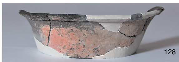
南区SK15 (142,144)、SK19 (127,128)、SX2 (137) 出土弥生土器