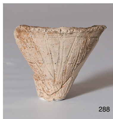
南区SX3 (246,247)、P135 (259)、包含層 (266,273,274,283,288) 出土弥生土器