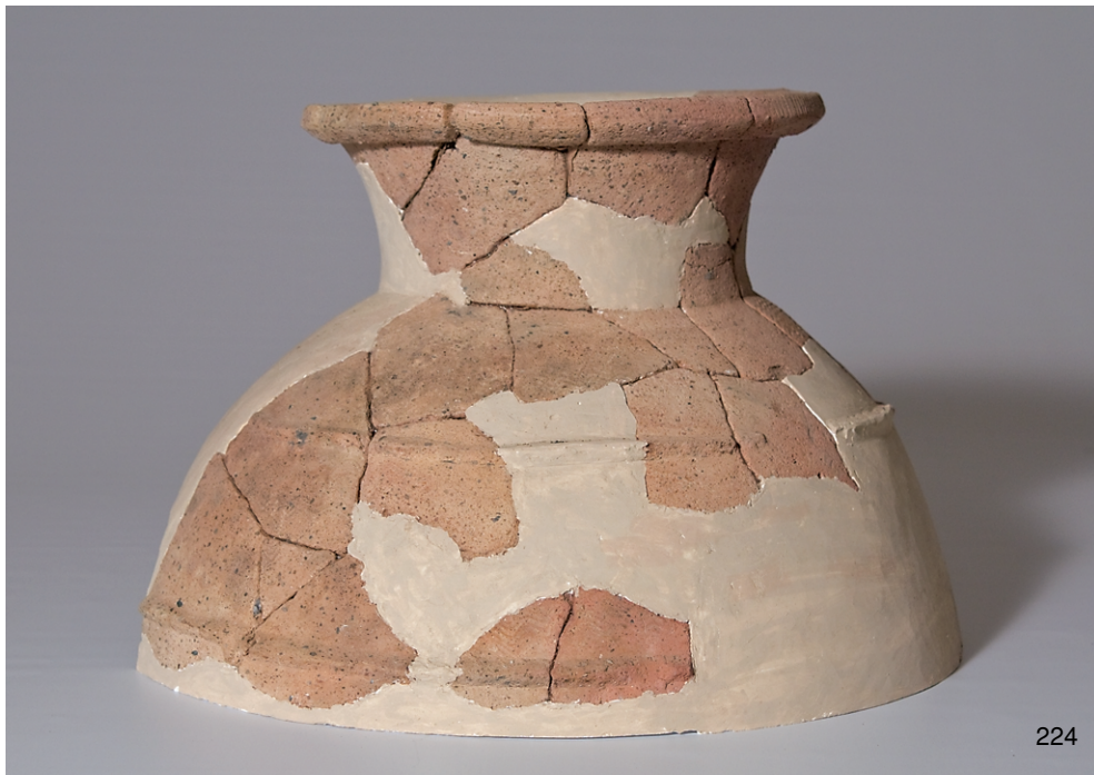
南区SK14出土弥生土器