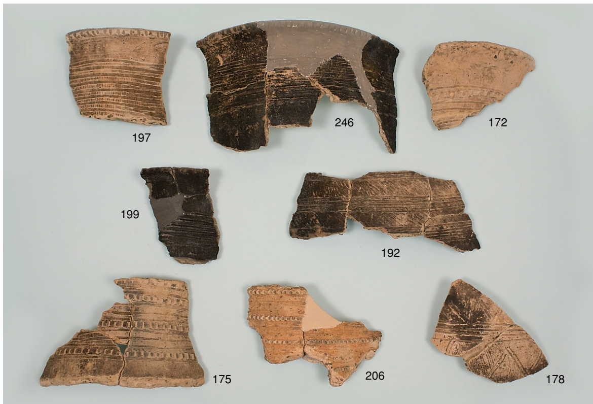
南区SK29 (172,175,178)、SK31 (31,192)、SK35 (197,199)、 SD3 (206)、SX3 (246) 出土ヘラ描き沈線を施した弥生土器