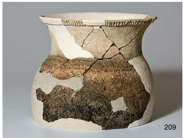
南区SK12 (169)、SK15 (153,155,160)、SK28 (171,179)、SK31 (187)、SD3 (209) 出土弥生土器