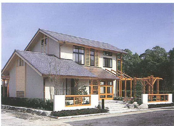
木曽五木を使った住宅

学校などの公共施設では、カラマツの集成材を利用しているところが増えている。これからは赤身と木目が特徴的なカラマツの住宅利用が見込まれる。