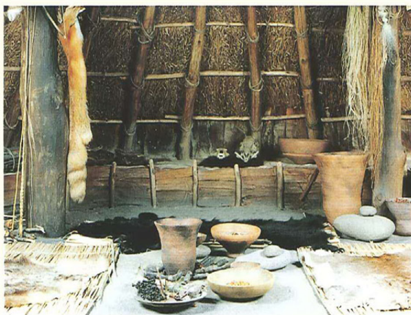
炉であかりをとる（長野県立歴史館常設展示室） 炉はあかりをとる、調理をする、暖房をするなどの役割があった。