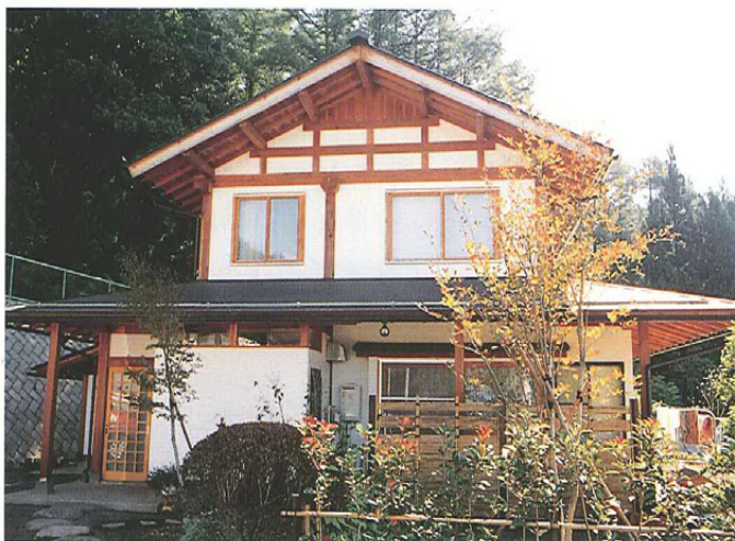
カラマツを使った住宅

学校などの公共施設では、カラマツの集成材を利用しているところが増えている。これからは赤身と木目が特徴的なカラマツの住宅利用が見込まれる。