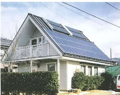
新エネルギーを利用した住宅