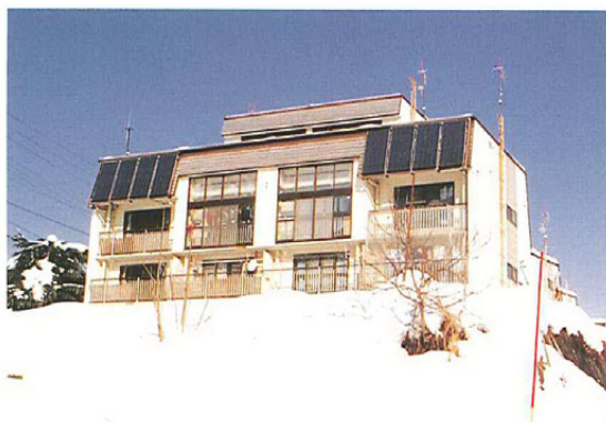
屋根の融雪ができる住宅（飯山市 2001年撮影）

太陽光発電の利用で、日照時間に恵まれた松本市など県中南部では、使用量を上回る発電量が期待できる。