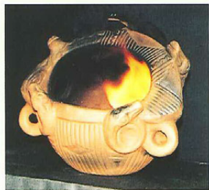
釣手土器（諏訪市博物館蔵） 複製した釣手土器で火を燃やしている。