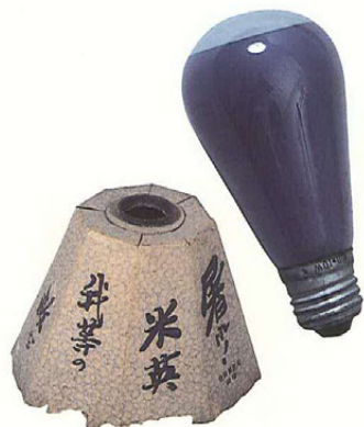
灯火管制の電球とおおい