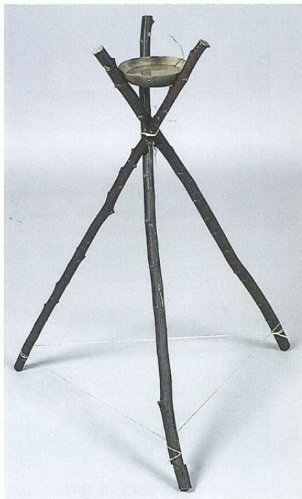
結灯台と油皿（長野県立歴史館蔵） 植物からしぼった油を入れて、芯を立てて使った。 油は高価だった。