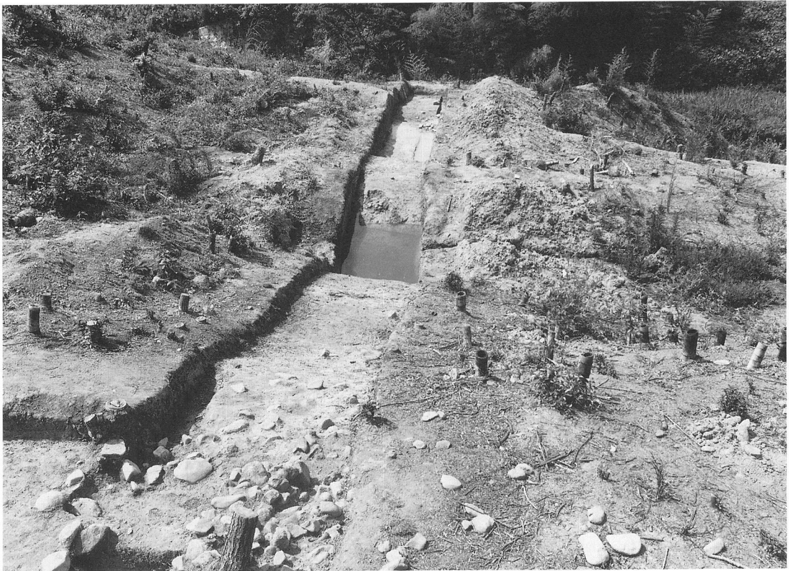
基壇斜面と裾の溝（北方から）