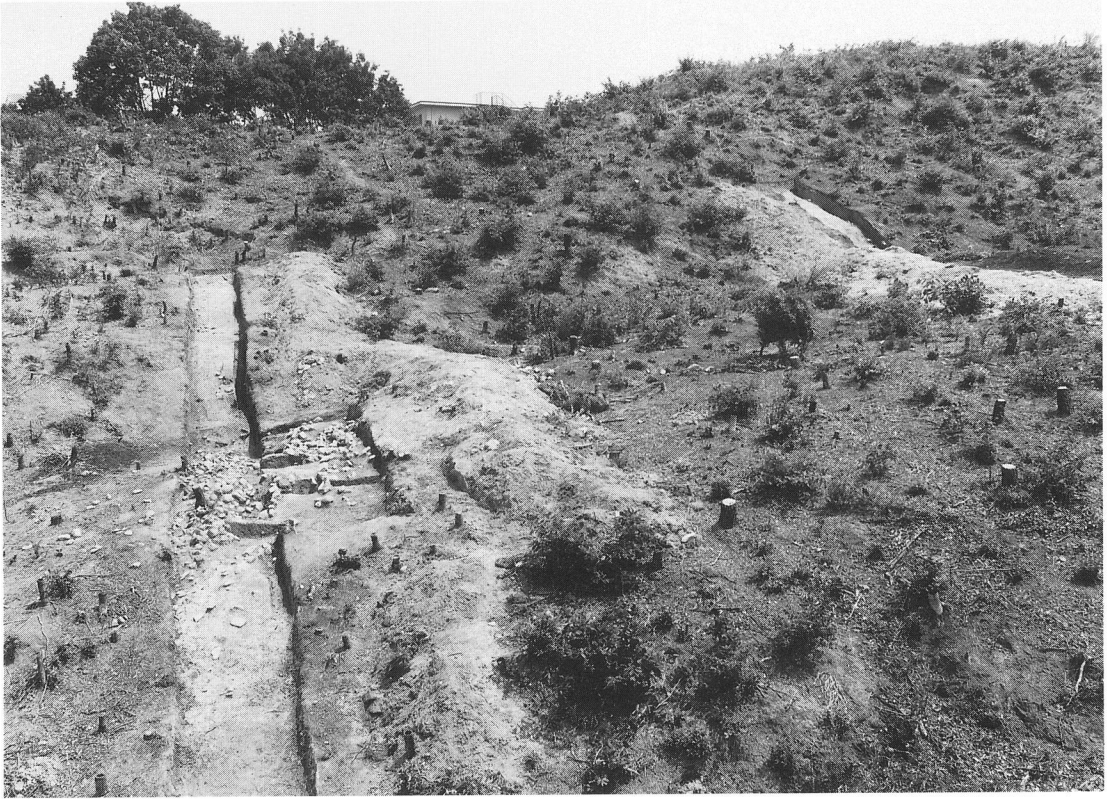
墳丘南面と基壇テラスの葺石（南方から）