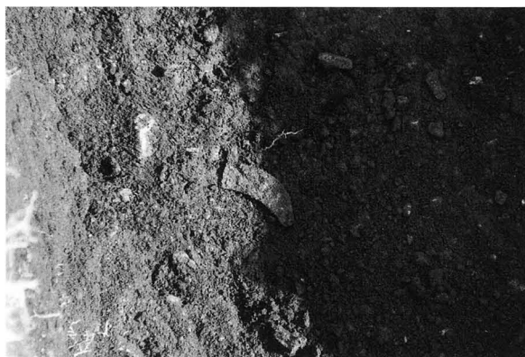
図版4 鉄鎌出土状態