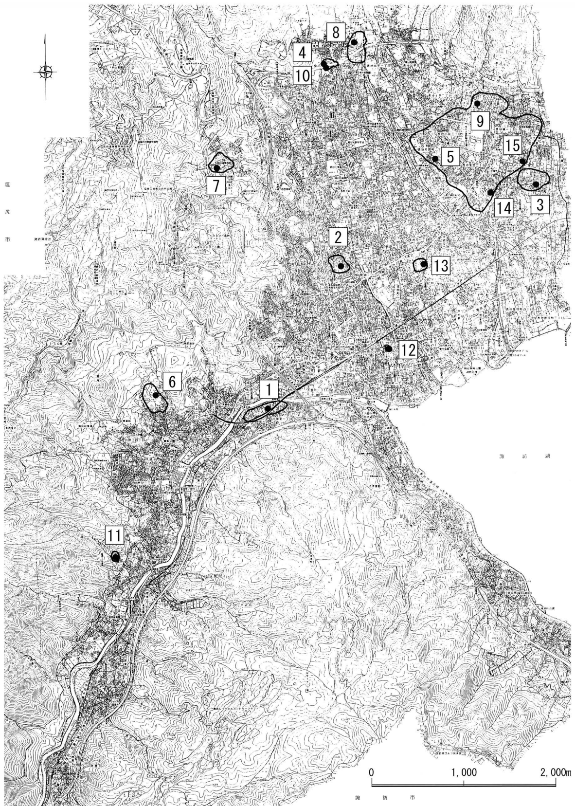
第1図 試掘・確認発掘調査地点（番号は第1表の一覧表に同じ）（1：40,000）