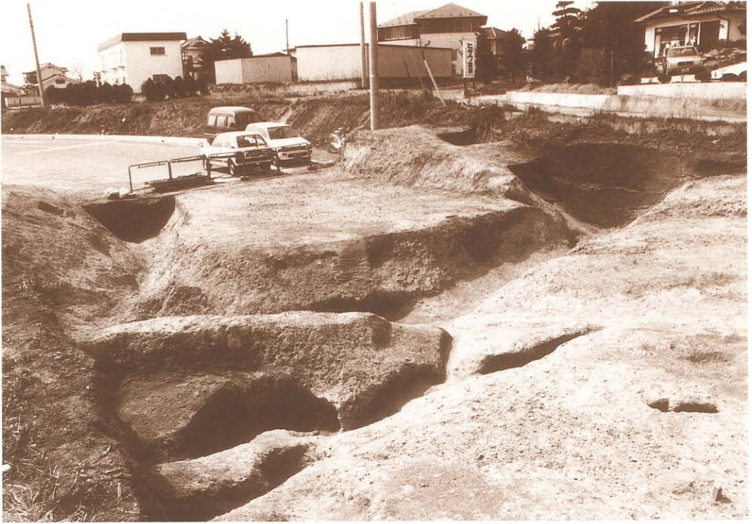
M3・M4 接続部分（東から）