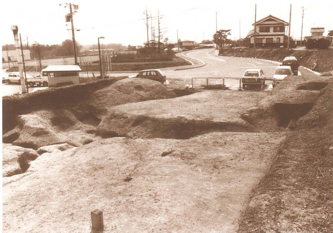
M3・M4 接続部分（北東から）