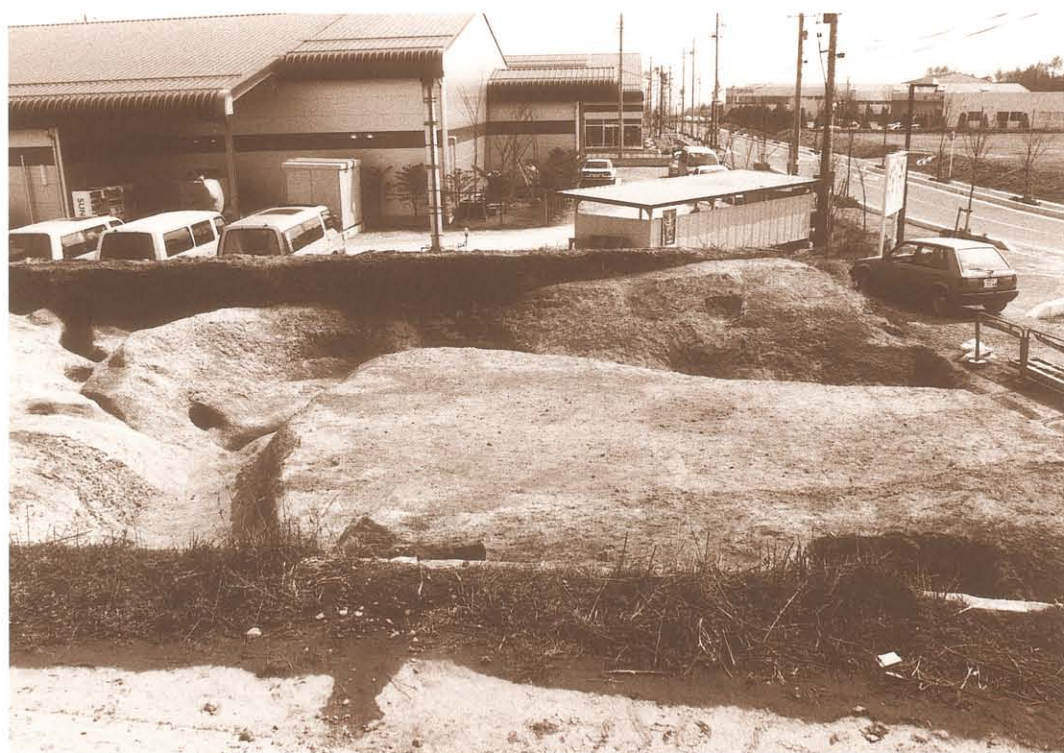
M3・M4 接続部分（北から）