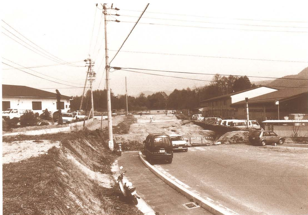
調査区近景（西から）