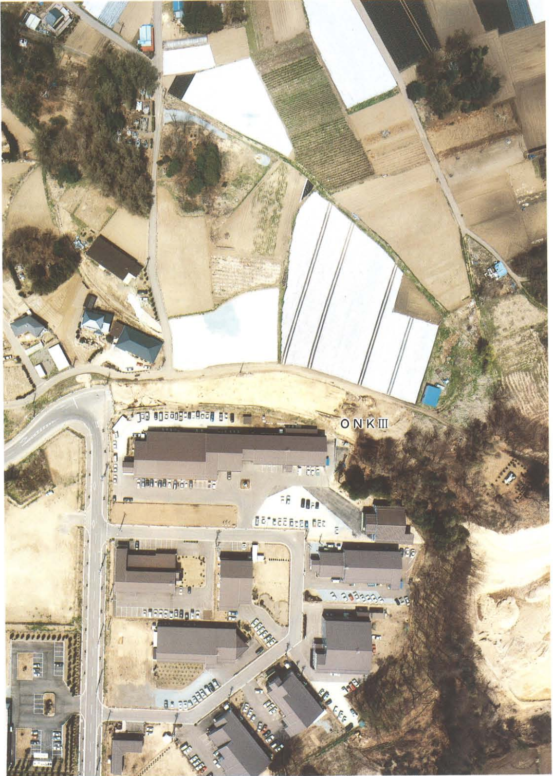
金井城跡付近航空写真（株式会社協同測量社撮影）