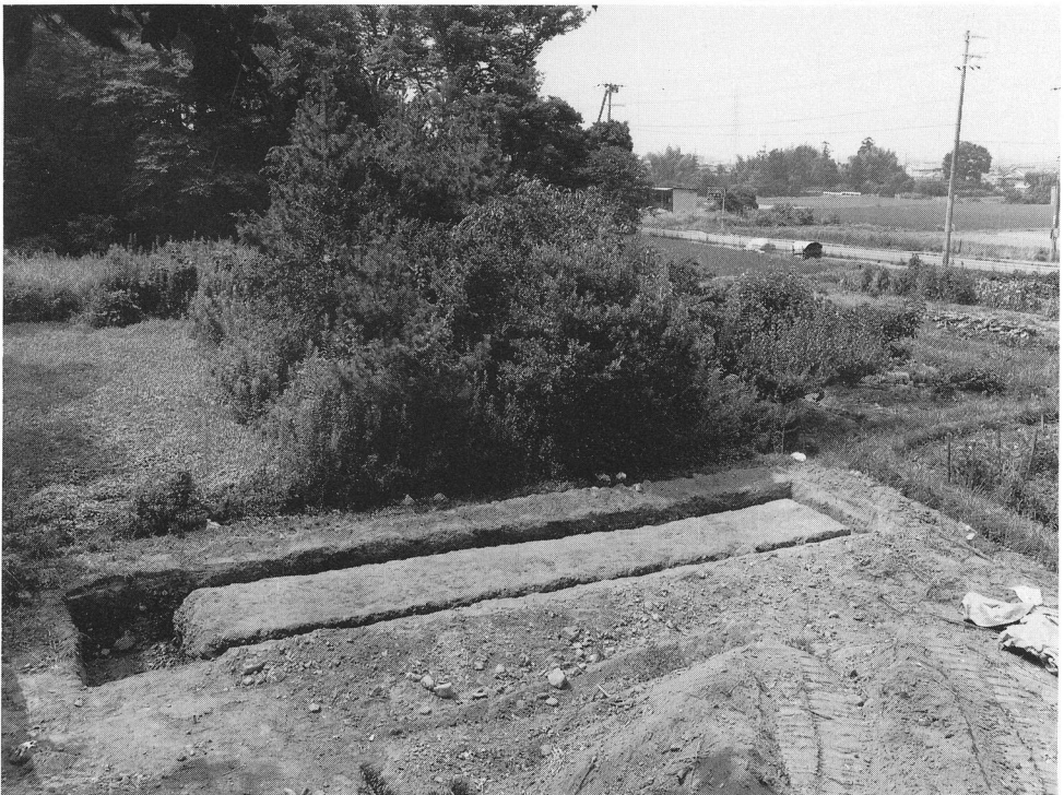
写真3 第2調査区(北方から)