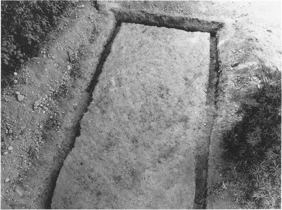
写真2 第1調査区(北方から)