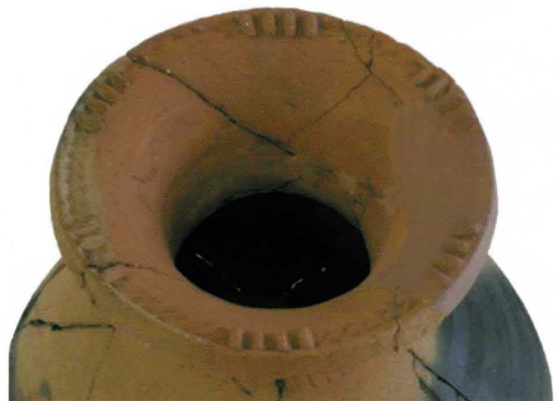
棒状の浮文で装飾された弥生時代中期の壺