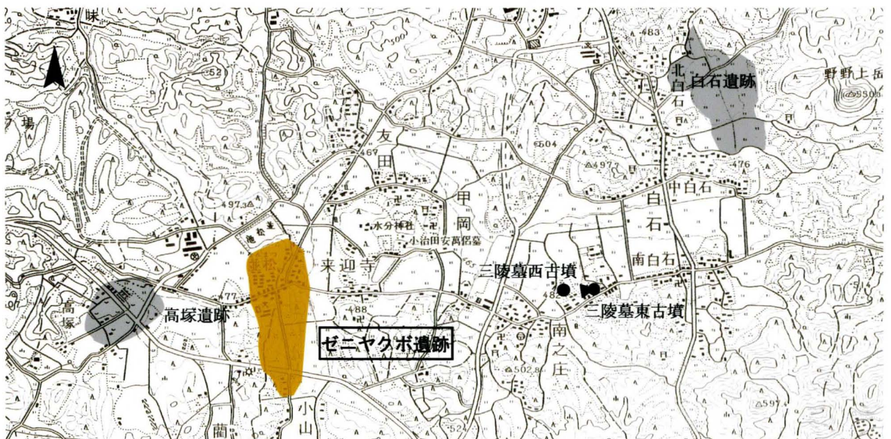
ゼニヤクボ遺跡と周辺の遺跡位置図 1/25,000