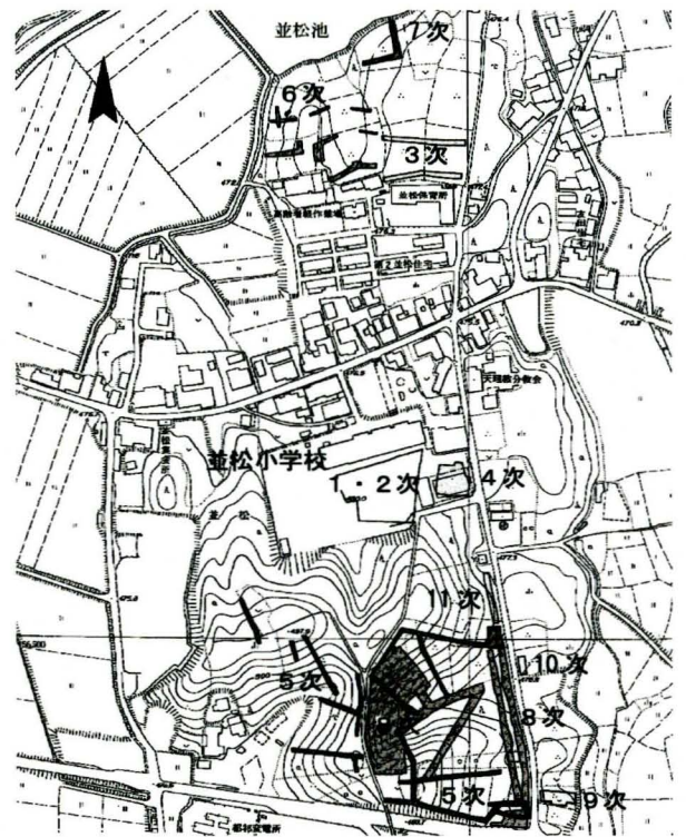
ゼニヤクボ遺跡の発掘区 1/6,000

思われる形・文様をもつものもあり、都祁地域は古くから大和と東国とをつなぐ交通の要所であったと考えられます。