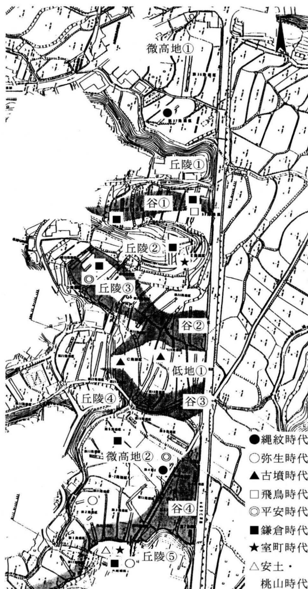
調査地の地形と時代別の遺構分布 1/4,000