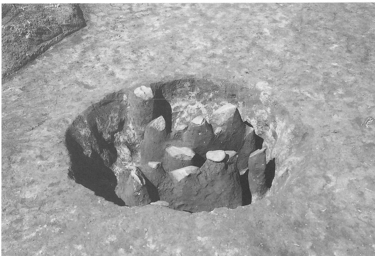
写真47 小竪穴 6 土器出土状態