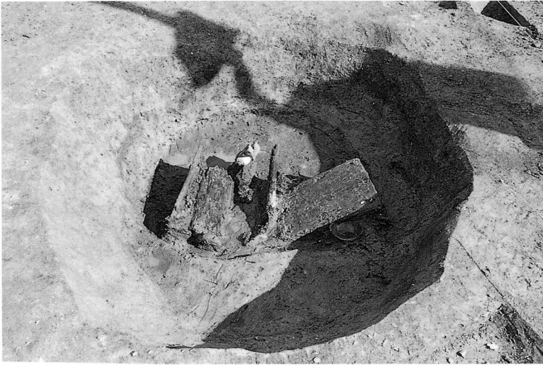
南トレンチ 井戸・SE-01 中層上 検出状況 (西から)