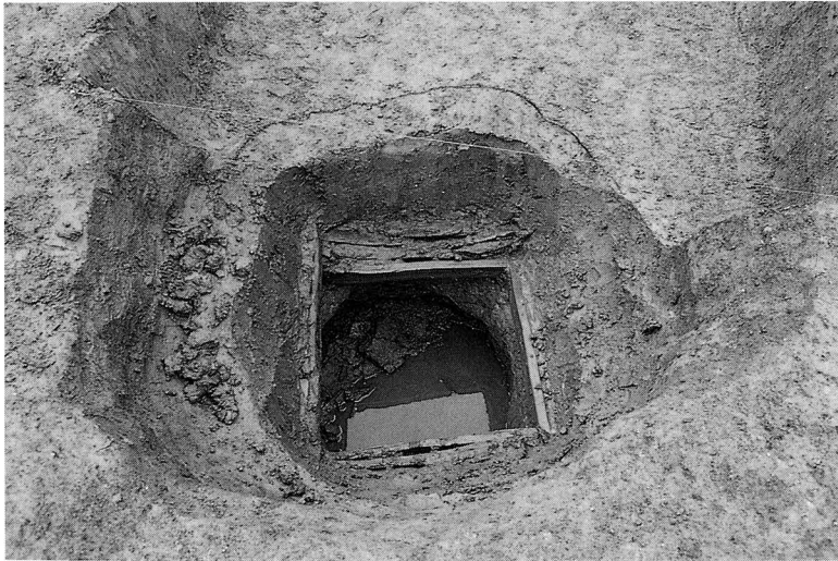
南トレンチ 井戸・SE-01 完掘状況 (西から)