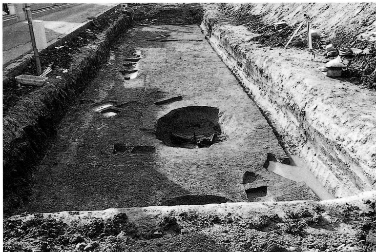
南トレンチ 遺構完掘状況 (東から)