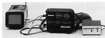
右より、コントロールボックス、 電池、モニター