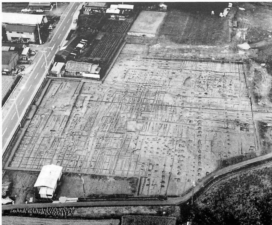
3 上 藤原宮第45-2次調査区横穴(西から) 下 藤原宮第46次調査区(南から)