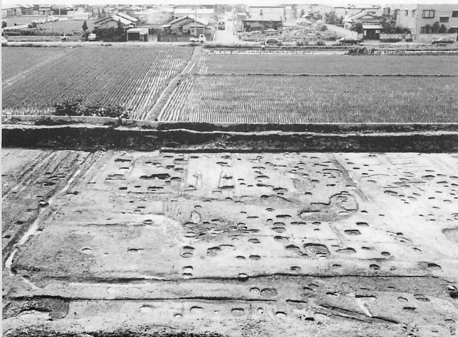
6 上 平城京右京八条一坊十三・十四坪(北東から) 下 平城京左京九条三坊十坪 \frac{1}{2} 町宅地(東から)