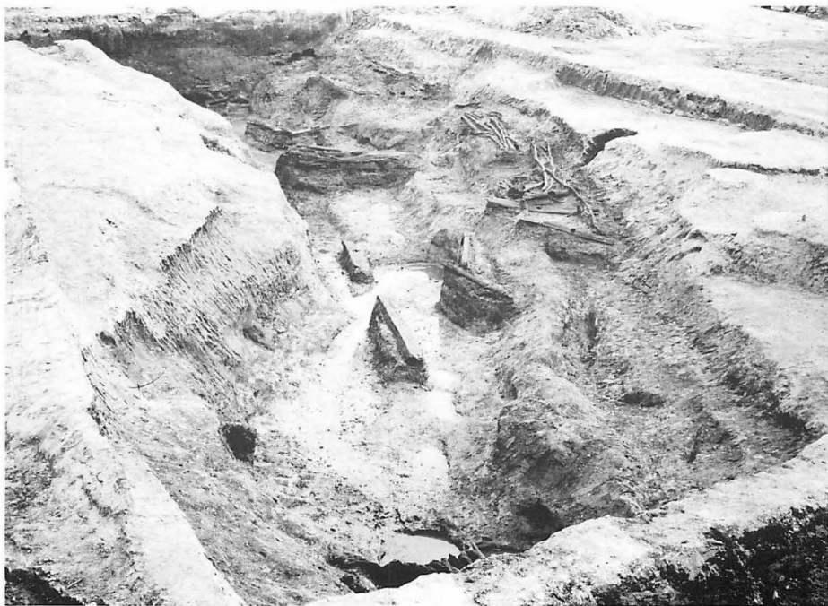
5 上 平城宮第一次朝堂院東南地区(西から)