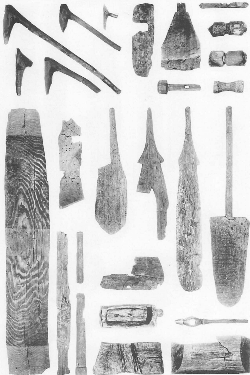
8 平城宮第一次朝堂院東南地区古墳時代河川出土木製品(※)