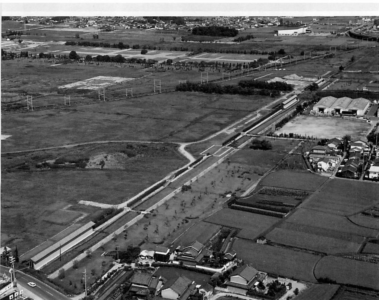
10. 上 日高山1号墳の埴輪