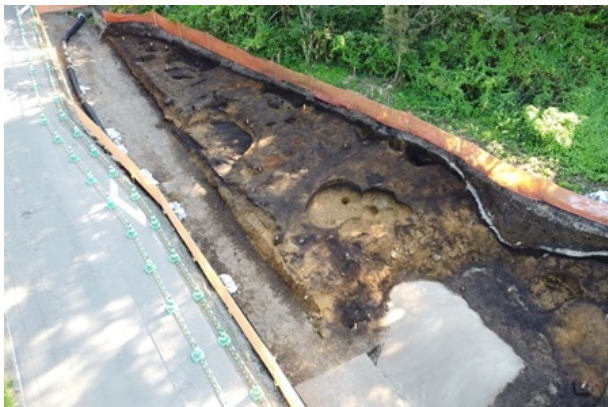
2区Ⅲ層完掘状況（北東から）