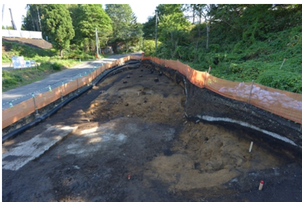
2区Ⅴ層完掘状況（北から）