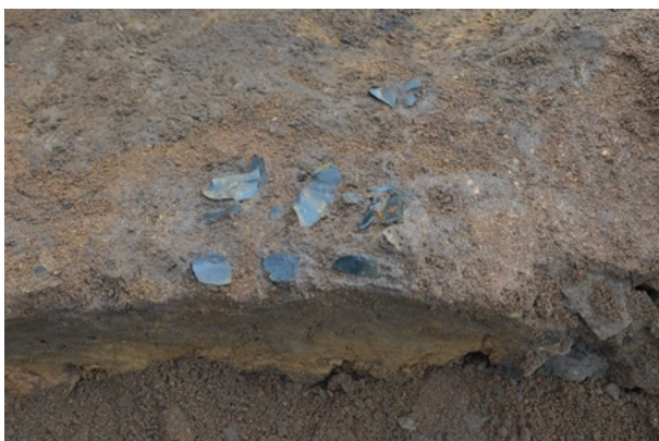
5区Ⅳb層剥片集中検出状況