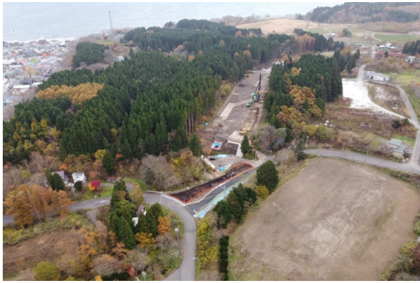
調査区遠景（北西から）