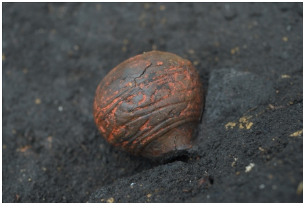
1区Ⅲ層遺物出土状況③