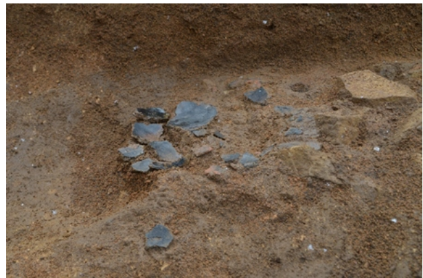
5区Ⅳb層土器出土状況