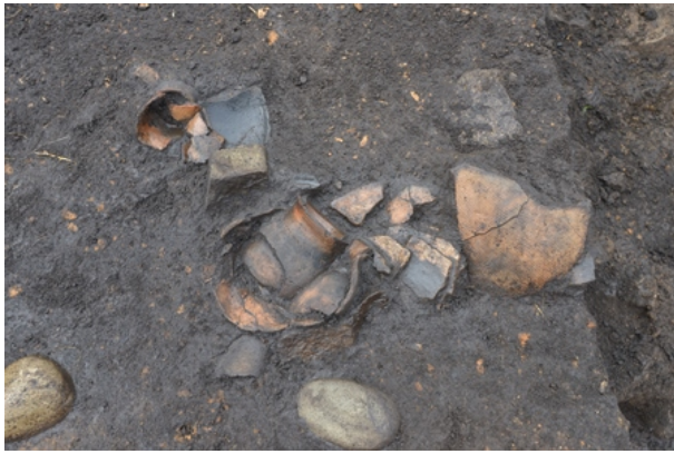
1区Ⅲ層遺物出土状況①