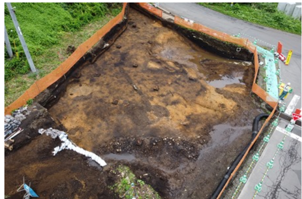
1区Ⅴ層完掘状況（南東から）