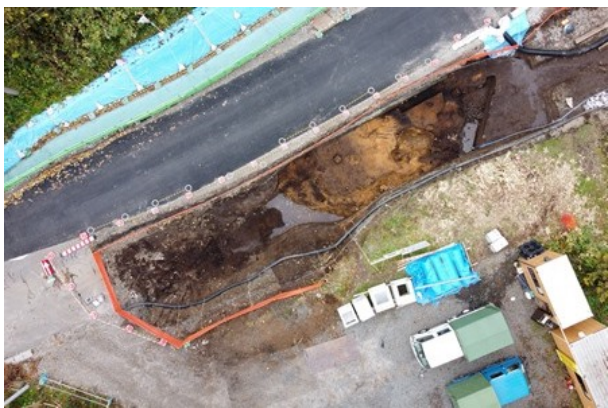
4区Ⅲ層完掘状況（東から）