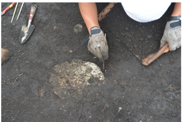
1区Ⅲ層鯨椎間板検出状況