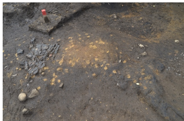
F S - 5 検出状況（1区Ⅴ層）