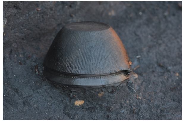
1区Ⅲ層遺物出土状況②