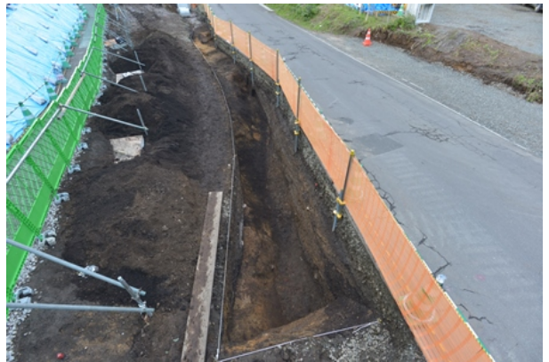
3区Ⅲ層完掘状況（南から）