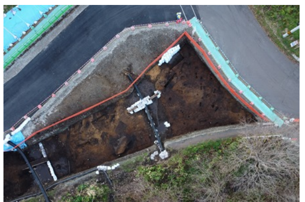
5区Ⅲ層完掘状況（東から）