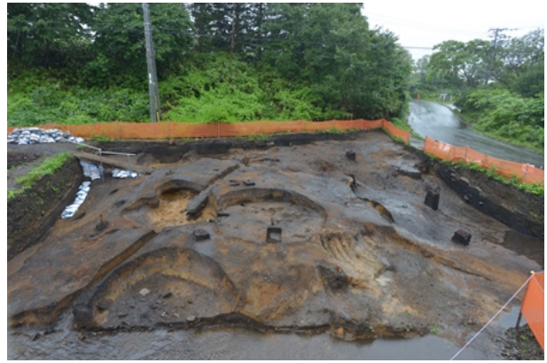
1区Ⅲ層完掘状況（東から）