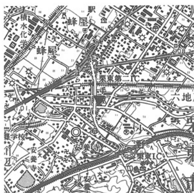
(京都東北部・近江八幡)

手原遺跡は、JR草津線手原駅周辺を中心として東西約七〇〇mに広がる遺跡である。これまでの調査により、およそ手原駅の西