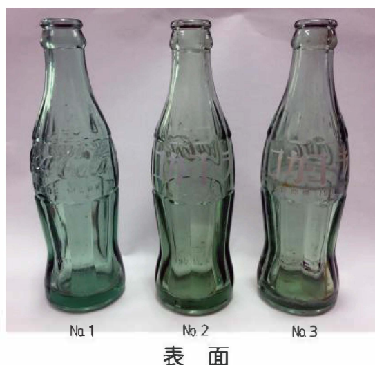
写真2 採集されたコーラ瓶（1）

No.1（写真2～4）は色調が淡緑色半透明のいわゆる「グリーンボトル」である。正面と裏面には陽刻による「コカ・コーラ」のロゴマークと「TRADEMARK」の文字が認められる。正面下部には、「45（記号）51」の陽刻も認められる。桜井分類のコカ・コーラⅢa式2類に相当する。No.1は日本初の国産コカ・コーラで太平洋戦争終結後、占領軍米兵やその関係者のみ販売・消費されたものである（桜井2019）。