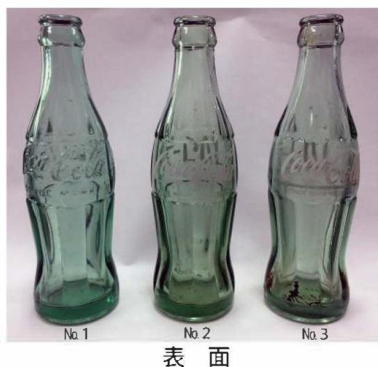
写真3 採集されたコーラ瓶（2）