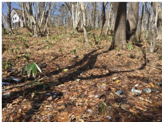
写真1 霊山山頂の現況

近現代のガラス瓶を考古資料として取り扱うことに対し、批判的な風潮があるかもしれない。しかし、考古学という学問が時間経過により亡失した人類の文化や行動の痕跡を研究対象としている以上、研究領域の拡大や分野の多様化の是非について議論する余地はなく、ましてや近現代考古学研究の有効性については桜井準也がすでに指摘しているとおりである(桜井2004)2)。