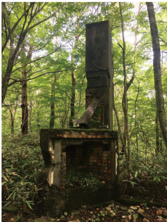
写真5 紫明峰山頂に位置する無線中継所の暖炉跡

No. 2・3は1960年から1970年代にかけて、登山に訪れた観光客によって投棄されたものと考えられる。戦後の混乱期を経て、高度経済成長期のさなか、余暇に家族で登山を楽しむゆとりも生まれていたのであろうか。汗をかきながら登った山上で飲み干したコーラの味が格別だったことは想像に難く無い。余談だが、地域の歴史に対する関心も高まっていた時期で、霊山山頂周辺では、1977年に梅宮茂氏を中心とし、霊山の平場群や礎石建物の測量調査が行われている。