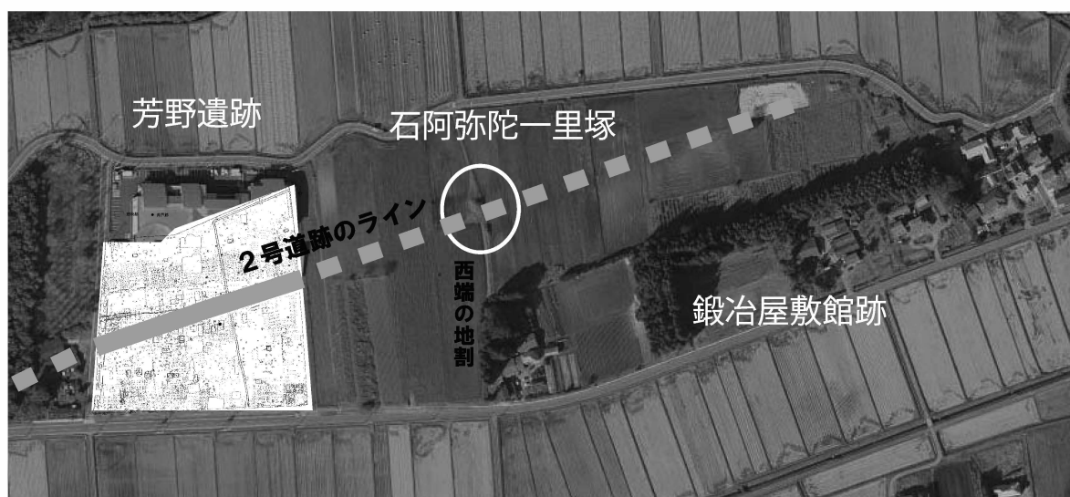
図2 芳野遺跡と鍛冶屋敷館跡

道跡には3期の変遷があり、それぞれの年代は、第1・2期（1号道跡・3号道跡）が鎌倉時代から室町時代、第3期（2号道跡）が江戸時代初頭を下限とすると想定された。このうち第1・2期の道跡は調査区中央部を横断し、路線がほぼ同一のルートを持している。これに対し、第3期の2号道跡は軸線を北東に変え、そのまま東に延長すると、遺跡に隣接する石阿弥陀一里塚を通過することになることから、2号道跡と一里塚が、同時期に機能していたと考えられる。石阿弥陀一里塚は慶長9（1604）年の設置、2号道跡の廃絶は寛政6～9（1629～1632）年の廃絶と考察されている（註9）。