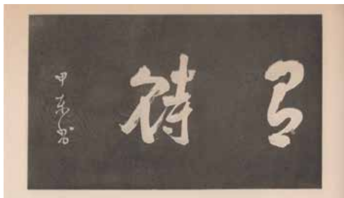
大久保書「有待」の額、『京都維新史蹟』京都市教育会、1928年

大正3年に開かれた、そのような会合の席上、朝日新聞の記者で漢文の大家、西村天囚（時彦）は、茶室に「有待庵」という名をつけることを提案し、利武を喜ばせた。利通は普段から、「来たらざるを待まず、待つ有るを待む」（敵は来ないだろうと多寡を括るのではなく、いつ来てもよいように待機の姿勢を取る。出典は『孫子』など）の語句を好み、揮毫を依頼された時も、よく「有待」の2字を書いたという。この