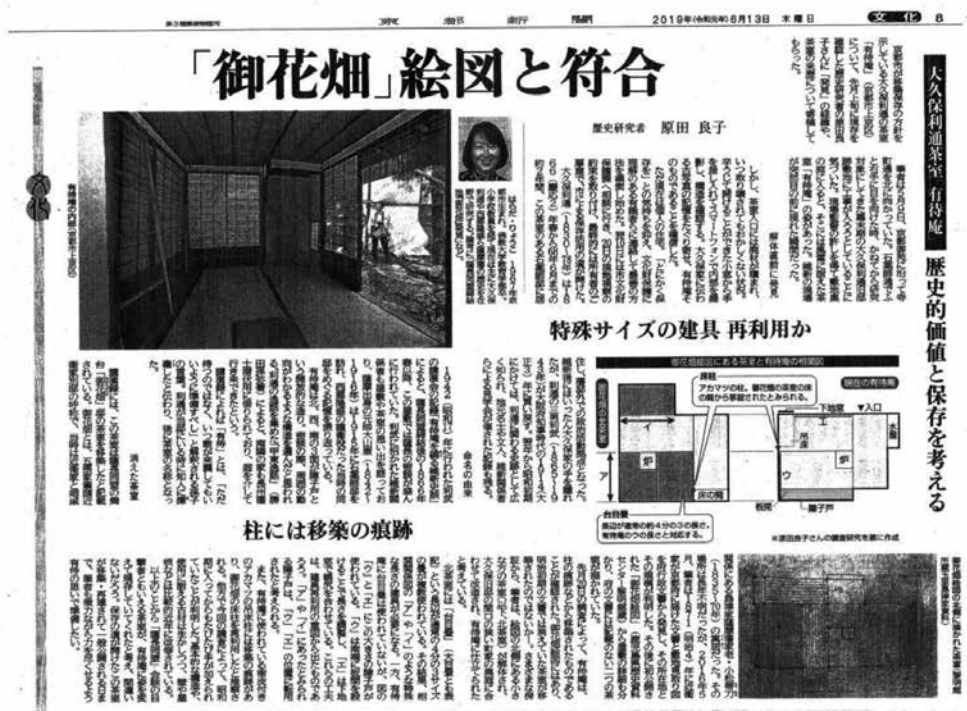
茶室の間取り図（京都新聞、2019年6月13日付）

その建物と敷地を、利通の3男、大久保利武が大阪府知事（在任1912～17）を勤めていた当時、大正3年（1914）3月に寺島家から譲り受けた。購入資金の調達に際して利武は、従兄弟（利通の甥）山田直矢から、金融面で支援を受けたことが明らかにされている（原田論文2023年）。利武の