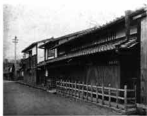
写真② 旧邸外観写真

※模式図は京間1間を基準に作成した。それ以外は見取り図をもとに配置を按配している。