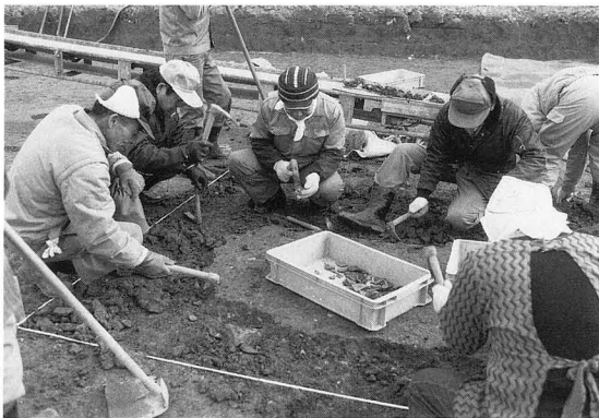
fig.2 調査風景 (SK5769の発掘)

調査前の当該地には、大型の鉄骨スレート葺き倉庫が建っていた。その基礎が、調査区中央に5m間隔で15基並ぶ。さらに、倉庫以前に存在した工場の機械設置のために掘削された巨大な土壌で、調査区の西南部約500㎡が攪乱され遺構が残らない。さらに、倉庫の基礎の東側を、コンクリート管による暗渠が南北に貫流する。これ以外にも、至る所に現代の攪乱墳が存在し、調査は、まずこれらの攪乱墳の始末から始めなければならなかった。幸いなことに、攪乱以外の面では奈良時代の遺構面が残っており、掘立柱建物13棟、井戸5基、大形の土壌2基、道路2条などの遺構を検出した。