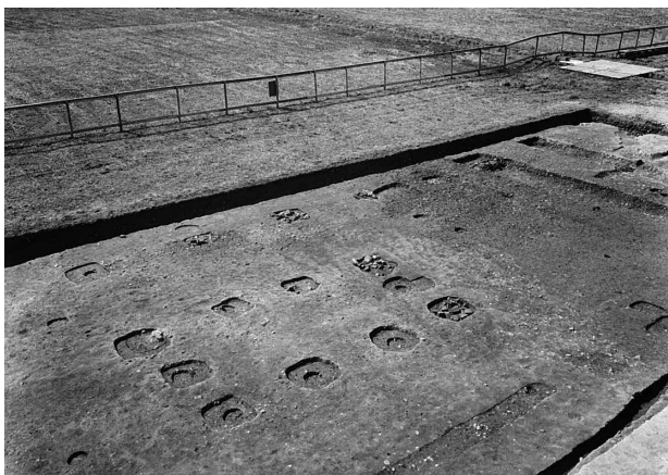
図160 調査区南側掘立柱建物群（北東から）

下ツ道は、平城宮内においては南側の朱雀門及びその周辺の調査（第16・17次）、中央区朝堂院南門の調査（第119次）において存在が確認されていたが、本調査区においても両側溝を確認することができた。（金田明大）