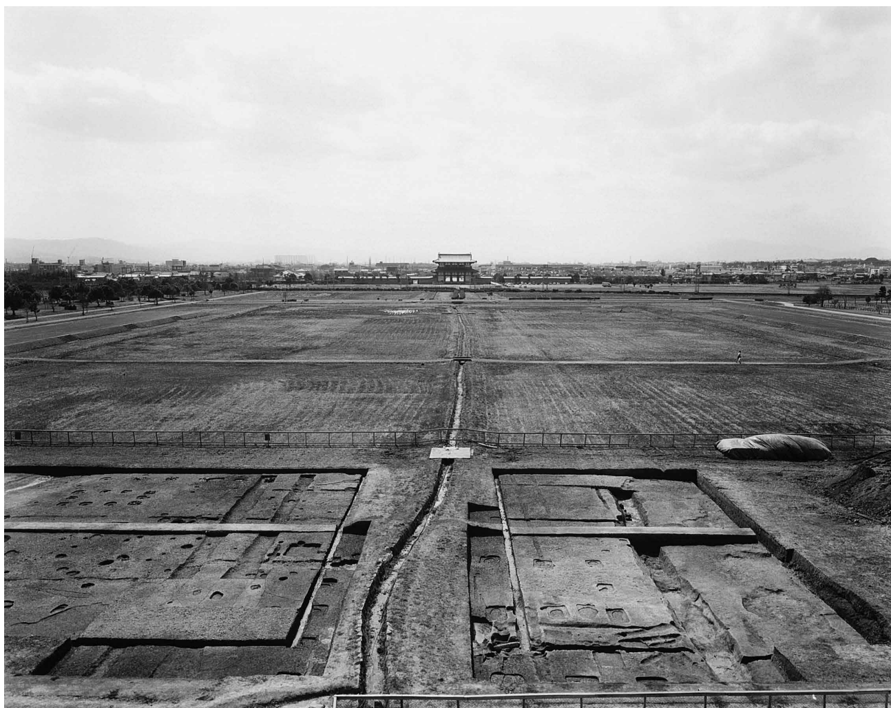
図161 調査区西半部の状況（北から）