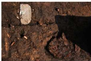
SK87 木棺墓 隅入方鏡と漆器状製品