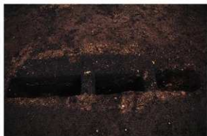
1号周溝墓 粘土榑断面