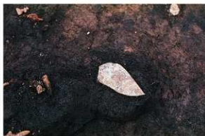
SK126 木棺墓 隅入方鏡と和釘2