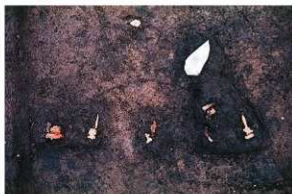
SK126 木棺墓 隅入方鏡と和釘1