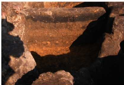
SH27 北東側屋内土坑埋土