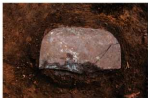
SK87 木棺墓 隅入方鏡