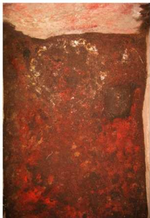
1号周溝墓 石棺内部西半部 白色の枕