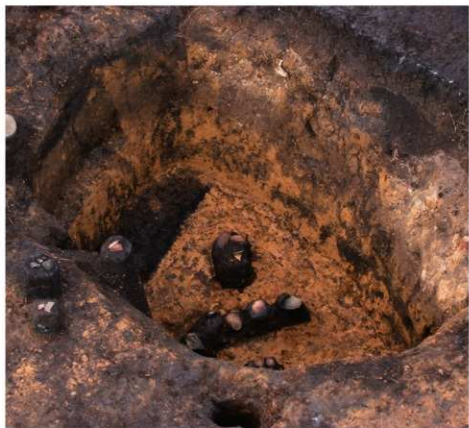
SH27 北東側屋内土坑遺物出土状況