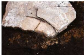
1号周溝墓 石棺東端根綿白色粘土