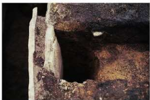
1号周溝墓 中央南側東断面