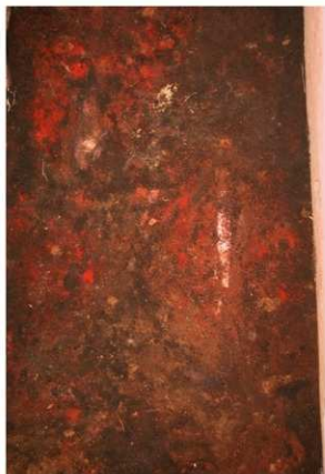
1号周溝墓 石棺内部東半部 左脛骨残存