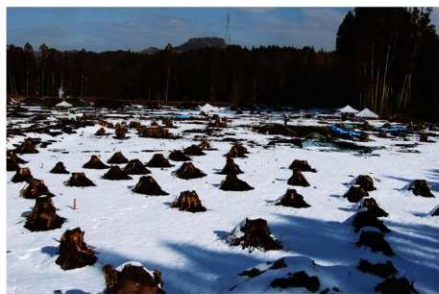
雪の中の調査風景