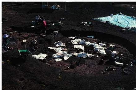
調査風景 霜柱対策の新聞