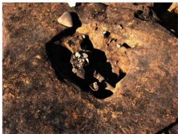
SH27 炉跡内上位遺物出土状況