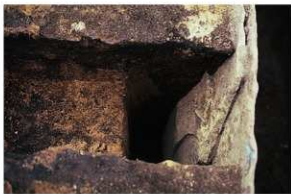
1号周溝墓 中央北側東断面