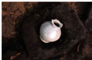
SK87 木棺墓 越州窯青磁唾壺・和釘2