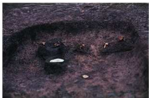
SK126 木棺墓 隅入方鏡と和釘3