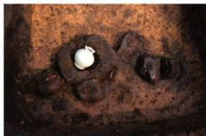
SK87 木棺墓 越州窯青磁唾壺・和釘1