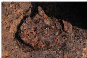
SK87 木棺墓 漆器状製品