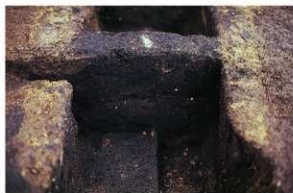
1号周溝墓 粘土榑断面