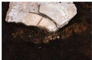
1号周溝墓 石棺西端根綿白色粘土