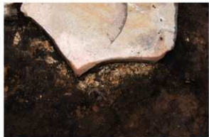
1号周溝墓 石棺南東根綿白色粘土