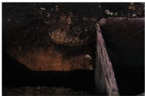
1号周溝墓 石棺東端南断面