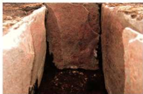
1号周溝墓 石棺西端