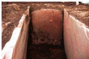
1号周溝墓 石棺東端