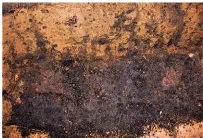
SH27 北東側屋内土坑の炭化米