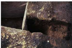
1号周溝墓 石棺西端南断面