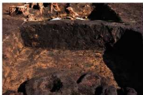
SK87 木棺墓 断面