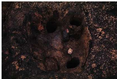
SH27 炉跡内上位遺物出土状況

炉跡内の四隅には、浅い柱穴が設置されていた。設置された場所から、竪穴建物跡の上屋構造に関わる柱穴ではなく、炉跡利用に関わるものと推定している。