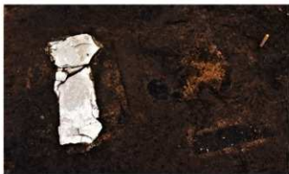
1号周溝墓 石棺・粘土擗