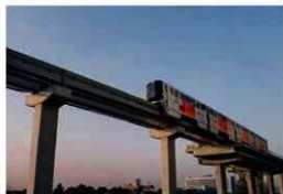
平成12年頃