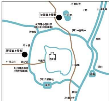
▲尾張藩上屋敷・加賀藩上屋敷の位置（江戸時代）

「鶴」の骨が蔵から出てきた意味 近世において鶴は、一般の人々が獲ることは禁じられていました。そうすると、本資料が近世のものであった場合、獲ることの許されていた尾張藩（藩主）ゆかりのものと推測されます。想像の域は出ませんが、何かしらの理由で、尾張藩から鶴が中野家に下賜され、食した後、記念にその骨を大切に蔵に保存していたのかもかもしれません。さらには、鶴は長寿や夫婦円満の象徴であったことから縁起物として保存したのかもかもしれません。