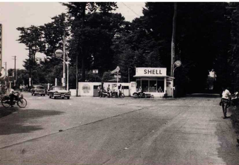
五日市街道、西砂町 新道 (左)と旧道 (右)の分岐点 (昭和36年 (1961) 立川市歴史民俗資料館蔵)

令和6年4月から資料編「砂川の民俗」と『写真集』の頒布がはじまります。市民の皆さまのご協力のもと、たくさんの貴重なお話や写真資料を集めることができました。巻末の刊行物紹介では、各資料編の概要と見どころを紹介しています。成果のひとつひとつが、地域の歴史を知る手助けになれば幸いです。