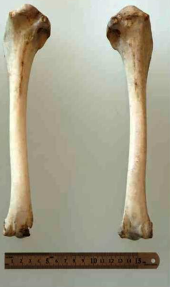
▲図1：中野家より発見されたツル科上腕骨

答えは「鶴」でした。そんな鳥の骨がどうしてその蔵に大事に納められていたのかを知るためには、さらに、「何の鳥なのか」を調べていく必要があります。その際に、特に先ほど指摘した端部の形状に着目します。同じ鳥でも種類によって少しずつ異なります。具体的に、今度はいろいろな鳥の骨格標本（現生標本）と比較していきます。