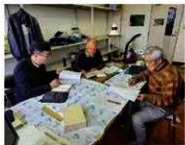
通史編に向けた打ち合わせ

現在、「本編 通史」に向けた調査の準備を中心に、観覧作業を進めています。「資料編 先史」では、立川市域で出土した主要な考古資料の紹介が中心でしたが、「本編 通史」では、市域の考古資料だけでなく、周辺地域の考古資料も取り上げながら、立川市を含む多摩地域の先史時代史を叙述する予定です。当面は、主に立川市近隣地域を対象に関連調査を行う予定です。また、「本編 通史」の構成や体裁についても、他の自治体史を参考にしながら、読みやすい紙面構成の検討を進めています。