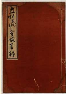
▲『立河流聖教目録』（文中4年（1375））