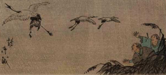
楊洲周延（時代かまみ 文政之頃 鶴御成）部分（城西大学水田美術館蔵）

市史編さん室では、市内に古くからある個人宅（旧家）などを訪問し、現在まで残されてきたさまざまな資料について調査しています。「資料」というと、古文書のような紙に文字が書かれたものを思い浮かべがちですが、なかには紙ではないもの、文字が書かれていないものも多く含まれます。