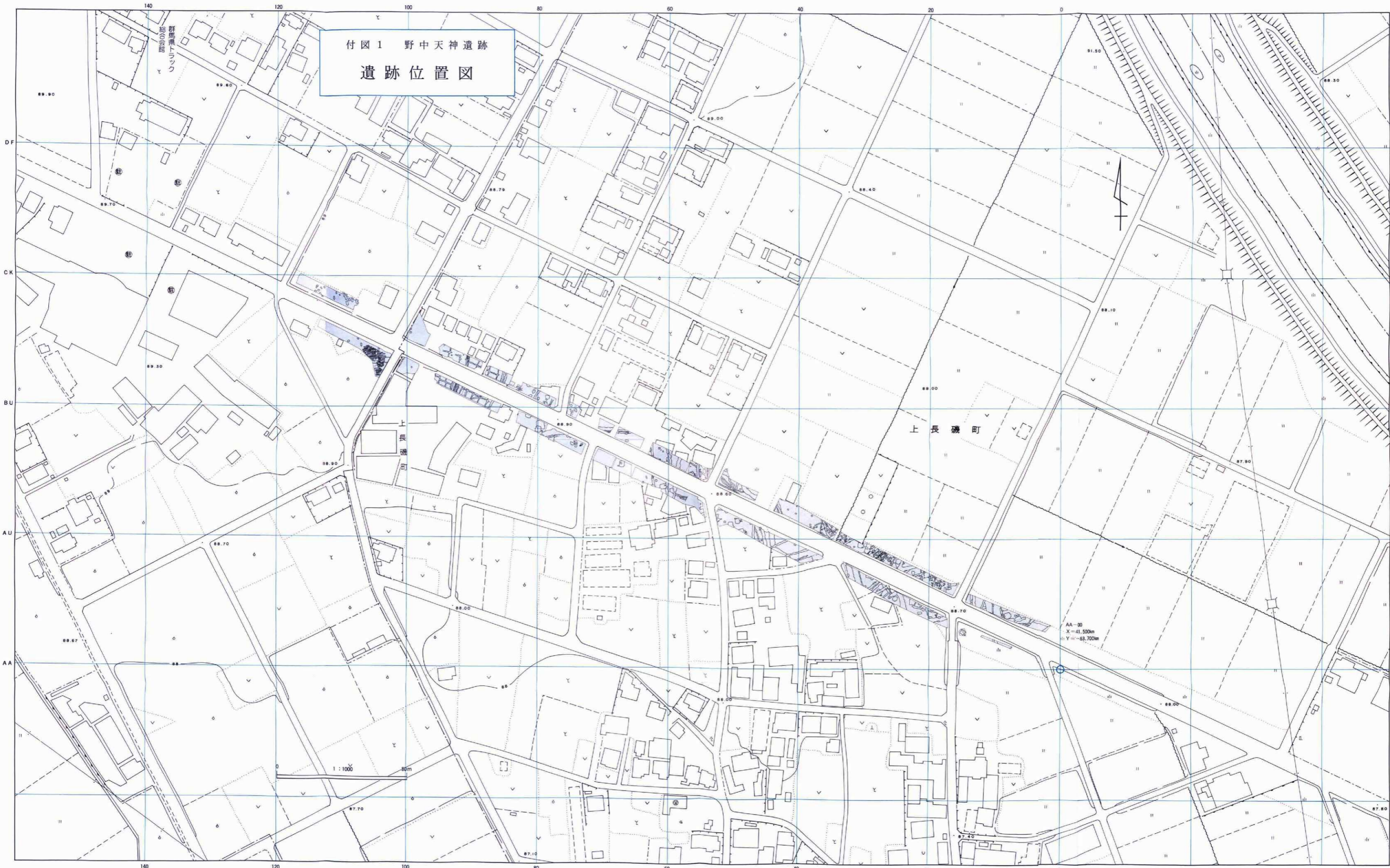
付図1 野中天神遺跡 遺跡位置図