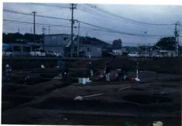
上層遺構面の調査状況（西から）