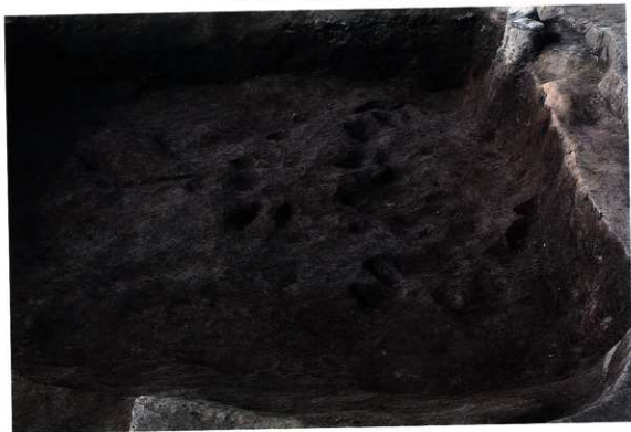
SK137 床面の状況 (東から)