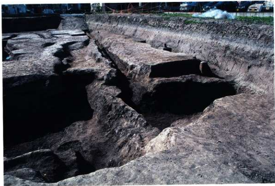
SD112・170・233(T59・U60・V60区) (東から)