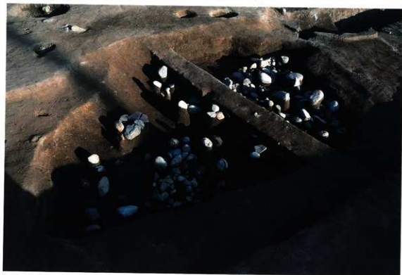
SK127 遺物出土状況 (東から)