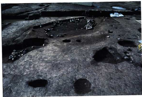
SK127 遺物出土状況 (東から)