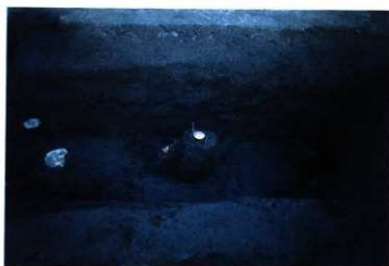
SD103B 遺物出土状況 (西から)