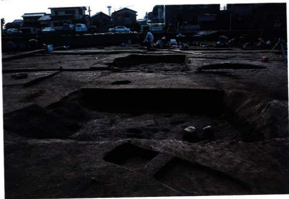
SK109-137 掘直状況 (北から)