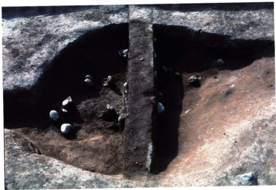
SK127 下部遺物出土状況 (北から)