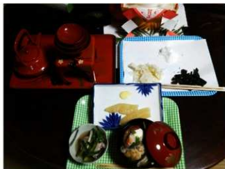
左 (吸物2) 右 (吸物1)