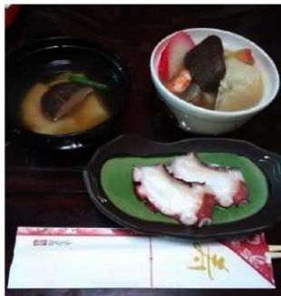
左奥（吸物 1） 手前（刺身） 右奥（吸物 2）