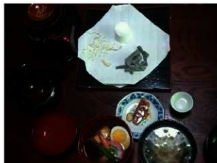
左（吸物1） 奥（シュームリ） 右（吸物2）