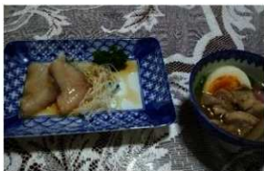
左 (刺身) 右 (吸物2)