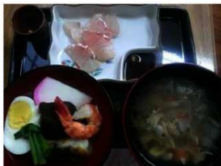
左（吸物1） 奥（刺身） 右（吸物2）