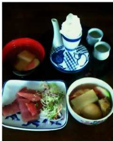
左奥（吸物1） 左（刺身） 右（吸物2）