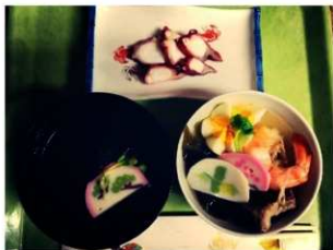
奥（刺身） 左（吸物1） 右（吸物2）