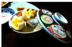
実家（古志集落）で使用する 蓋付陶磁器碗（シンカン）