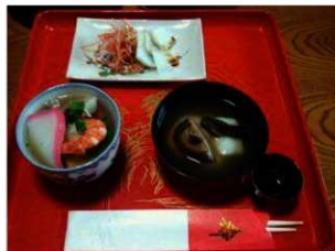
左（吸物2） 奥（刺身） 右（吸物1）