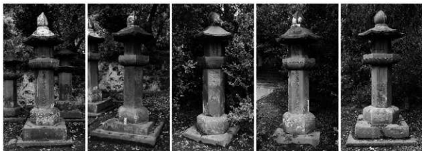
12代貴柄石幢 (D021) 11代貴品後室石幢 (D022) 11代貴品夫人石幢 (H004) 11代貴品石幢 (H005) 10代貴澄夫人石幢 (H007)