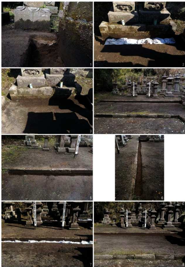
(1)4トレンチコンクリート土台検出状況【東→】 (2)埋め戻し状況 (3)調査終了状況 (4)5トレンチ調査前状況【南→】 (5)石造物検出状況【南→】 (6)完備状況【西→】 (7)埋め戻し状況 (8)調査終了状況