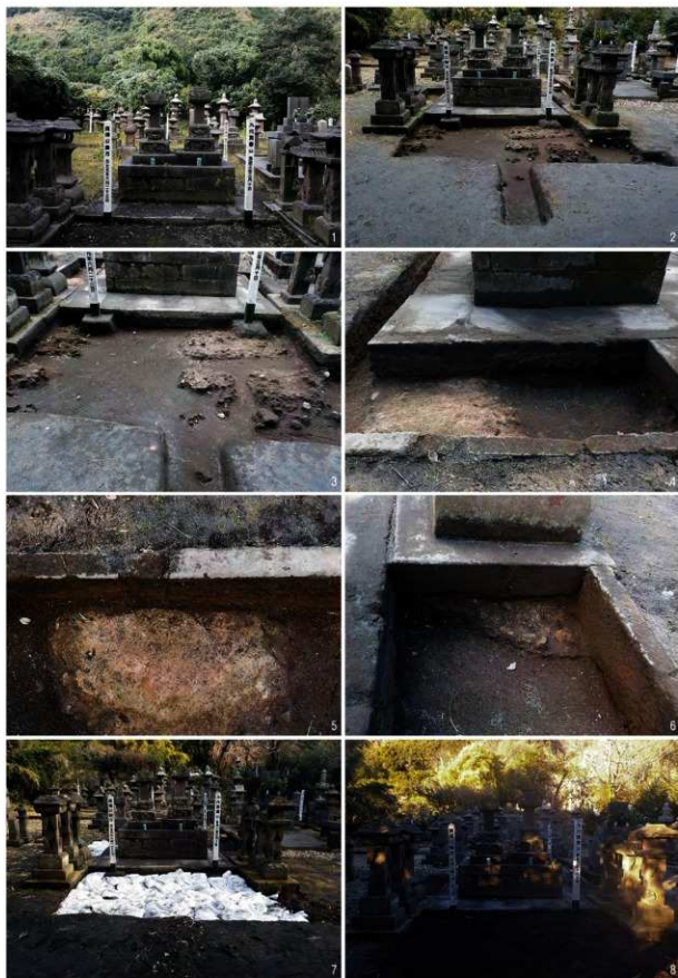
(1)トレンチ調査前状況【南→】 (2)完掘状況【南→】 (3)地業検出状況①【当主墓南】 (4)地業検出状況②【当主墓北西、西→】 (5)地業検出状況③【当主墓北、真上より】 (6)地業検出状況④【北→】 (7)埋め戻し状況 (8)調査終了状況