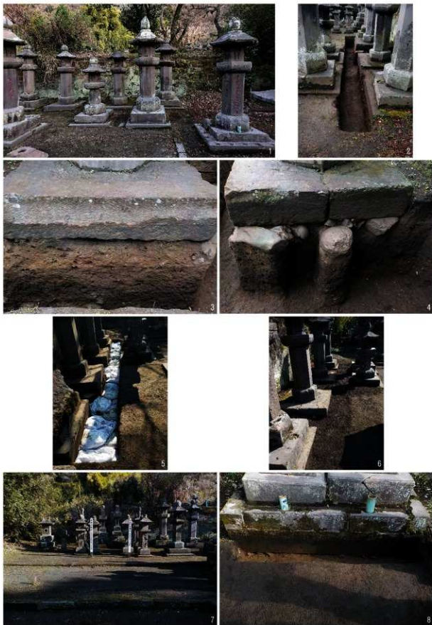
(1)3トレンチ調査前状況【南→】 (2)完掘状況【東→】 (3)造成面検出状況【西→】 (4)石礎基礎下位に設置された配石検出状況【東→】 (5)埋め戻し状況 (6)調査終了状況 (7)4トレンチ調査前状況【南→】 (8)4完掘状況【南→】