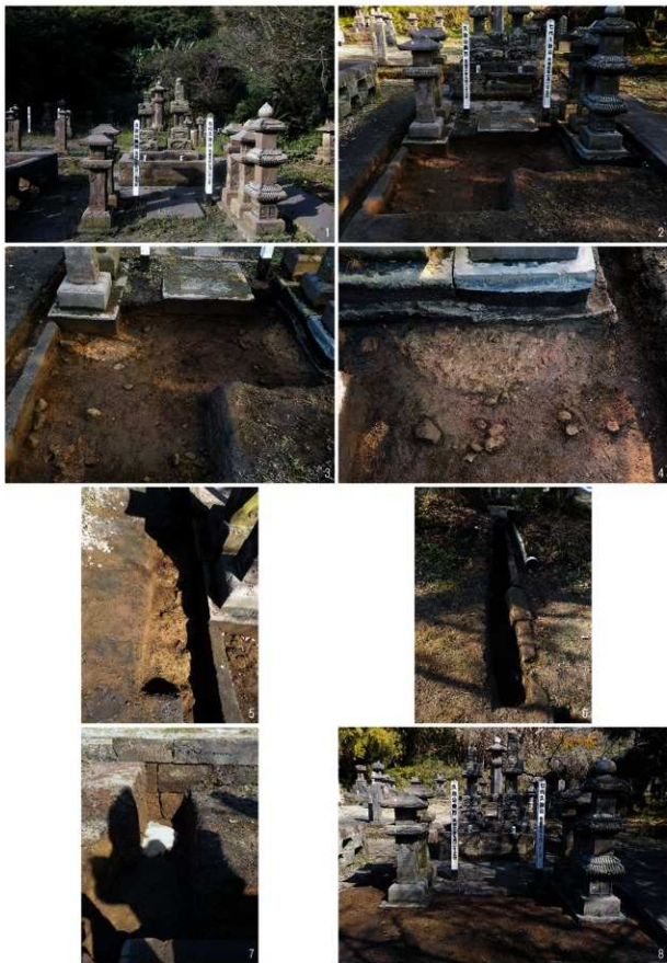
(1)2トレンチ調査前状況【南→】 (2)完掘状況【南→】 (3)地葉検出状況①【当主墓南】 (4)地葉及びコンクリート検出状況【当主墓南、西→】 (5)地葉検出状況【当主墓西】 (6)2トレンチ南石造物設置状況【北→】 (7)2トレンチ北石造物設置状況【南→】 (8)調査終了状況