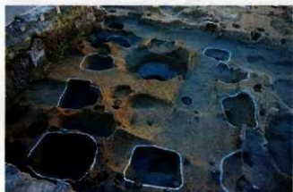
古代の掘立柱建物跡