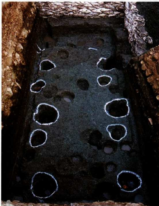
掘立柱建物跡（北側調査区第7面）

調査の結果、中世の生活の跡が11面存在し、上の方の生活面からはかわらけを焼いた跡や、国産や中国産の焼き物のほか板締染と呼ばれる染色用の型板などの出土品があり、最下面では建物跡数棟のほか、瓦を大量に捨てたとみられる瓦溜りなどが発見されました。