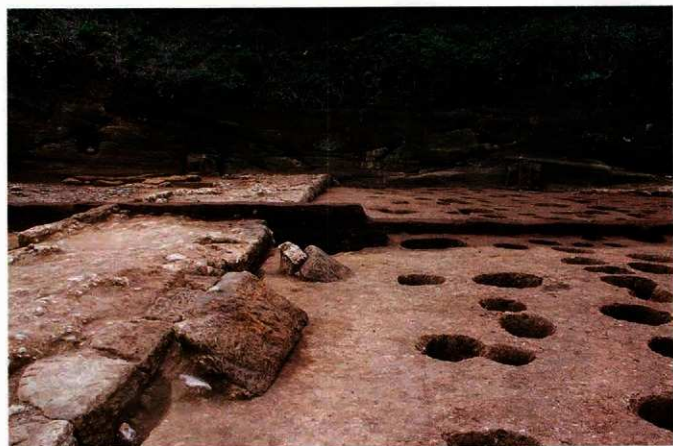
石列と柱穴群 (調査区中央付近)