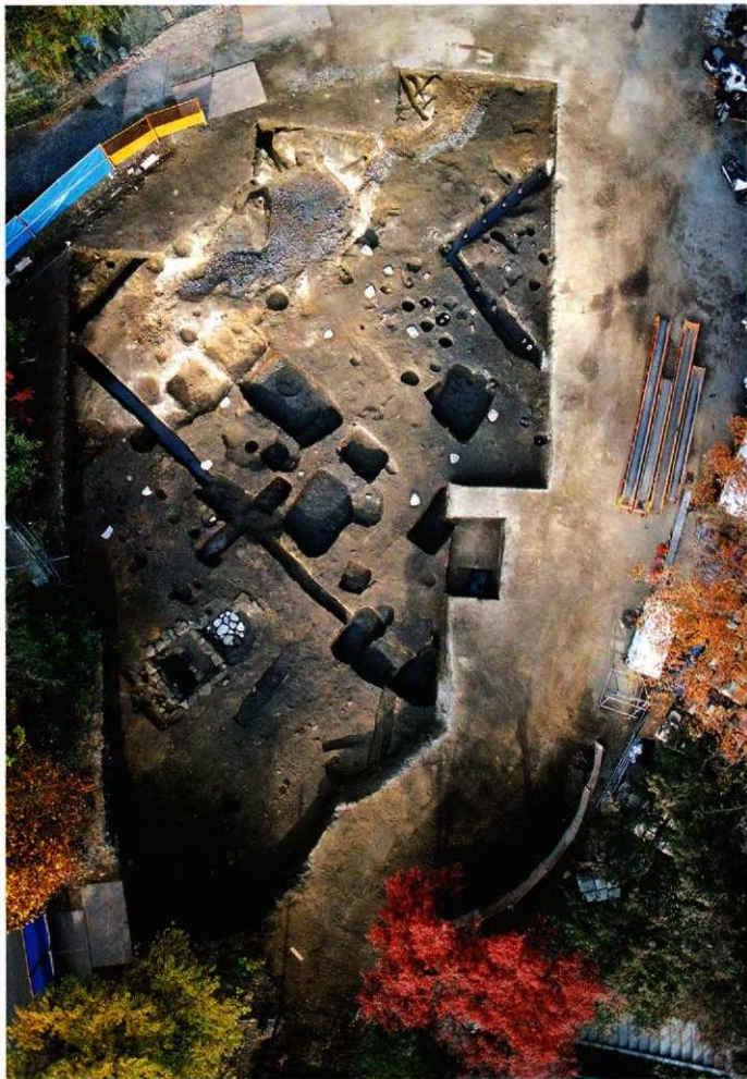
無量寺跡発掘調査区全景(北側)