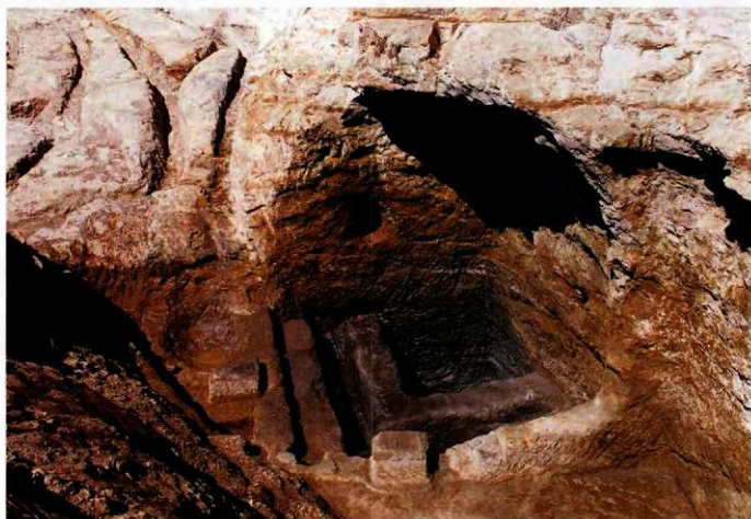
やぐら(南側調査区)