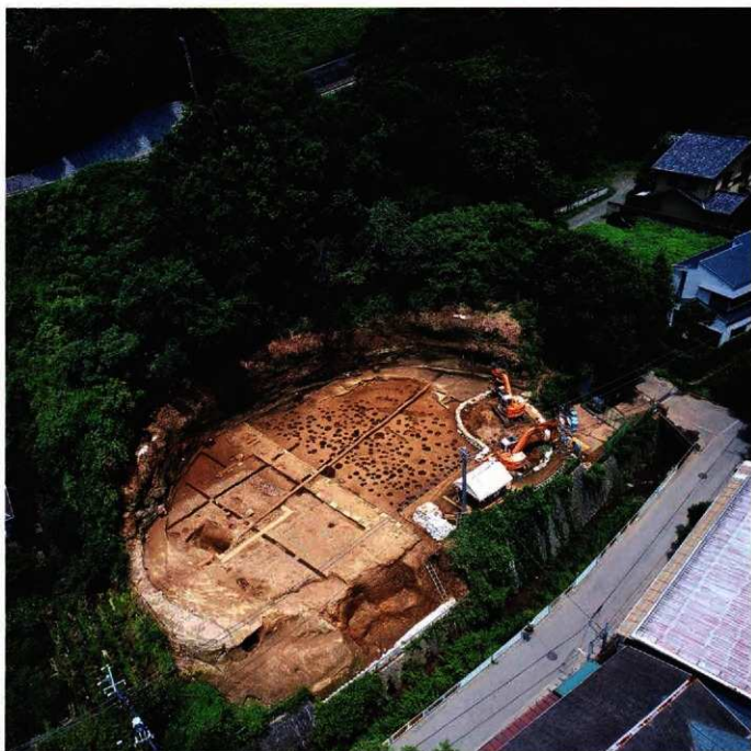
朝比奈菩提跡発掘調査区画遠望