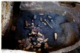
草履を大量に捨てた穴