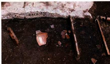
木組みの溝跡 （南側調査区第4面）