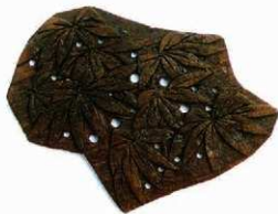
板締染用の型板 (大倉幕府跡出土)

The excavation area of this time situated between Yokohama National University Primary School and Seisen primary school. The result is there are eleven medieval residential areas; we found the site of baking unglazed earthenware in the upper residential area and findings of Japanese and Chinese pottery or Itajimezome which is a pattern board for dyeing. Also we found several building sites and Kawaradamari, a mount of wasted roofing tiles.