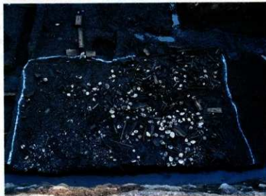
食器や貝などが大量に捨てられた堅穴建築址 （北側調査区第5面）