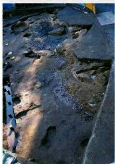
池と通り水跡(北側調査区)