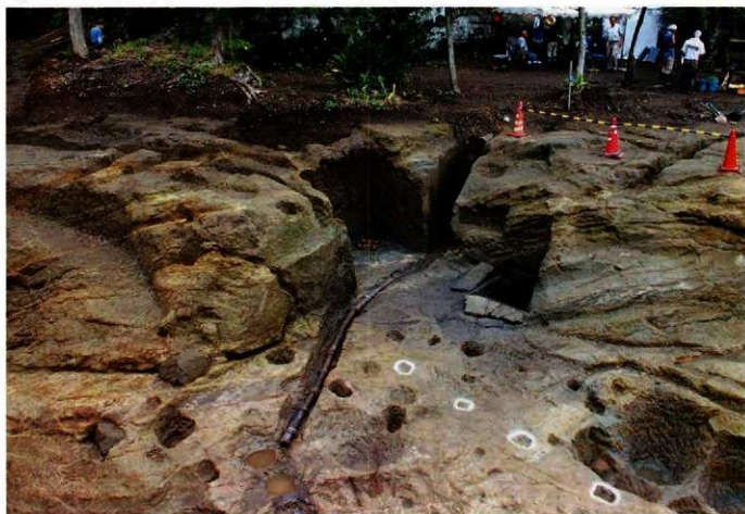
やぐらと掘立柱建物跡(南側調査区)