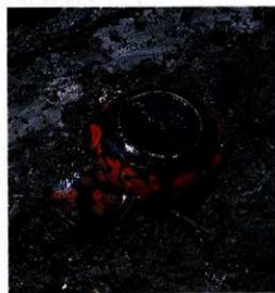
漆器出土状態（南側調査区第4面）