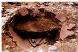
常滑甕出土状態 (納骨堂中央)