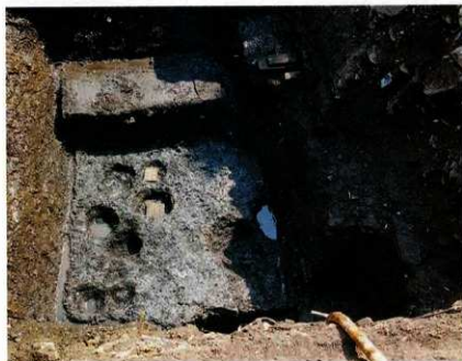
南側調査区の遺構（第8面）