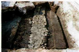
東西方向に伸びる道路