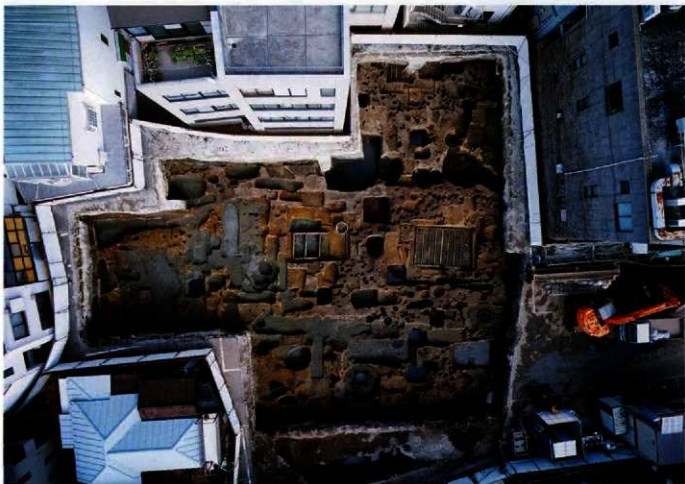
若宮大路周辺遺跡群発掘調査区全景

出土品からすると古代の遺構群は古墳時代から奈良・平安時代、中世のものは13世紀前半から14世紀後半にかけてくり返すつくれたと推定されます。ここから80m 程離れた今小路西遺跡（現、御成小学校）では奈良時代の役所の跡と、中世の武家屋敷を中心としたまちの跡が見つかったので、この場所も古代から中世にかけて栄えたことが想像できます。