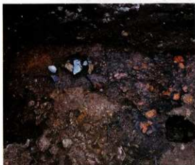
かわらけ焼成遺構（北側調査区第1面）

最も古い12世紀後半と推定される生活面は現在の地表から約3m下のところにあり、幕府の位置や範囲は定かではありませんが、今よりも3mくらい深い所に建っていたと思われます。また、多くの生活面があることから、幕府が若宮大路沿いに移った後も、当地では れんめん 連綿として土地利用が続けられていたことがうかがえます。