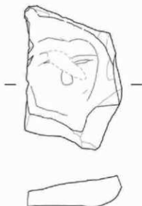
図 3 実測図 (fig3) Survey drawing 縦 5.2cm、横 3.4cm、厚 1cm