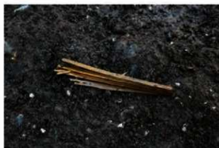
写真 20 扇骨出土状況 「若宮大路周辺遺跡群」 小町二丁目 33 番 4 地点 (Photo20) Bones of a fan

We also discovered stones which were often used for flints. They are different sizes and some are fragmentary. It suggests that there was flint workshop. These valuable achievements provide with essential information about the structure and uses of buildings of the 13-14th century.