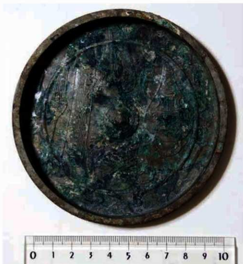
写真 2 出土した銅鏡 (Photo2) Bronze mirror