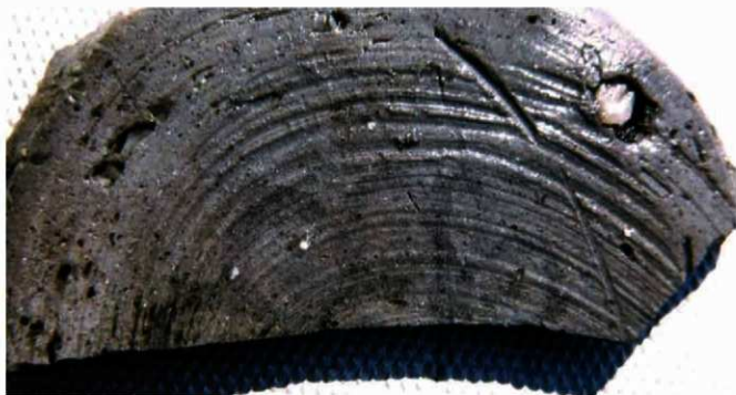
写真 13 墨書土器（須恵器「菊の花のような文様が描かれている」） (Photo13) Earthenware "Sueki" (Chrysanthemum patterns were drawn on it.)