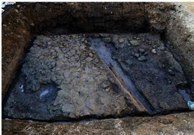
写真7 道路跡 (Photo7) Street