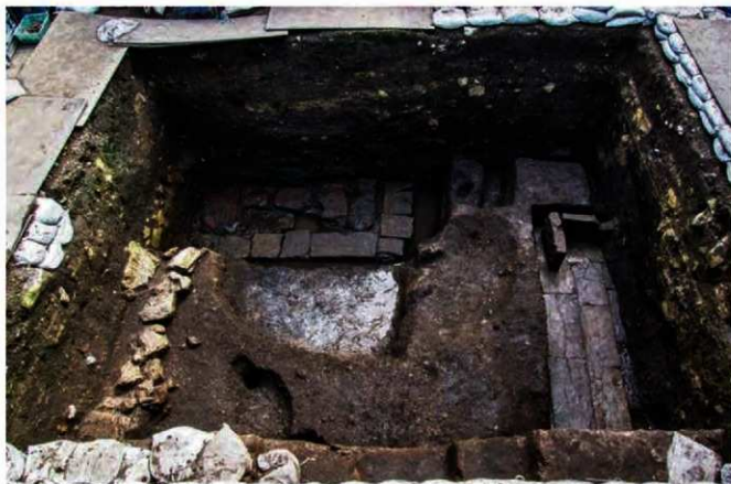
写真 17 建物の検出状況 (Photo17) Building