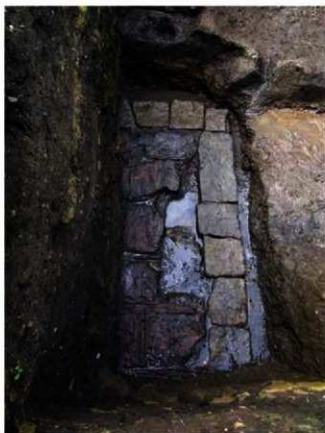
写真 16 床に敷いた切石と板材の検出状況 (Photo16) Stone floor and ladders

ここで火打ち石を製作していたとも考えられ、13～14世紀の建築物の構造や使用用途を考える上で貴重な成果が得られました。