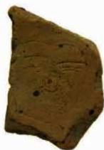
写真 15 人面が描かれたかわらけ (Photo15) Human face drawn on a Kawareke

発見された道路は南北方向に造られ現在の周辺の宅地の方向と異なっており、近隣の発掘調査による発見事例も現在と異なる方向の溝や道が発見されていることから、一帯は現在の区画の方向とは異なる町並みが広がっていたと推測されます。出土遺物では人面を線刻で表現したかわらけの破片が見つかりました。中世の出土遺物としては全国的にもほとんど例のない珍しいものです。