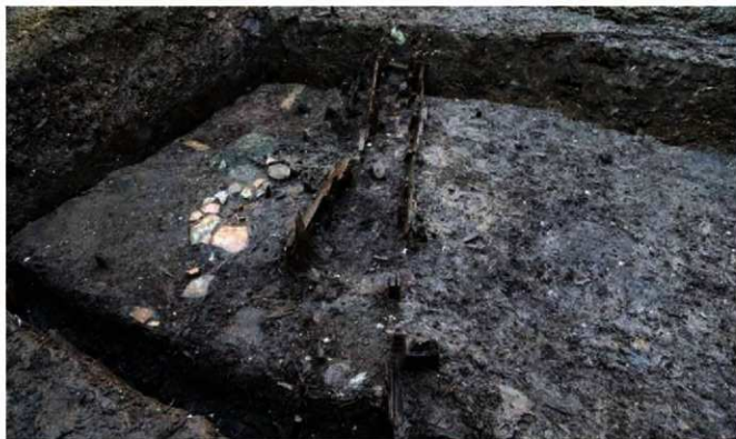
写真6 護岸された溝跡 (Photo6) Reinforced ditch