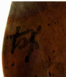
写真10 墨書土器(土師器「坏」)(右上)

(Photo9) Earthenware "Sueki" (upper left)