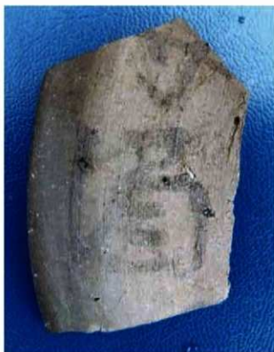
写真9 墨書土器(須恵器「□(寺か)酒」)(左上)

(Photo9) Earthenware "Sueki" (upper left)