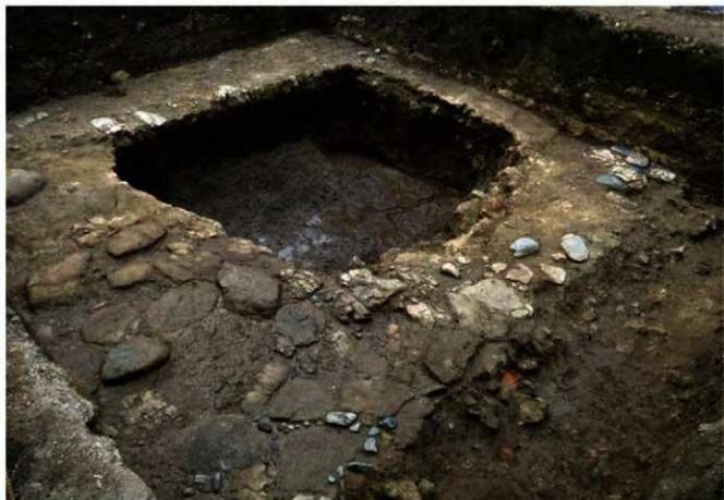
写真5 発見された道路跡（方形の深い部分は近現代に掘られた穴） (Photo5) Street