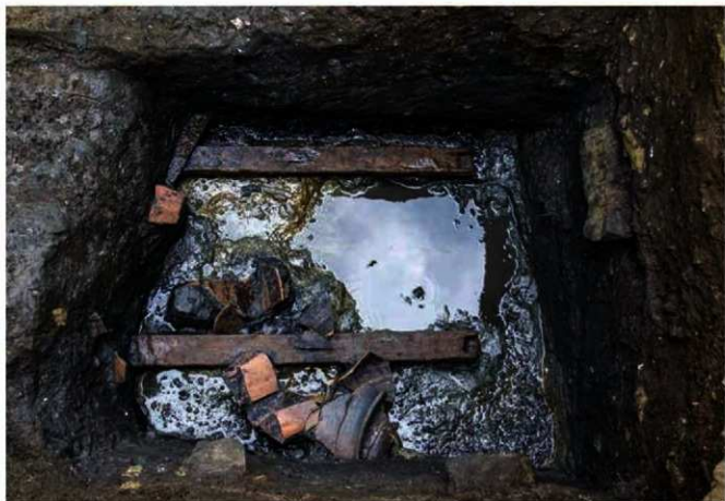
写真 19 建物の基礎と一緒に発見された陶器 (Photo19) Foundation of the building and earthenwares