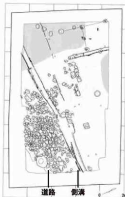
図1 遺構配置図 14世紀 (fig1) Remains layout 14th century

道路は一部が調査範囲の外にのびていたため、正確な幅はわかりませんが、北側には側溝と思われる溝が並行して造られていました。過去に近隣で行われた発掘調査でも、この道路と平行、もしくは直交する区画溝や道路が確認されています。今後、この一帯における当時の町割りの復元に向け、参考となる成果となりました。