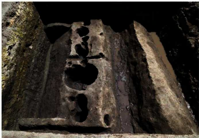
写真4 溝と柱穴列の検出状況（写真左が北） (Photo4) Ditch and lines of pole pits