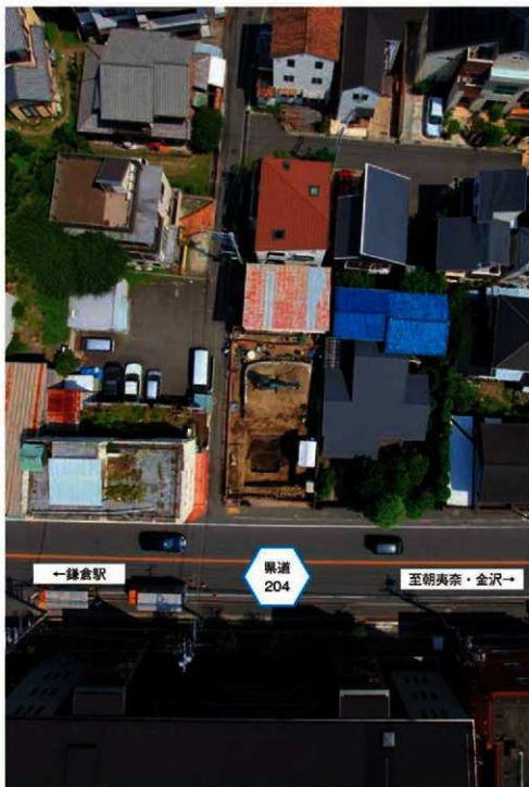
写真1 調査地上空から撮影 写真中央が調査地点(上が北) (Photo1) Aerial photograph of the excavated point