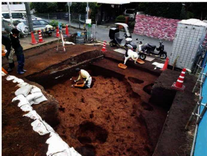
写真 14 調査風景 (Photo14) Excavation scene