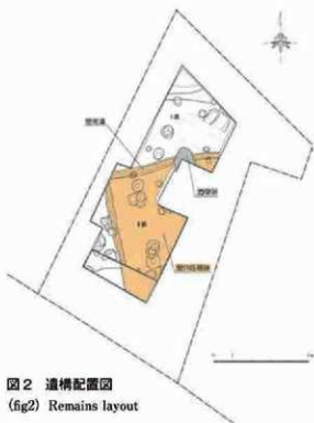
図2 遺構配置図 (fig2) Remains layout

調査範囲が狭く、住居跡の全容はわかりませんでした。丘陵上に広がる集落の様子を新たに確認することができました。