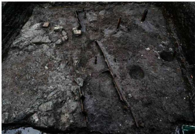
写真8 道路跡(左) 溝跡(中央) (写真7の道路跡より古い時期の道路跡) (Photo8) Street (left), Ditch (center)