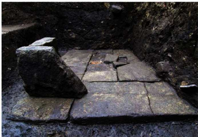
写真 18 床に敷いた切石と角に組まれた切石 (Photo18) Stone floor and assembled stones