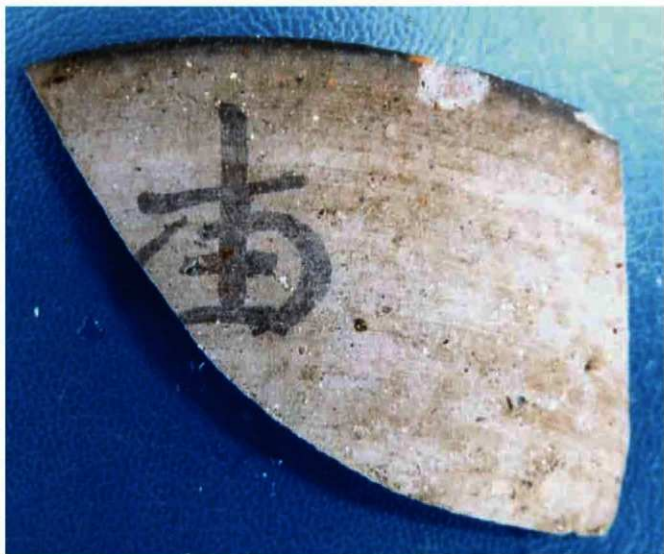
写真 12 墨書土器（須恵器「由」） (Photo12) Earthenware "Sueki"