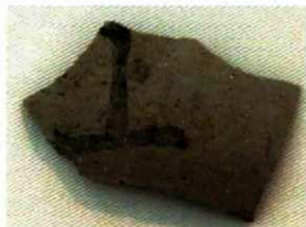
写真11 墨書土器(須恵器「上」)(右下)

(Photo10) Earthenware "Hajiki" (upper right)