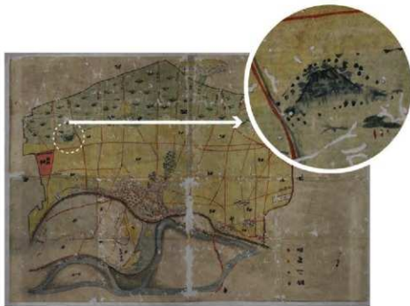
写真5 享和4年（1804）柴崎村絵図（歴史民俗資料館蔵）

以上のように民俗の調査は、フィールドワークによる段階的かつ多方面への調査を行い、特定の民俗（ここでは富士塚や浅間神社）の全体像へアプローチしながら、ライブラリーワークによって、その歴史や移り変わりを捉えようとするものです。