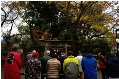
写真3 富士塚浅間神社祭礼

上記の内容から、浅間神社の由緒とともに、行事の作法が町内会に伝えられていることが分かりました。五月会の前身である富士見町西町会には「浅間神社例大祭式次第」や「浅間神社祝詞奏上」（祝詞。平成15年12月吉日 大原太郎書 91歳）があり、これを元にした祭りが引き継がれ、執り行われて来たのです。