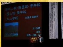
参加加盟団体の山城紹介 (写真に平成17年度開催地・五寶原高見市による山城紹介)