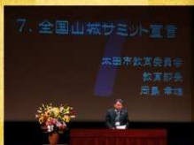
「全国山城サミット宣言」をもって協議会を閉会