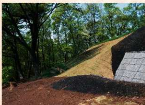
見附出丸・南土壘下のジオファイバー工法

この見附出丸では、太田市街地を含めて関東平野が一望できる絶好のビューポイントであり、整備されたこの見附出丸からの眺望も楽しんでみてはいかがでしょうか。