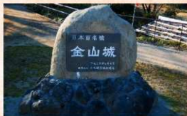
「日本百名城」の記念碑