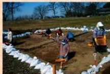
江田館跡の調査風景（南東から）

なお、曲輪からは戦国期の江田館で使用されたとされるカワラケやホウロク、瀬戸・美濃産のすり鉢や小皿などの破片のほか、中国から輸入された青磁碗の破片が見つかりました。