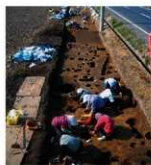
柱穴掘作業風景（東から）