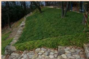
西矢倉台通路脇・法面の植栽工事

なお、市単事業では、第1期整備範囲の導入口に設置されている「総合案内板」下の舗装工事も合わせて行いました。