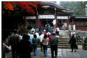
高麗神社参拝の様子

今回は、埼玉県西部の寺院めぐりということで、まず、日高市にある高麗神社と聖天院を見学しました。