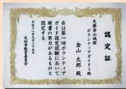
「史跡金山城跡ボランティアガイド4級」認定証

認定されたガイドの方々は、10月14日(土)・15日(日)の「第13回全国山城サミット」においても活躍されていました。