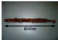
方形周溝墓から出土した鉄剣