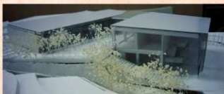
ガイドンス施設 (左) 地域交流センター (右) 模型

史跡金山城跡では、今年度から第2期整備事業に移りました。その中で、山麓の太田口に文化庁補助による「ガイドンス施設」と国土交通省補助による「地域交流センター」を一体とした施設を建設することになり、今年度は、プロポーザルにより選定された設計業者による「実施設計」を行いました。