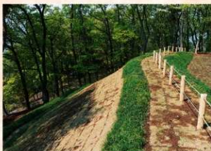
見附出丸・南土壘における遺構顕在化

平成18年度の金山城跡整備事業（補助事業）は、見附出丸・南土壘について「遺構の顕在化」を図るため、南堀切・通路跡を含めた「遺構保護」のための盛土工事と排水工事を行いました。