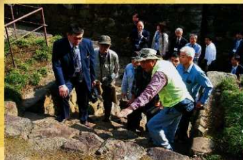
現地見学会 史跡金山城跡ボランティアガイドによる説明の様子