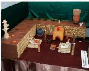
竪穴式住居の模型