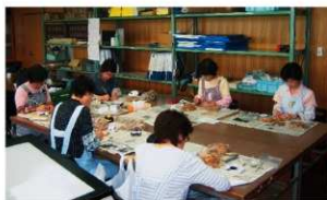
強戸口遺跡群の注記作業風景