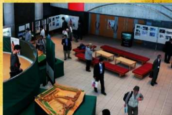
新田文化会館（エアリスホール）に設置した展示コーナー