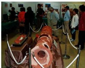
埴輪円筒棺を見る人々