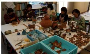
新野・脇屋遺跡群の復元作業

平成18年度は、前年度からの継続事業として実施している強戸口遺跡群や今井地区遺跡群、尾島工業団地遺跡、太田市内遺跡の整理作業に加え、新たに新野・脇屋遺跡群の遺物整理作業を実施しました。また発掘調査報告書としては、『太田市内遺跡2』を刊行しました。