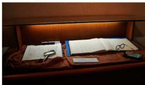
吉村昭氏の愛用品