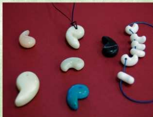
世界にひとつだけの勾玉 みんな上手にできました!!