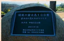
「関東の富士見100景」の銘板