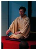
古今亭菊之丞師匠