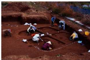
古墳時代の住居跡発掘風景（西から）

尾島東部土地区画整理事業に伴って実施した発掘調査で、古墳時代前期の住居跡1軒や奈良時代から平安時代の住居2軒等が見つかりました。なかでも、古墳時代前期の住居跡には住居を切る形で噴砂（地震時に地割れが起きて、砂が地下水とともに噴出したもの）が無数に確認されました。地割れが古墳時代前期より後の時代に起こったことは明らかですが、時代を特定するような資料は発見できませんでした。