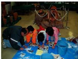
勾玉づくりにチャレンジする子ども達