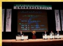
講師によるパネルディスカッション