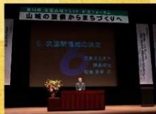
次回、平成19年度開催地は全会一致で「広島県三原市」に決定