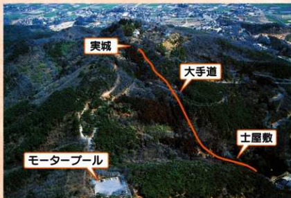
土屋敷調査位置(西から)

しかし、土塁状の遺構は、その中から、戦国時代に輸入された柴付の磁器皿や国産の小皿の破片が出土するなど、その時代の遺構の可能性が高くなり、今後の調査が期待されます。