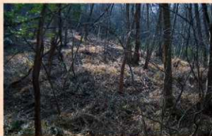
井戸沢周辺の段状曲輪群

平成18年度は、北城周辺、井戸沢周辺、彦七浦山ノ砦周辺について測量図化を行いました。