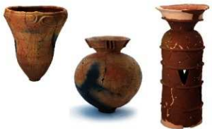
新野・脇屋遺跡群の出土遺物