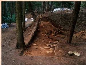
土塁状遺構(戦国時代の遺構か)