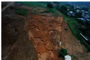
傾斜地で検出された住居群（上空西から）

また、古墳時代の方形周溝墓において、底面に礫（小石）が敷かれた主体部（お墓の埋葬施設）が確認され、ここから長さ40cmで完全な形の鉄剣が出土しました。この鉄剣は群馬県内でも類例の少ない貴重な資料です。さらに、新たに古墳時代後期の住居跡2軒が検出され、集落がさらに継続していたこともわかりました。