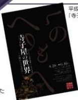
平成19年度企画展「寺子屋の世界」ポスター

資料館では、春秋年2回企画展を行っています。かつて縁切寺であったことから「三くだり半」をテーマとした企画展を19回、特別展を8回開催しました。18年度は新太田市誕生一周年記念特別展