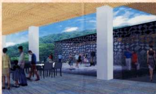
コミュニティスクウェアのイメージ