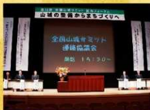
1日目 15:30～ 全国山城サミット連絡協議会 開催