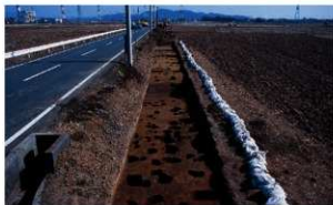
多数見つかった掘立柱建物の柱穴跡（西から）

中屋敷東遺跡では、古墳時代前期から後期の住居跡3軒や土坑20基等が見つかりました。村田・本郷遺跡では、古墳時代から古代の住居跡4軒、井戸2基等が見つかりました。また、中世の周囲を溝で囲われた館跡が1箇所確認されました。館跡は東西方向で約35mの範囲を溝で区画しています。西側を二重の溝跡、東側を三重の溝跡で囲われており、溝の内側にはおびただしい数の柱穴が見つかりました。この柱穴は掘立柱建物の柱を埋めた跡と考えられ、数回におよぶ建て替えが行われたと考えられます。館の年代は室町時代から戦国時代と考えられ、溝からこの時代のカワラケ（素焼きの土器）や磁器の破片が出土しています。この館跡は地元で田中屋敷と呼ばれていたという言い伝えがあります。