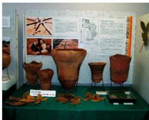
新野脇屋遺跡群の縄文土器

来場された方は、新野・脇屋遺跡群の巨大な埴輪円筒棺や、土器の復元作業を紹介するコーナーに注目していたようです。また、勾玉づくりコーナーでは、子どもたちが勾玉づくりにチャレンジしました。