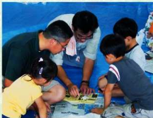
子どもおとも真剣です!! （職員からつくり方の説明を受けている様子）

夏休み期間を利用し、太田市内在住の小学生とその家族を対象に「ふれあい文化財教室」として勾玉づくり体験を開催しました。