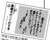
平成18年度企画展「飯盛女の三くだり半」の図録表紙

として「女大学の世界」、三くだり半企画展として「飯盛女の三くだり半」を開催しました。19年度春の企画展は、特別展「寺子屋の世界」を4月28日(土)～6月10日(日)に開催します。