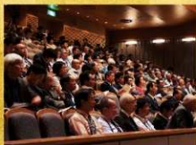
全国山城サミット連絡協議会 会場の様子 (新田文化会館エアリスホール)

太田市の山城である史跡金山城跡では、ボランティアガイドによる現地説明会を開催しました。金山に親しみと誇りを持つことができたと、現地で丁寧な説明を受けた多くの方たちから喜びの声がありました。