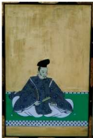
「藤原仲文」絵図 修復前（左）修復後（右）

「板面著色三十六歌仙図」の修復事業は、平成18年度は「頼基朝臣」（作者不明）「壬生忠岑」（作者不明）「藤原仲文」（狩野元俊）3枚の剥落止め及び模写を実施しました。