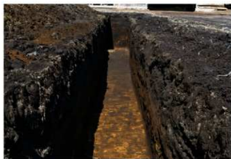
4. 1トレ (南から)