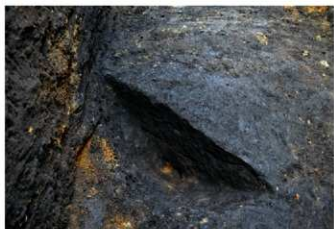
5. 2トレ掘り込み断ち割り後 (南から)