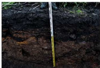
5. 2トレ土層 (東から)