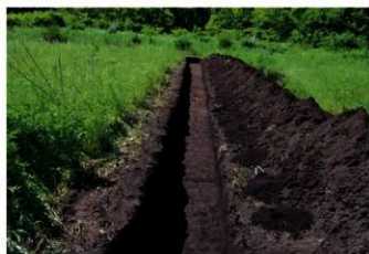
6. 5トレ (南から)