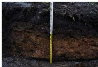
2. 3トレ土層 (北から)