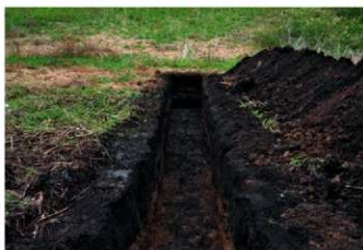
2. 1トレ (南から)