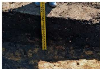
4. 1トレ土層2（北東から）