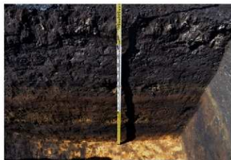
5. 1トレ土層1 (東から)