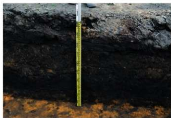
2. 2トレ土層 (北から)