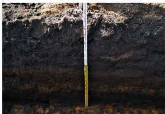
1. 1トレ土層2 (東から)