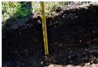
7. 5トレ土層1 (東から)