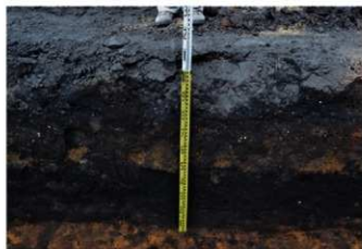
5. 3トレ土層 (西から)