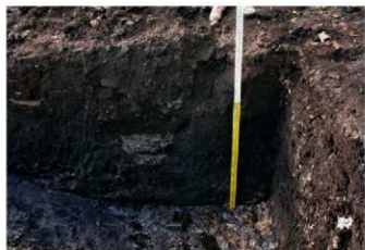
5. トレンチ土層 (北から)