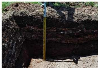
3. 1トレ土層1 (北から)