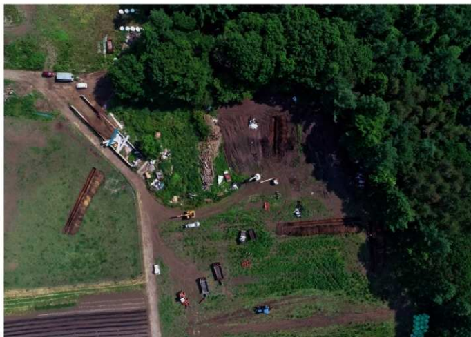
3. 応桑字小菅 調査区全景（北上から）