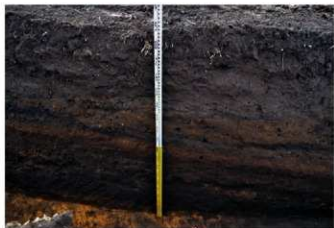
7. 3トレ土層1 (東から)