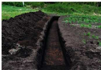
2. 1トレ (南から)