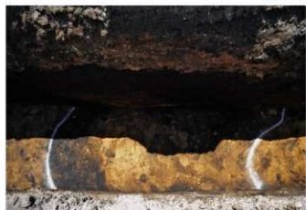
2. 2トレ風倒木痕（北から）