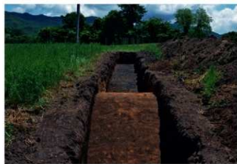
2. 1トレ (西から)