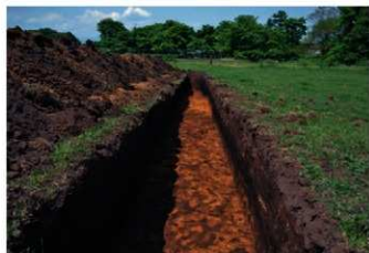
6. 4トレ (南西から)