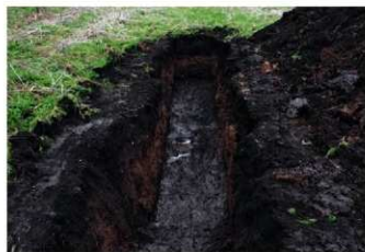
1. 3トレ (東から)