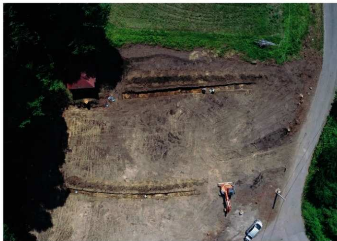
1. 応桑字滝原 調査区全景（北上から）