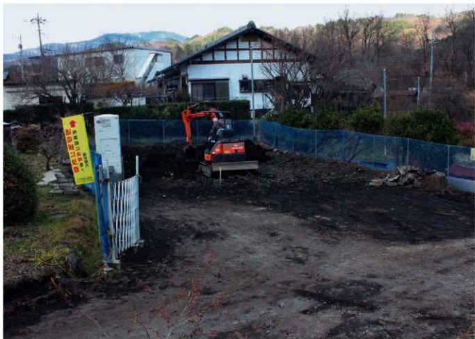
3. 長畝Ⅱ遺跡Ⅴ 調査区全景 (東から)