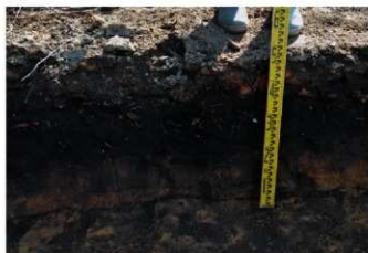
1. 2トレ土層 (北東から)