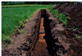
5. 2トレ (西から)