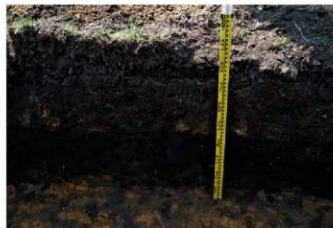
7. 4トレ土層 (南東から)