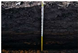
3. 2トレ土層 (東から)