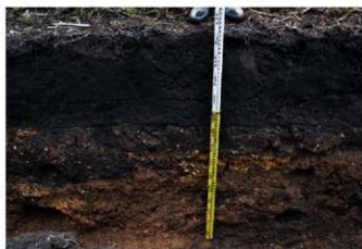
3. 1トレ土層 (東から)