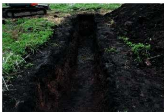
4. 2トレ (南から)