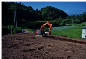
2. 埋め戻し状況 (南から)