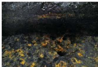
2. 2トレ掘り込み② (西から)