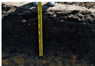
3. 1トレ土層1（北東から）