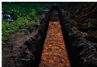
1. 2トレ (東から)