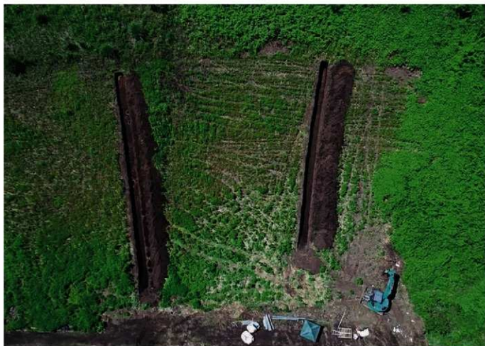
1. 榛木沢遺跡 4トレ～5トレ (南上から)