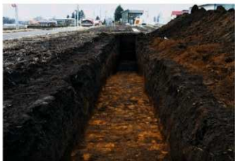
6. 3トレ (南から)