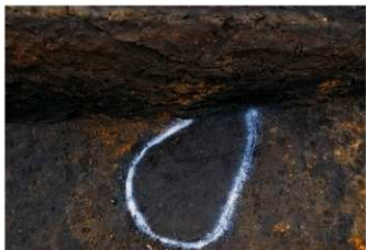
4. 2トレ掘り込み (東から)