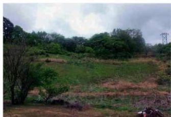
2. 調査区試掘前風景 (南から)