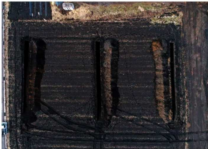
3. 北軽井沢字大屋原② 調査区全景 (南上から)