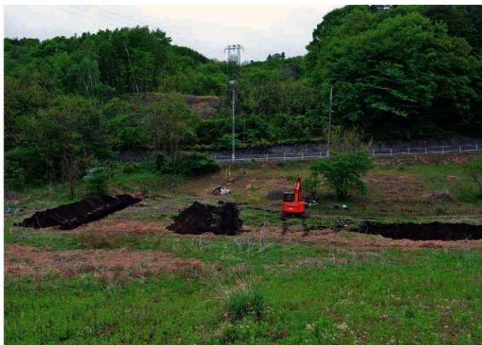
4. 榛木沢遺跡 1トレ～3トレ (北から)