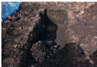
4. トレンチ (東から)