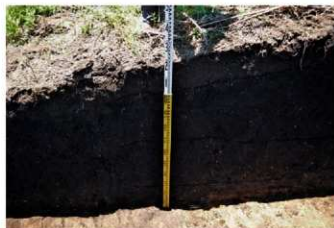
4. 4トレ土層1 (東から)