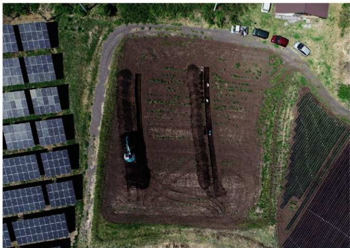
1. 堂光原Ⅱ遺跡 調査区全景 (南上から)