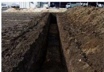
2. 2トレ (南から)