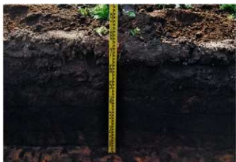
5. 2トレ土層 (東から)