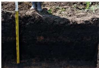
3. 1トレ土層 (東から)