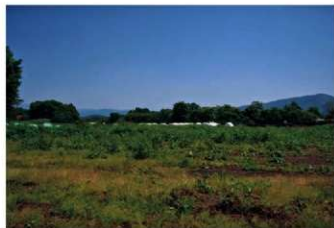
8. 調査区試掘前風景 (南から)