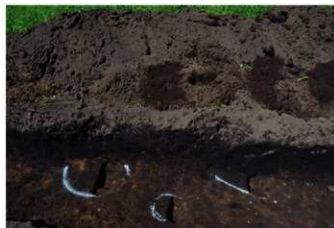
8. 5トレ掘り込み① (西から)