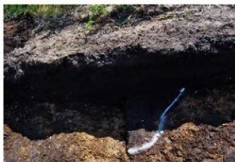
1. 5トレ掘り込み② (東から)