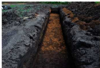
4. 3トレ (北から)