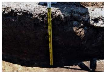
4. 1トレ土層2 (北から)