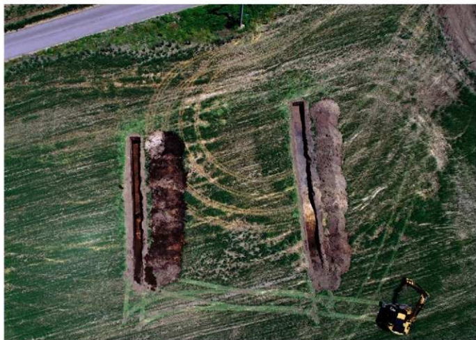
1. 北軽井沢字大屋原① 調査区全景 (西上から)