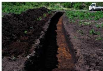
4. 2トレ (南から)