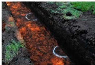
3. 2トレ掘り込み (北から)