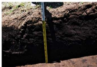
5. 4トレ土層2 (東から)