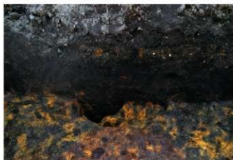
1. 2トレ掘り込み① (東から)