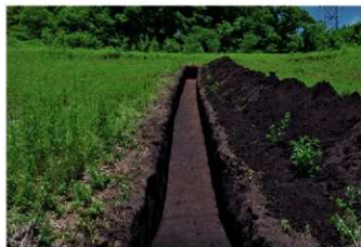
3. 4トレ (南から)