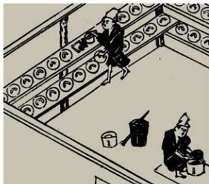
図2 油煙取りのようす『古梅園墨談』より部分転載