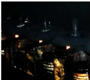
写真3 現在の採煙のようす