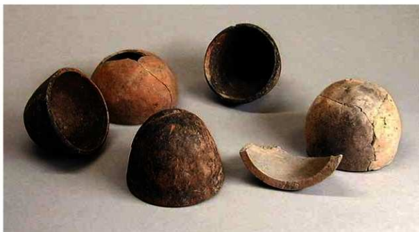
写真1 京都市内で出土した丸底小鉢

はじめに この土器の名前は、小振りな土師質の器につけた仮の名称です。使用方法もはっきりとはしていないので正式名ではありません。京都の遺跡からは、土器・陶磁器をはじめ各種の遺物が数多く出土しますが、それぞれに注目するとまだ用途が理解できていないものがたくさんあります。土師器の丸底小鉢もその一つです。この器を紹介し、その用途などを考えてみます。