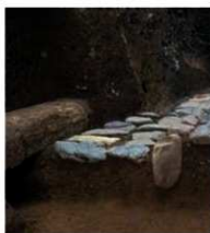
基壇部分写真（南東から）

土盛の基壇となった西回廊は、徐々に内側に崩れていったようです。追加された石列も埋まってきました。そんなある日、内裏を大きな火災が襲いました。10 世紀中頃のことです。露出していた石列の一部が焼け焦げていることや