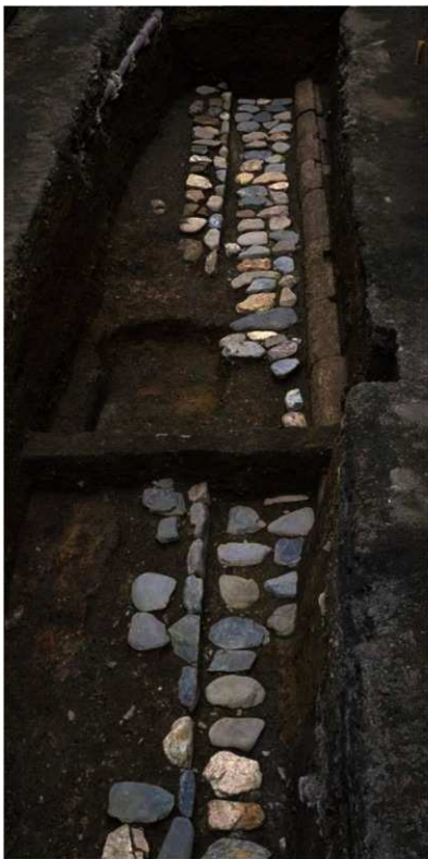
内裏内郭回廊部分（北から）

調査区の西端には南北方向に黄色っぽい切石が並んでいます。これは回廊の基壇の基底部に据えられた地覆石という部材で、凝灰岩(火山灰が固まってできたもの)を用いています。地覆石には、内側部分の上端に羽目石や東石を組み合わせるための加工がしてあります。よく観察すると石が組み合わさった痕もうっすらと残っていました。その上にはさらに葛石が組み合わさっていたはずですが、こ