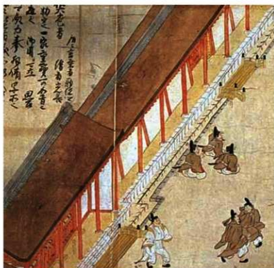
絵巻物に描かれた内裏内郭回廊（承明門付近）

基壇の中央に築地塼を建ち上げ、両側に屋根を架け、柱で受ける。屋根は檜皮葺で軒先は雨落溝の上までのびていた。築地塼の内側と外側を通行でき、ここを兵衛とよばれる武官が交替で警備にあたった。（田中家蔵『年中行事絵巻』『日本の絵巻 8』中央公論社 1987 年より転載）