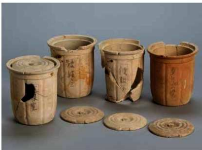
火消壺 右端の壺の高さ15.5cm