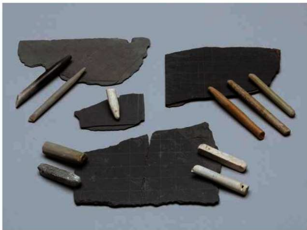
石盤と石筆 下の石盤の長さ12.0cm

http://www.kyoto-arc.or.jp (公財)京都市埋蔵文化財研究所・京都市考古資料館