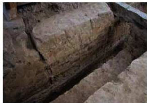
平安時代前期の築地欄と下層の自然流路断面

混じる土を入れて上面のみを叩く手法で造られたため、中心部分は縮まりがほとんどありません。