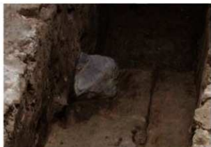
平安時代前期の築地欄柵柱礎石