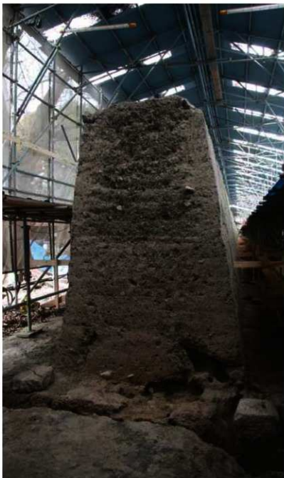
東築地塼断面(南東から)

慶長期の築地塼 現存する東築地塼の大部分は、文禄5年(1596)の大地震で崩壊した後、豊臣秀頼によって慶長3年(1598)頃に再