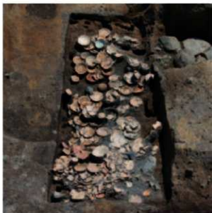
室町時代の土葬墓