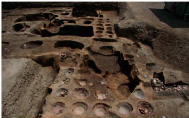
中央に並ぶ埋塚群と、右下に土葬墓が見える

はじめに 2008年5月から9月にかけて、烏丸通と綾小路通の交差点を約50m西に入った場所で開催調査を実施しました。調査地周辺は現在、オフィスビルや商業施設の立ち並ぶ繁華街ですが、中世京都においても商業の中心地として栄えた場所にあたります。