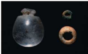
水晶製の数珠玉やガラス小玉