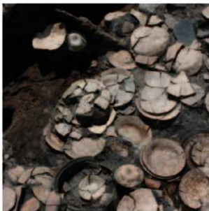
埋納されていた器や鉄製の刀

られたものも数点見受けられました。中央には青銅製の鍋と鉄製の蓋が置かれ、その横からは桃の種が出土しています。東端の頭部付近と考えられる場所には、中国製の白磁皿が置かれていました。南壁際では鉄製短刀が斜めに傾いた状態で出土しました。その他に、漆器皿や水晶製の数珠玉やガラス小玉、銅銭などが出土しています。