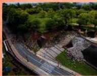
被災状況 H28(2016) 4月

崩落した石材を回収して、安全対策を行いました。平成30年11月に通行できるようになりました。