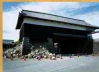
被災状況 H28(2016) 4月