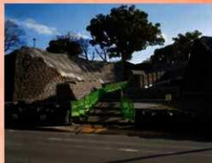
道路開通 H30(2018) 11月