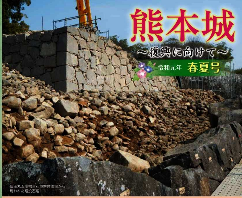
飯田丸五階櫓台石垣解体現場から 現われた埋没石垣