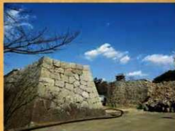
解体終了 H31(2019) 3月