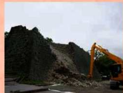
崩落石材回収作業 H30(2018) 5月