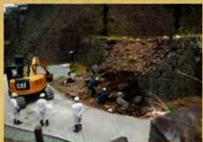
二様の石垣南側石垣崩落石材回収 奥は二様の石垣 (令和元年6月8日)