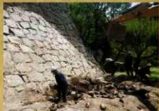
地籠門石垣崩落石材回収 奥は二様の石垣 (令和元年7月26日)