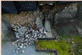
小天守入口部被災状況 (平成28年5月11日)