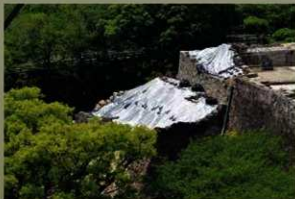
熊本市役所14階からの風景 (令和元年7月4日)

石垣の変状した部分の解体が終了し、五階櫓石垣に隠れていた築城当初の石垣が見えています。外側の石垣が積み直されると埋め戻されるので、築城当初の石垣が見られるのは今だけです。熊本市役所14階や長塀通りからも観覧できます。