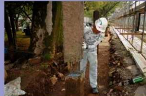
控柱の補修作業 (令和元年7月5日)