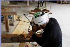
破損部材の補修作業 (平成31年4月18日)