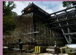
櫓本体用の足場を設置 (令和元年8月22日)