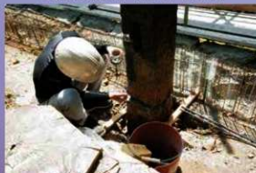
控柱の補修作業 (令和元年8月2日)