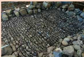
小天守石垣補強材敷き込み状況 (平成31年4月22日)