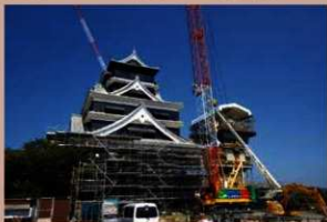
小天守最上層に仮設置架を設置 (令和元年6月25日)

大天守の外観工事がほぼ終了し、1階出入口部分と内装工事を行っています。小天守は石垣復旧が完了し、4階外観復旧工事を行っています。天守閣全ての復旧完了は2021年暮を目指しています。