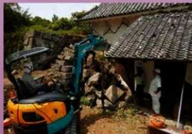
石材回収作業 (令和元年8月5日)

櫓復旧に向けて、まず地震により大きく変状した石垣の崩落防止のための、仮設の構台を設置しました。現在、櫓本体の解体保存工事に着手しており、櫓の横に崩落していた石材も回収しました。