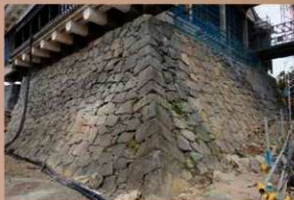
大天守石垣積み直し完了 (平成31年1月8日)