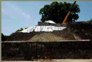
竹の丸から(南から) (令和元年6月10日)