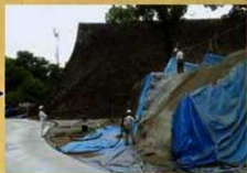
モルタル吹きつけによる安全対策工事 奥は二様の石垣 (令和元年6月21日)

特別公開第2弾ルートとなる、特別見学通路周辺の崩落石材回収を行いました。石材回収後は、安全対策工事を行っています。