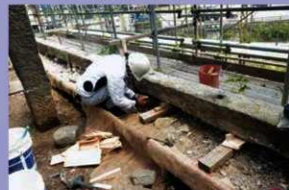
塀基礎石設置作業 (令和元年8月8日)