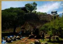
西櫓門石垣崩落石材回収 奥は大手守 (令和元年7月12日)