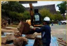
地籠門石垣崩落石材回収 奥は二様の石垣 (令和元年7月24日)