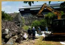
西櫓門崩落石材回収 奥は数寄屋丸二階部広場 (令和元年6月13日)