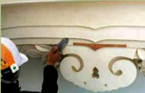
附櫓の漆喰仕上げ作業 (2019年12月16日)