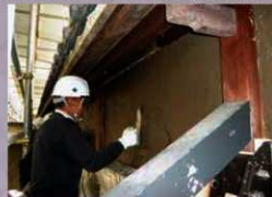
土壁塗り作業 (2020年4月2日)