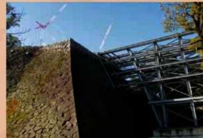
櫓本体の解体が終了した平櫓 (2020年1月29日)