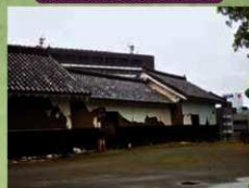
被災後：櫓本体の傾き（2016年4月20日）