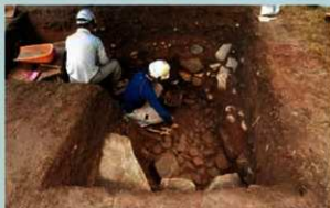
発掘調査風景 (2019年9月2日)