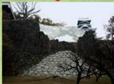
対策：崩落面をモルタルで吹き付け （2020年3月26日）