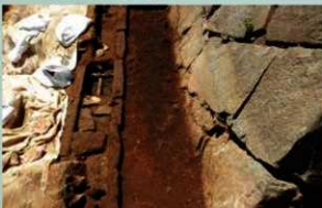
石組溝を確認 (2019年7月31日)