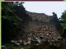
被災後：石垣の崩落（2016年4月20日）