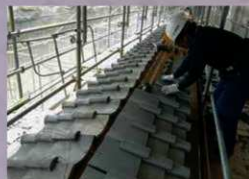
瓦葺き作業 (2020年4月13日)