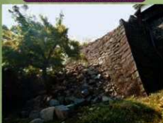
被災後：石垣の崩落（2016年4月20日）