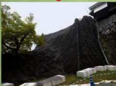
対策：鉄筋ネットで覆う （2020年3月26日）