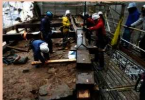
建築部材解体作業 (2019年12月26日)

櫓本体の解体工事は、2019年12月に終了しました。回収した建築部材は、倉庫に保管しています。現地には、石垣崩落防止用の鉄骨が残されています。