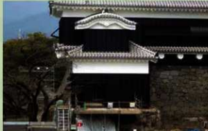
附櫓外観完成 (2020年1月9日)