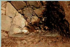
櫓台石垣の基底部を確認 (2019年7月8日)

五階櫓台石垣の解体後2019年6月から9月に、石垣基底部の発掘調査を行ないました。その結果、五階櫓台石垣がどのように築かれたのかがわかりました。また、江戸時代の石組溝や、刻印の発見もありました。これらの成果は、石垣の復旧に活かされます。