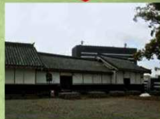
対策：倒壊防止（ワイヤとおもいで固定） （2020年3月26日）