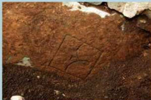
埋まっていた碁石の刻印 (2019年7月8日)