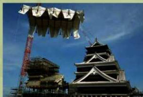
小天守仮設屋根の撤去 (2019年11月7日)

大天守の外観工事としては最後になっていた附櫓の工事も終了しました。現在、内装工事等を行なっています。小天守は鯉瓦の復旧工事が2019年11月に終了し、4階から外観復旧工事を行なっています。天守閣全体の復旧完了は2021年春の予定です。