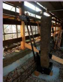
筋交い設置作業 (2019年8月8日)