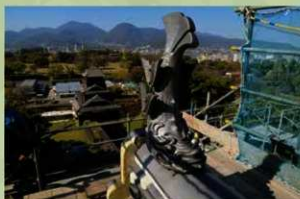
小天守鯉瓦設置完了 (2019年11月25日)