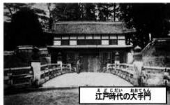
江戸時代の大手門

水戸城大手門は、江戸時代、大手橋の東側に建っていた、二階建ての城門です。「大手」とは、お城の正面という意味ですから、大手門は、水戸城の顔ともいうべき、最も大切な門でした。