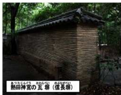
熱田神宮の瓦塼（信長塼）