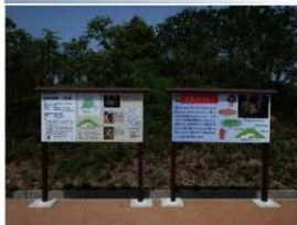
小金古墳群3号墳と整備された看板

隣接の斎宮きららの森駐車場をご利用ください。また、現在横穴式石室は危険防止と保護のため、埋め戻した状態になっており、内部の見学はできません。看板の裏にあるのが古墳です。