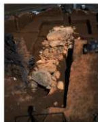
死者が納められた部屋 (横穴式石室)

中央にくぼんでいるのが墓道で、奥に石室が見えます。墓道を通して死者を石室の中に運び、道は葬ったあとに埋めました。道の左右には、石が積まれているところがあります (墓道側壁)。