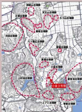
玉城丘陵の主要古墳群地図

このあたりは、古墳が造りやすい場所であったとともに、近くにはたくさんの方が住んでいたのでしょう。