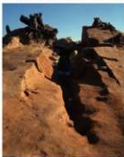
石室に通じる道 (墓道)

中央にくぼんでいるのが墓道で、奥に石室が見えます。墓道を通して死者を石室の中に運び、道は葬ったあとに埋めました。道の左右には、石が積まれているところがあります (墓道側壁)。