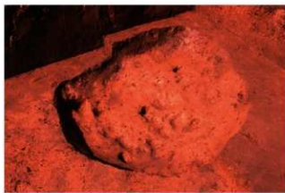
1号土壇 完掘 (P地点)