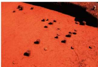
Ⅹ層石器集中 1 (J地点)