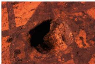
3号土壇 完掘 (E地点)