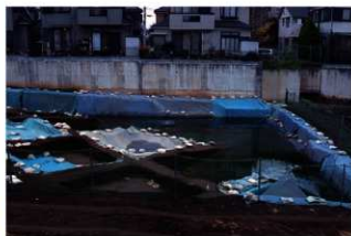
湧水状況 9月下旬～11月上旬 (P地点)