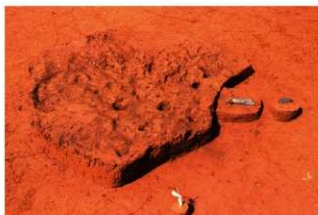
2号土壇 完掘 (J地点)