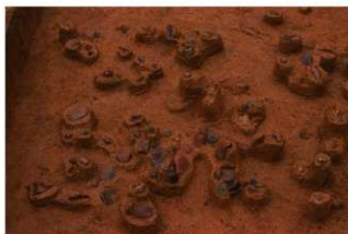
Ⅳ層上部礫群 8 (E地点)