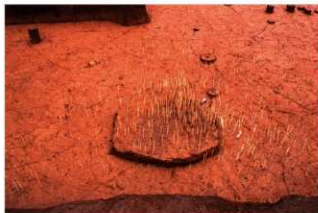
2号土壇 炭化物検出状況 (J地点)