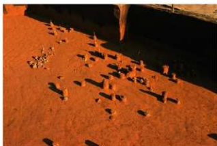
Ⅳ層上部石器集中 5, 礫群 7 (E地点)