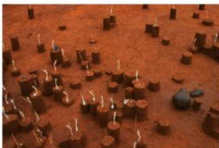
Ⅸ層石器集中 1 (J地点)