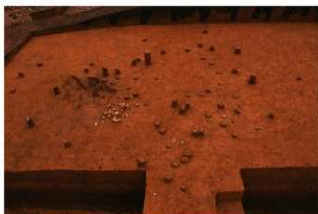
Ⅳ層上部石器集中 7, 礫群 11 (E地点)