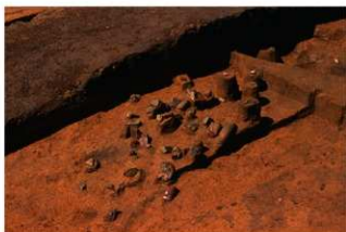
Ⅳ層上部石器集中 6, 礫群 9 (E地点)