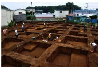
調査風景（南西から）