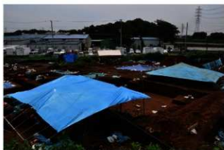
調査風景（北西から）