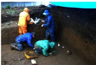
調査風景（南東から）