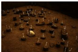
Ⅸ層石器集中Ⅰ（西から）