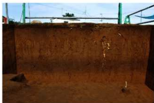
2T-32 グリッド土層断面 (東面)