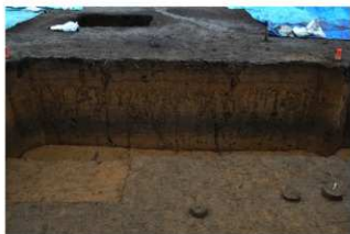
2T-35 グリッド土層断面 (東面)