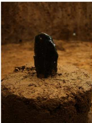
Ⅸ層石器集中2 ナイフ形石器