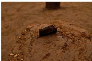
Ⅶ層石器集中3 ナイフ形石器