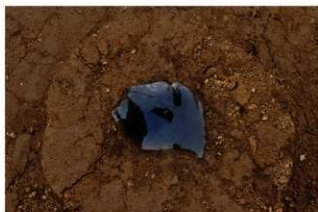
V層石器集中4 使用痕のある剥片