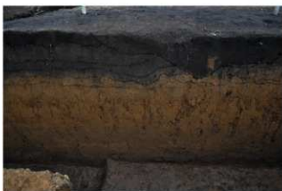
2T-40 グリッド内土層断面 (西面)