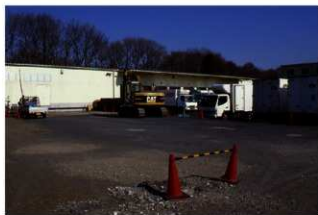
調査前全景（南から）