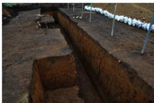
2T-38～41 グリッド内土層断面 (西面)