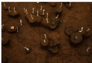
Ⅸ層石器集中1（東から）