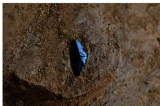
V層石器集中2 ナイフ形石器