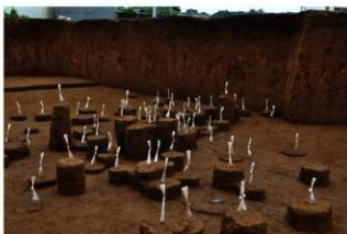
Ⅶ層下部石器集中4（南西から）