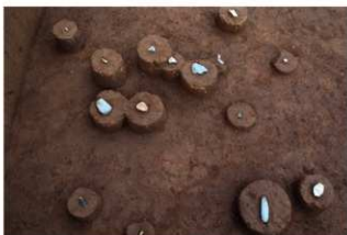
VII層石器集中1（南西から）