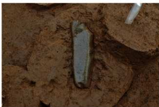
Ⅶ層下部石器集中4 敲石