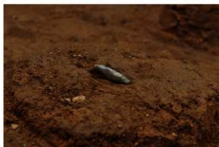
Ⅶ層下部石器集中4 ナイフ形石器