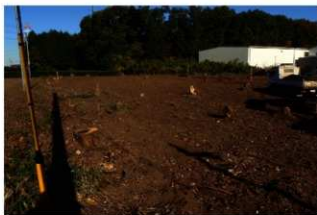
調査前全景（南から）