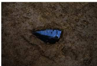
IX層石器集中2 ナイフ形石器