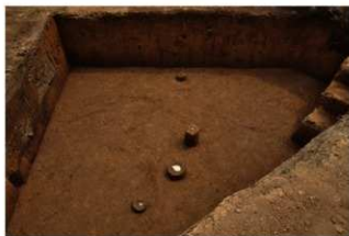
VII層下部石器集中7 (北から)