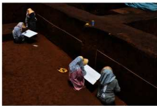
調査風景 (南西から)