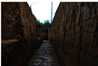
2T-38～41 グリッド内土層断面