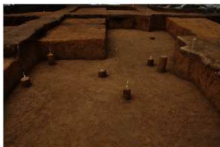
Ⅶ層石器集中2（南から）