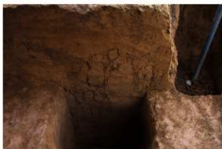
2J-26 グリッド土層断面 (南面)