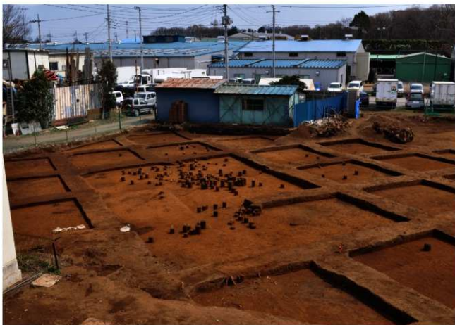
Ⅲ層上部石器集中1・2・3・4（北西から）