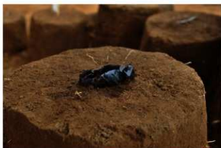
Ⅲ層上部石器集中1 石核