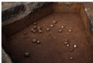
VII層石器集中1（北から）