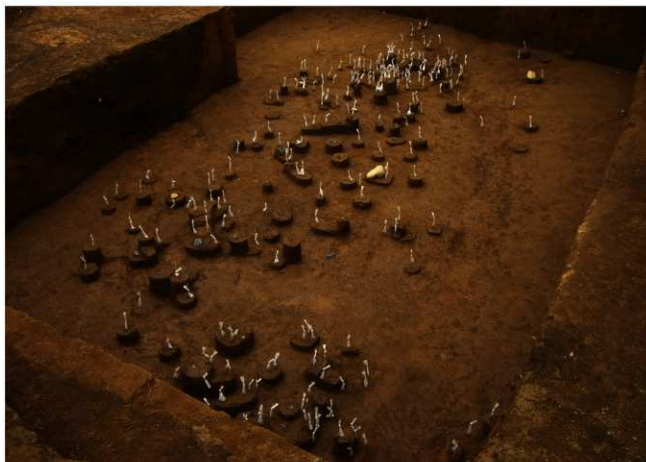
Ⅸ層石器集中Ⅰ（北東から）