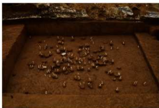
Ⅸ層石器集中2（南東から）