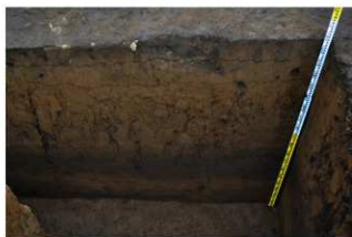
2T-38 グリッド内土層断面 (西面)