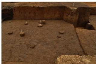
Ⅶ層石器集中3（南から）