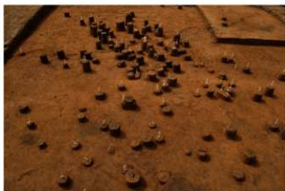
Ⅲ層上部石器集中2 (東から)