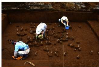
調査風景（南東から）