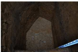
2T-41 グリッド内土層断面