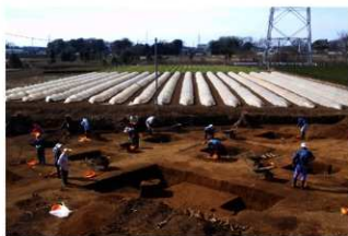
調査風景（北東から）