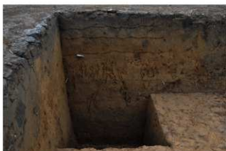
2R-37 グリッド土層断面 (南面)