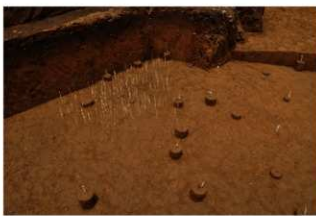
V層石器集中2・炭化物集中（南から）