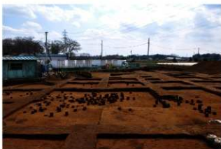
Ⅲ層上部石器集中1・2・3・4（北から）