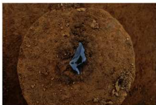
Ⅲ層上部石器集中2 ナイフ形石器