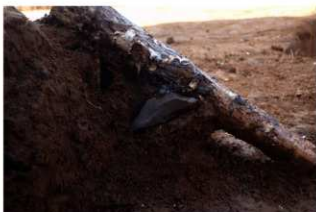
V層石器集中5 ナイフ形石器