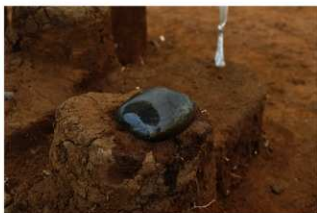
Ⅲ層上部石器集中2 敲石