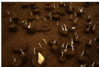
Ⅸ層石器集中2（南西から）