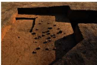
V層石器集中4（北から）