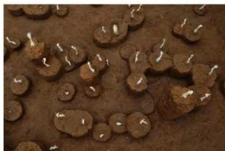
Ⅶ層下部石器集中4（南から）