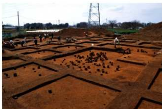
調査風景（北東から）