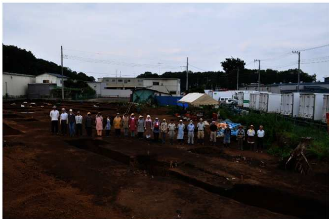
第3地点 調査風景（南西から）