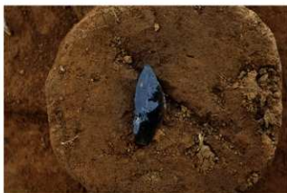
Ⅲ層上部石器集中2 ナイフ形石器