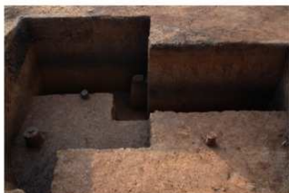
Ⅶ層下部石器集中1（東から）