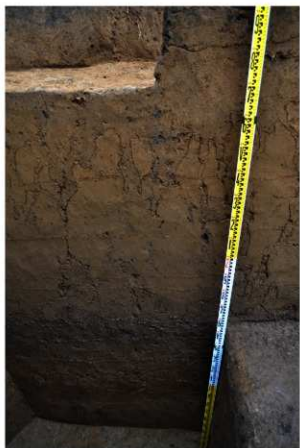
2T-41 グリッド内土層断面 (西面)