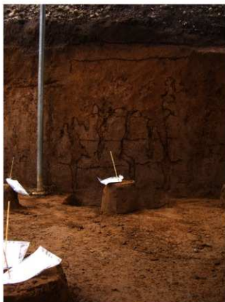
2J-26 グリッド土層断面 (北面)