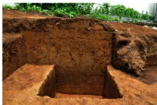
2S-31 グリッド土層断面 (北面)