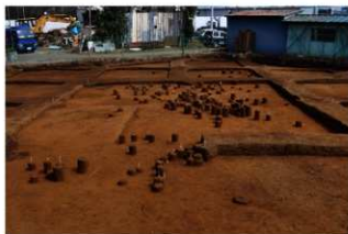
Ⅲ層上部石器集中1・2・3 (西から)