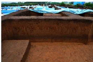
2T-33 グリッド土層断面 (東面)