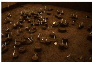
Ⅸ層石器集中2（北東から）