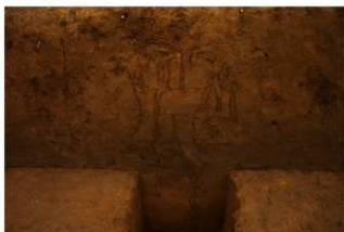
2L-24 グリッド土層断面 (北面)