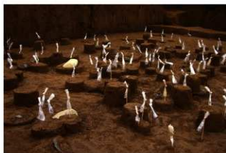
Ⅸ層石器集中2 (南から)