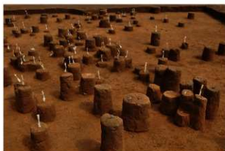
Ⅲ層上部石器集中2 (西から)