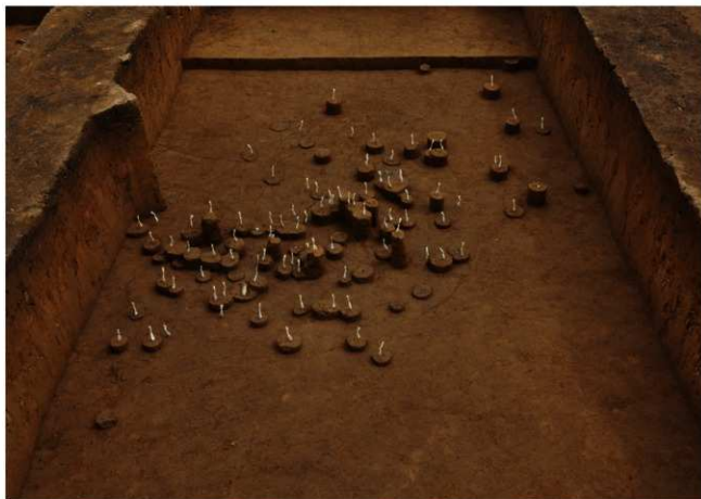
Ⅶ層下部石器集中4（北から）