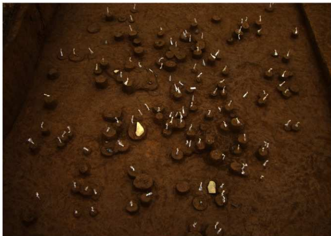
Ⅸ層石器集中2 (南西から)