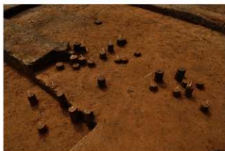
Ⅲ層上部石器集中1 (北東から)