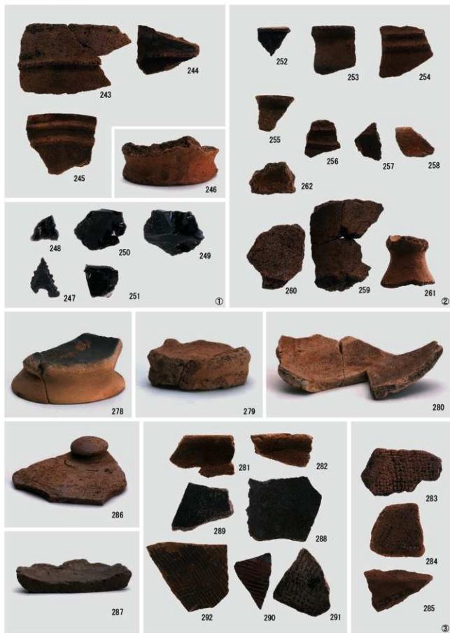
① 竪穴住居跡出土遺物 ② 弥生時代・古墳時代の土器 ③ 古代の遺物