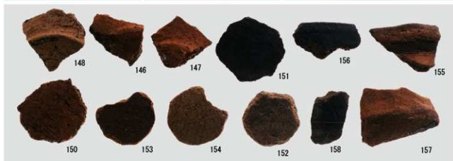
縄文時代後期の土器 (Ⅶ・Ⅸ・Ⅹ・ⅩⅠ類) 縄文時代晩期の土器