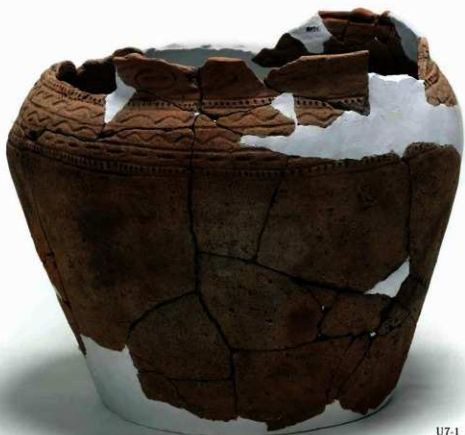
U7-1 (約 1/3)