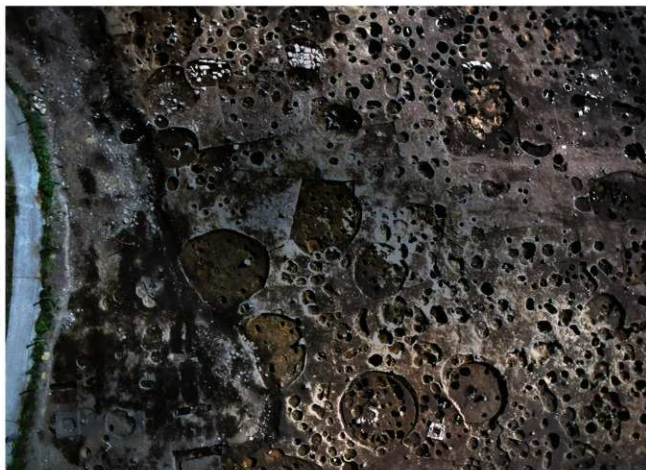
A区の谷状低地と居住域(真上から)