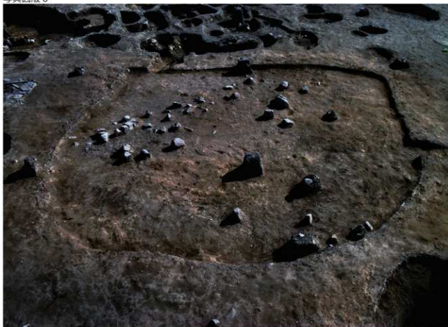
5号住居(手前)と6号住居(奥・平安時代)