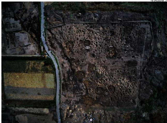
A区とB区南端(真上から)