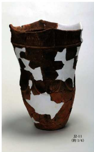
J2-11 (約 1/4)