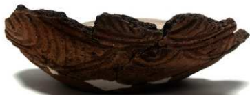
U1-2 (約 1/3)