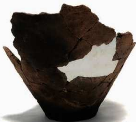
U8-1 (約 1/4)