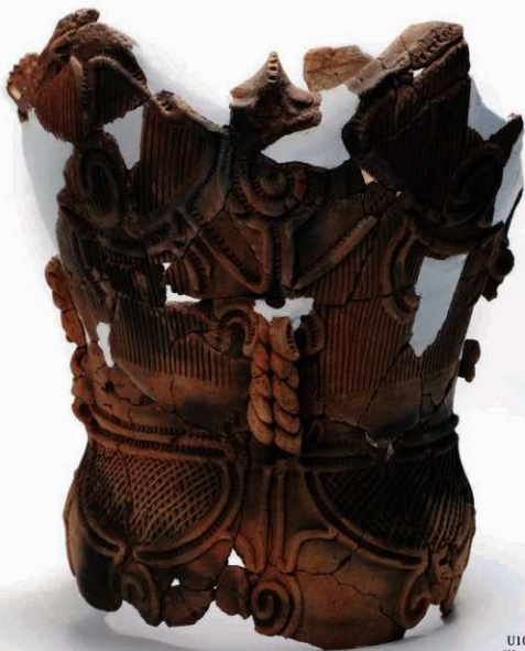
U10-1 (約 1/4)