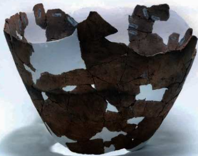
U2-1b (約 1/4)