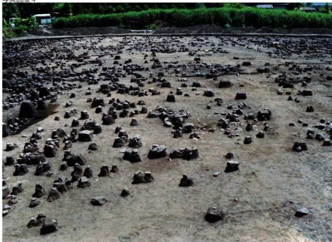
居住域上面の残群 (西から)