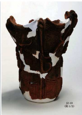
J2-10 (約 1/3)