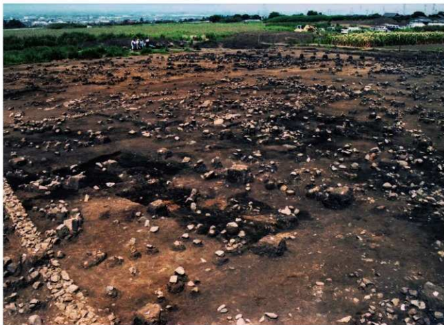
居住域上面の残群 (南東から)