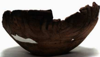
U1-1 (約 1/3)