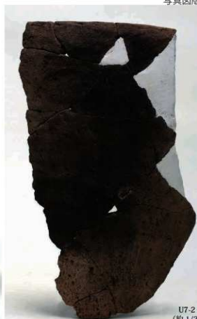
U7-2 (約 1/3)