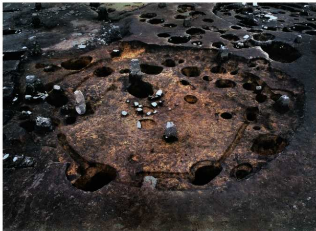
2号住居(旧)(中央)と3号住居(左手)