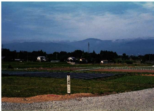
調査終了時の状況