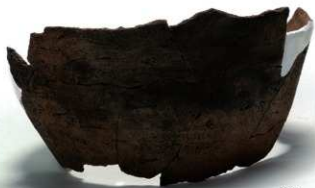
U6-1 (約 1/4)