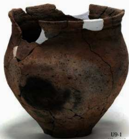
U9-1 (約 1/4)